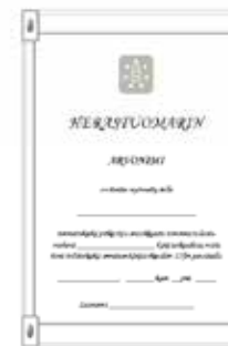
Herastuomarin arvonnimikirja 10 €/kpl