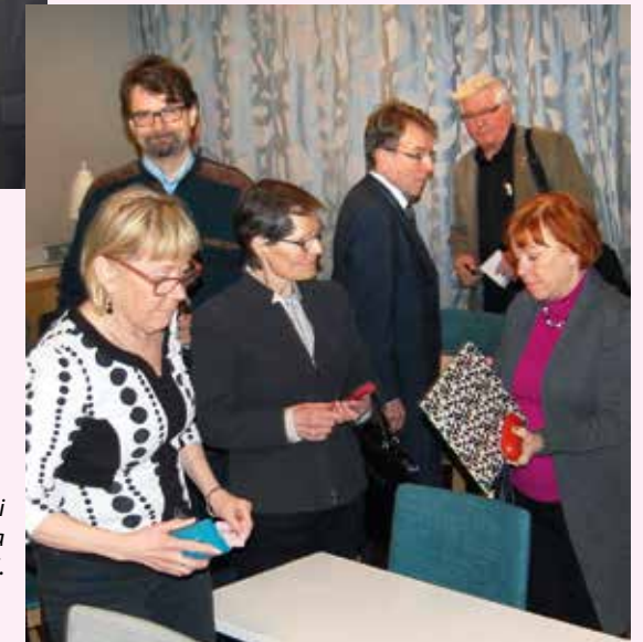
Vuosikokous sujui rauhallisesti ja nopeasti.