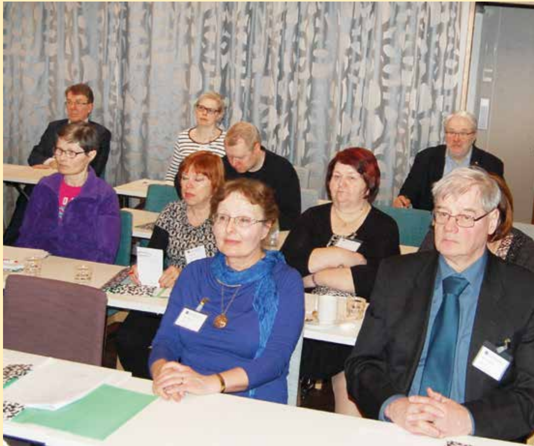
Rovaniemen koulutusluennoilla oli ennätyskellisen pieni osallistujamäärä.