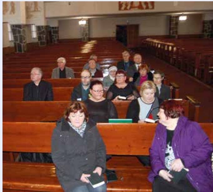
Rovaniemen lautamieskirkon osallistujia.