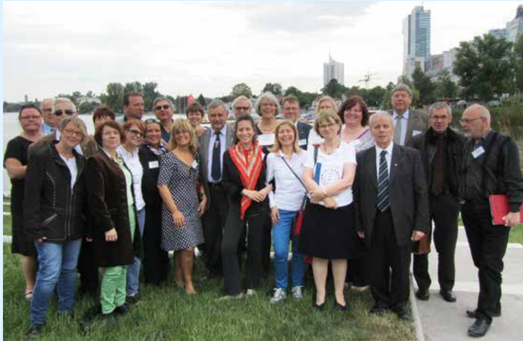
Kuvausta varten siirryttiin vanhan Tonavan rantapenkalle. Kaikki osallistajat eivät ehtineet yhteisvalokuvaan.

Teksti: Ralf Asplund ja Anu Heinänen.