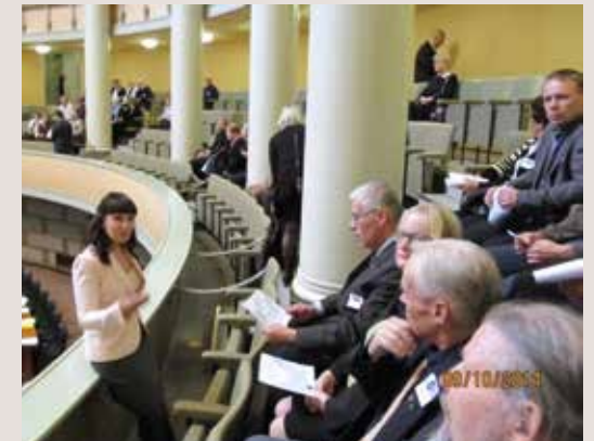
Rautaisannos eduskunnan historiaa satakuntalaisille.