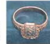
Kultasomus herastuomarille tai lautamiehelle erikoistilauksesta