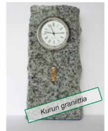
Pöytäkello, jossa ht- tai lm-merkki korkeus n. 10-12 cm, 60 €

Toimituskuluina lisätään 7 € (tai 12 € standaanin lähetys) Tilaukset: www.suomenmaallikkotuomarit.fi > Lautamiestuotteet tai posti: jarjestosihteerit@suomenmaallikkotuomarit.fi