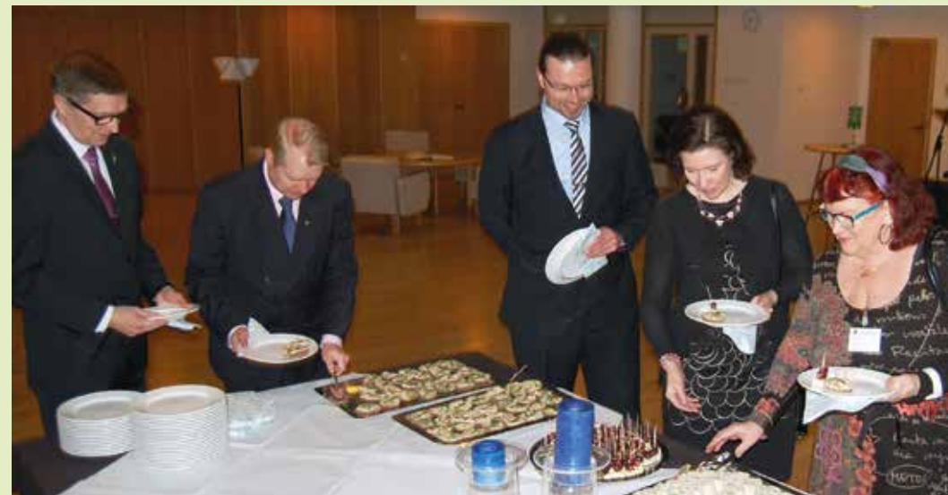
Rovaniemen kaupunki tarjosi maallikotuomareille ja luennoitsijoille kaupunkitietoa ja kevyttä iltapalaa.