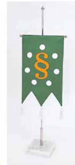
Suomen lautamiehet ry:n standaari 45 €