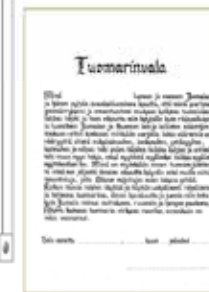
Tuomarinvalatodistus 10 €/kpl