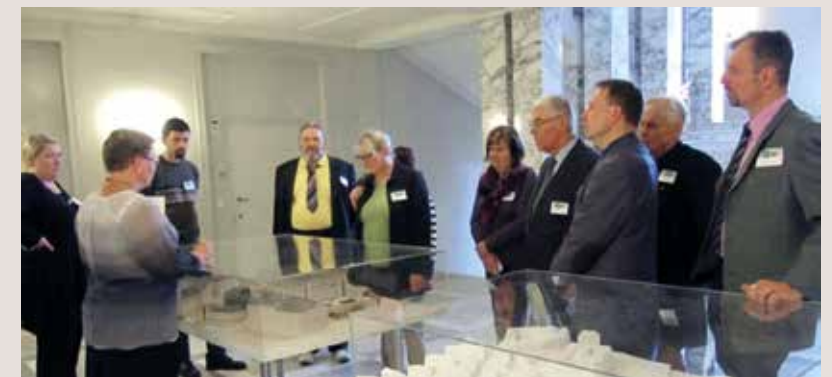
Matkalla oli mukana noin parikymmentä henkilöä Satakunnan Maallikkotuomarit ry:n johtokunnasta ja jäsenistöstä.