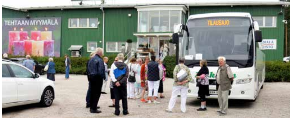
Yllätysmatkalaisia saapumassa Finnmarin tehtaanmyymälään, alla ostoksilla myymälässä ja alinna ensimmäiset matkalaiset astumassa Suomen Neitoon

Nousimme Suomen Neito nimiseen laivaan, joka risteilee reitillä Vesijärvi - Vääksyn kanava – Päijänne. Laivaan nous-