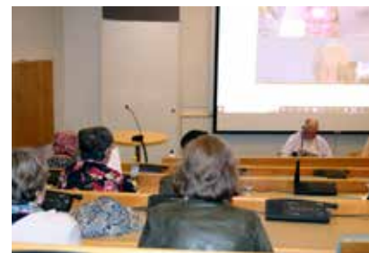
Kelon kevätkokous pidettiin 24.5.2022 JHL:n auditoriossa. Vasemmalla kokousväkeä ja Oikeanpuoleisesta näkee, miten nykytekniikalla osallistutaan kokouksiin "etänä".