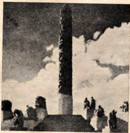
Frogneparkenin eli Vigelandin puiston huomattavimpiin nähtävyyksiin kuuluu tämä monoliitti, jonka koosta saa jonkinlaisen käsityksen, kun tietää, että sen juurella olevat ihmiset esittävät veistokset ovat suunnilleen luonnollista kokoa.

900 vuotta vanha Oslo on pinta-alaltaan maailman suurimpia kaupunkeja (456 km 2 ) ja sen palotoimi on ehkä pisimmälle kehitetty pohjoismaisista suurkaupungeista. Tässä mielessä suomalaisten 19 jäseninen osanottajajoukko odottikin matkasta antoisaa. Opintopäivien ohjelma oli suunniteltu sangen tiiviiksi ja sisälsi se esitelmää mm. Oslon palokunnan organisatiosta, vesilaitoksesta, Oslon kunnasta, korkeapainesumu- ja pulverisammutustekniikasta, sammutusnäytöksineen, Norjan rakenteellisesta- ja teollisuuden palotorjunnasta, Norjan taloudesta, Norjan kunnantyöntekijäin liitosta, palovakuutusasioista, palonsyöttökimuksista jne. Esitelmää oli havainnollistettu raina- ja elokuvaesityksillä. Lisäksi oli järjestetty tutustumiskäyntejä eri paloasemille ja merimatka Oslon palokunnan ruiskuveneillä, jolloin itse ruiskuveneisiin tutustumisen lisäksi vierailtiin tutkimas-