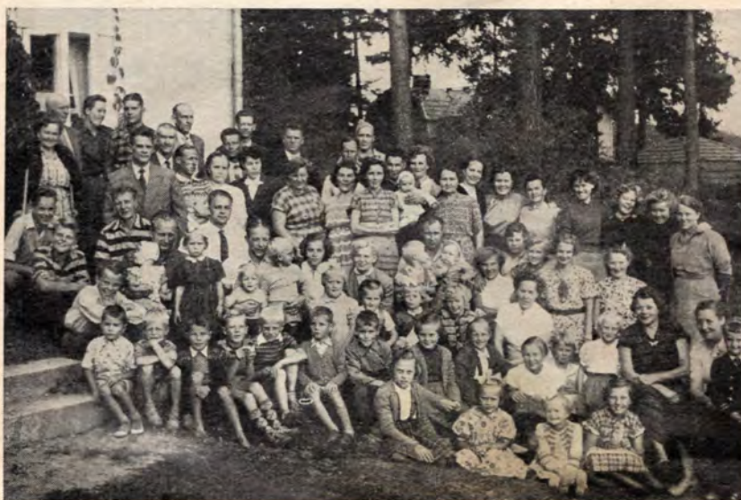
Osaston jäseniä perheineen ryhmittyneenä kesäkodin edustalle.

Vuosi 1946 oli vilkasta toiminnan aikaa; yleensä työväen järjestöissä on symbolina punainen lippu ja niinpä sai osastokin ensimmäisen lippunsa, joka vihittiin huhtikuun 5. päivänä 1946. Palkka- ja työehtosopimukset olivat myös uudistusvaiheessa ja tulivat ne voimaan 1. päivänä heinäkuuta ja saatiin silloin palkkoihin