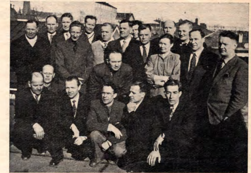
Turun kunnantyöntekijäin lakkotoimikunta yleislakon aikana.

Osaston toiminta vuonna —40 pyrittiin kohdistamaan etupäässä palkka- ja työolojen parantamiseen sekä armeijasta vapautuvien jäsenten etujen valvomiseen. Osaston taholta tehty esitys, että sotaväestä vapautuvat työntekijät saavat laskea hyväkseen