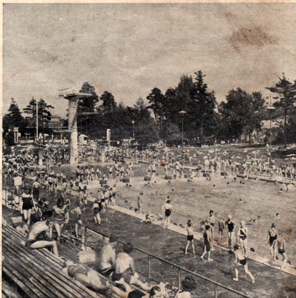
Loma- ja uimakausi on parhaimmillaan. — Kuvamme Helsingin uimastadionilta