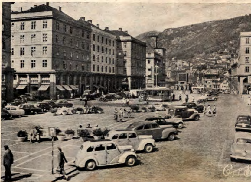
Myös Bergen kuului palomiesten matkaohjelmaan. Yllä tyypillinen katukuva kaupungista.