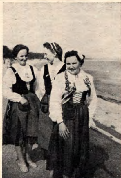
Kansallispuvut Itämeri taustanaan antoivat värikkyyttä Saltsjöbadenissa. Molemmat oikeanpuoliset työt ovat liittomme edustajia.