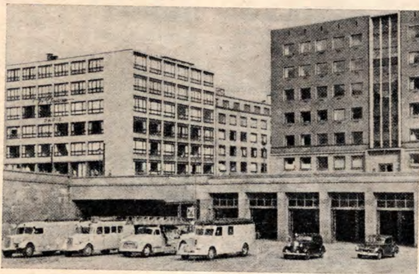
Oslon palolaitos edustaa alallaan Euroopan korkeinta tasoa. Kuvassamme pääpaloaseman autoja ryhmittyneenä autotallien edustalle.

sa öljysataman palonsuojelulaitteita. Samoin oli opintopäivien ohjelmassa käynti suuressa, v. 1853 perustetussa Christianin naulatehtaassa.