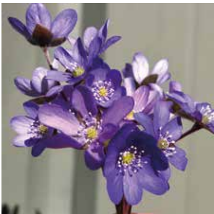
Poimithan näitä vain vähän

Sinivuokko leviää lähes täysin muurahaisten välityksellä. Sinivuokko on hidaskasvuinen ja siementaimivaiheen pääseminen