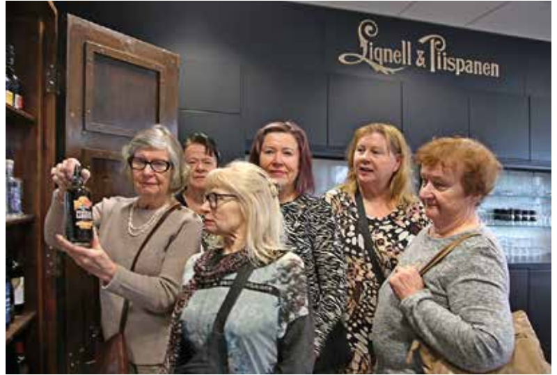
Kaapin aarteet esittelyssä