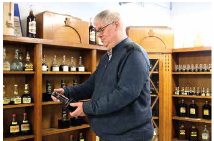
Pullomuotia vuosikymmenien ajalta