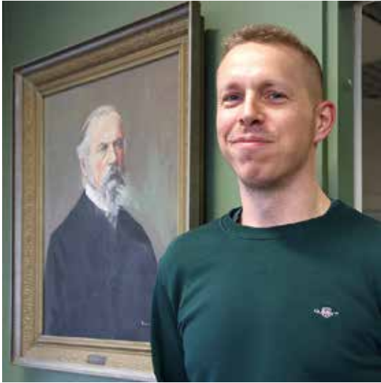
Perheyriksen 1. ja 7. sukupolvi