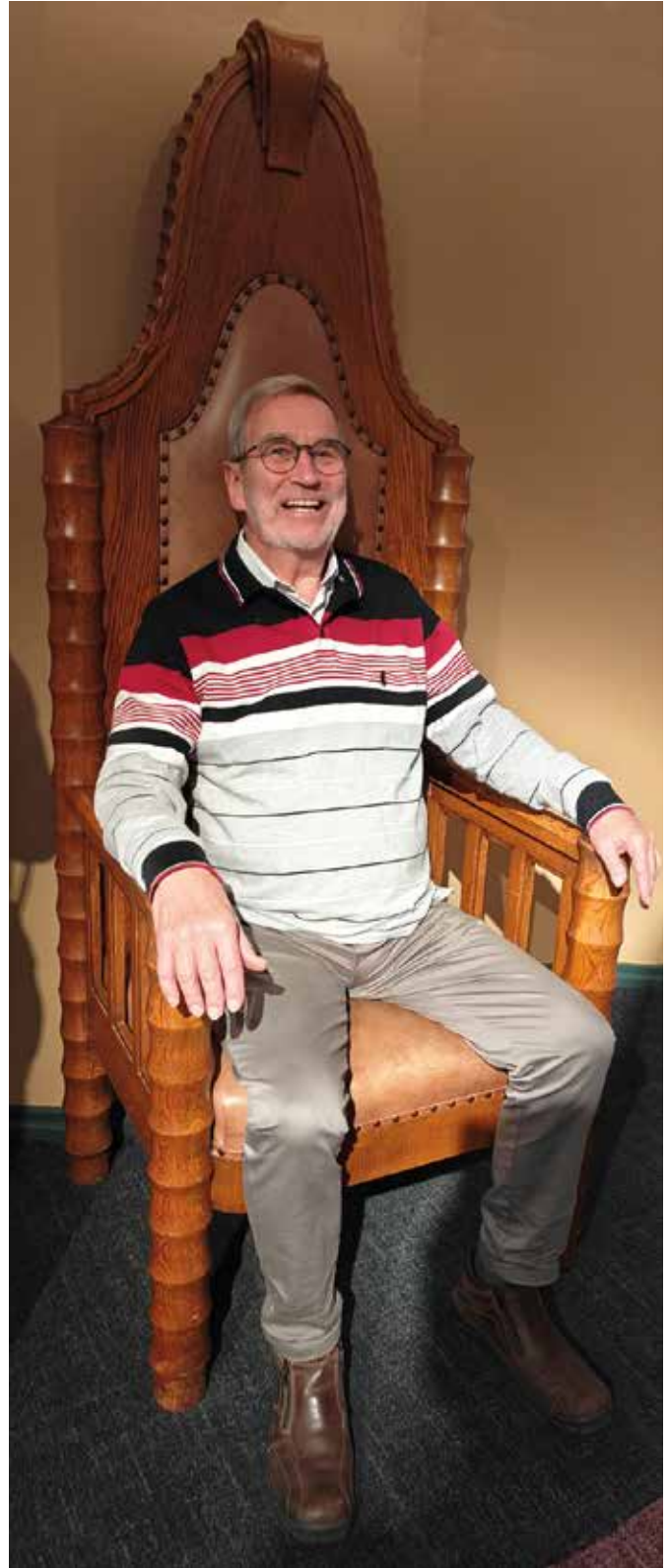
Arille tuttu paikka, kaupunginhallituksen edellisen kokoushuoneen puheenjohtajan tuoli kaupungintalolta.

Perinteisten museoiden "kannattajien" kannattanee vaikka hetkeksi nollata mielikuvansa