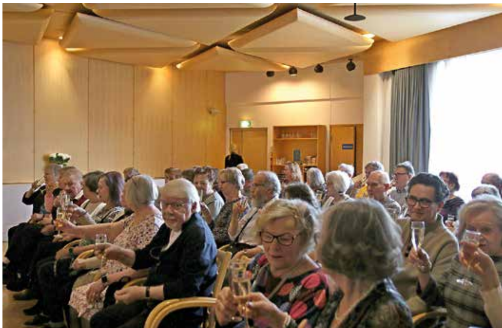
Kelon väkeä illanvietossa

Sokerina pohjalla oli Oulun yhdistyksen esitys Valehtelijoiden pupi, jonka esittivät pupin