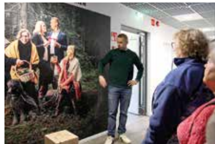
Katsottiin perheyriksen kuvaa oppaan (7. polvi) johdolla

Keskiviikkona lähdettiin heti aamiaisen jälkeen tutustumaan Petteri Bussilla Lignell& Piispasen vierailukeskukseen. Saimme myös maistella useita tehtaan tuotteita ja meillä oli myös mahdollisuus ostaa alle 8% tuotteita esittelyn jälkeen.