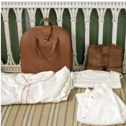
hienoja entisajan työasusteita

Jos ei ollut varannut tätä vierailua etukäteen, niin hotellissa oli tarjolla niin liikuntaluentoa kuin liikuntaa.