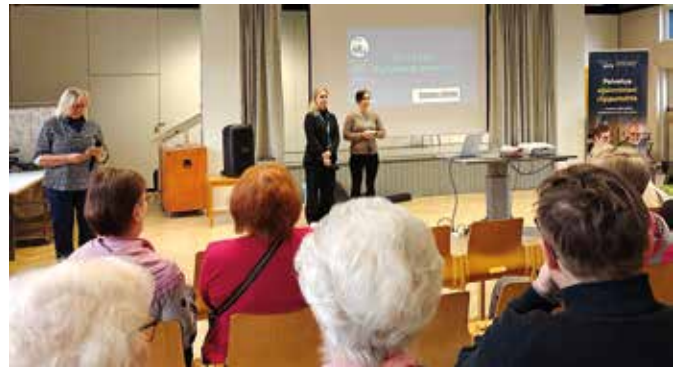
Joensuun eläkeläisyhdistysten yhteinen tapahtua "Pohjois-Karjalan hyvinvointialueen digitaaliset palvelut ja sähköinen ajanvaraus"

Joensuussa eläkeläisyhdistysten yhteisiä tapahtumia kevätkaudella on ollut 1-2 kuukaudessa, joista viimeisin 19.3.2026: "P-K:n hyvinvointialueen digitaaliset palvelut ja sähköinen ajanvaraus". Tilaisuudessa esiteltiin hyvin kattavasti palvelut, ohjeistukset, kirjautumiset, Siun sote-soveluksen asentaminen ja siihen kirjautuminen. Lopuksi oli runsaasti aikaa kysymyksiin ja vastauksiin, mutta varsinaista henkilökohtaista ohjausta ei ollut mahdollista saada. Jos tämä tilaisuus ei