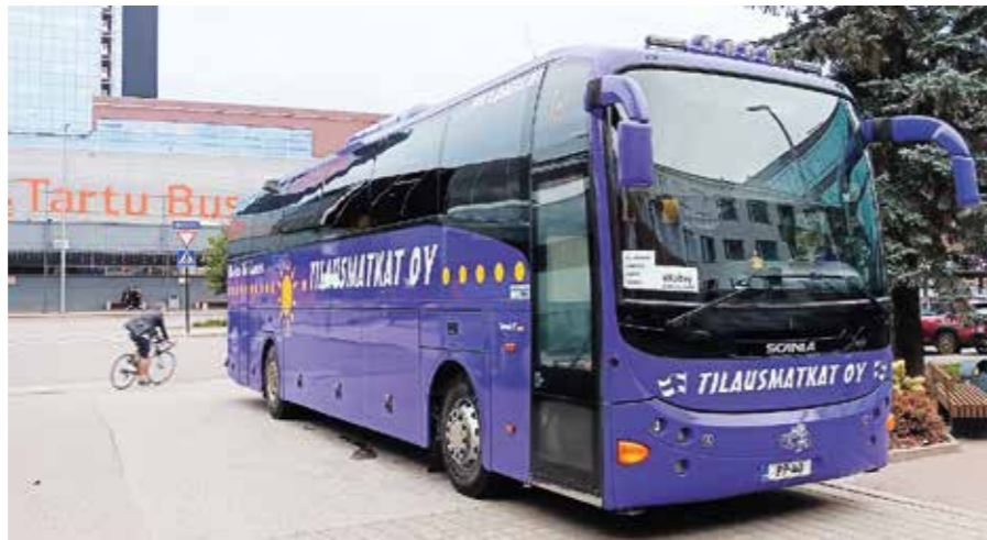
Linja-automme hotelli Tartun edessä

Päivän aikana auton mittariin kertyi noin 570 km (Kuopiosta Tarttoon).