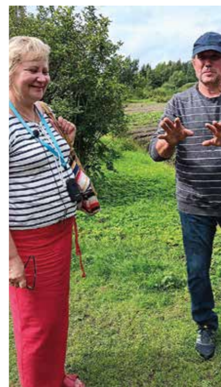
Opas ja sipulitilan isäntä

Sunnuntaina 25.8.2024 Aamiaisen jälkeen olikin aika pakata auto ja suunnata kohti Tallinnaa, josta Eckerö Linen ms Finlandia kuljetti meidät Helsinkiin. Satamasta tulimme bus-