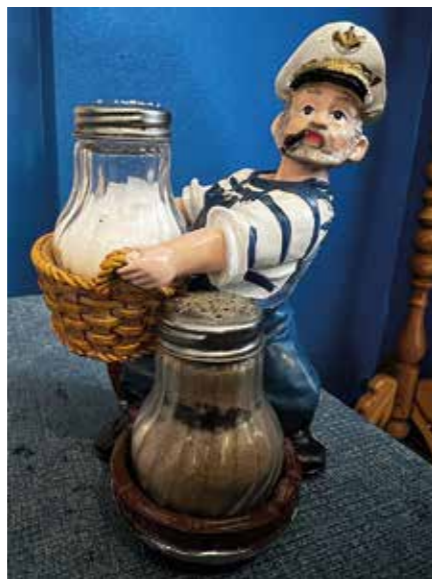
Suola-pippuriteline Kolkjan lounaspaikassa

lun jälkeen kohti Pärnuu. Ensimmäisenä pysähdyttiin Suur Munamäellä, joka on Viron korkein kohta 314 m. Täältä matka jatkui kohti Rõuge Suurjärveä, joka on Viron syvin järvi; suurin syvyys 38 m ja keskimäärin 18 metriä. Täällä oli mahdollisuus kiivetä näkötorniin ja ihastella järveä ja sen ympäristöä.