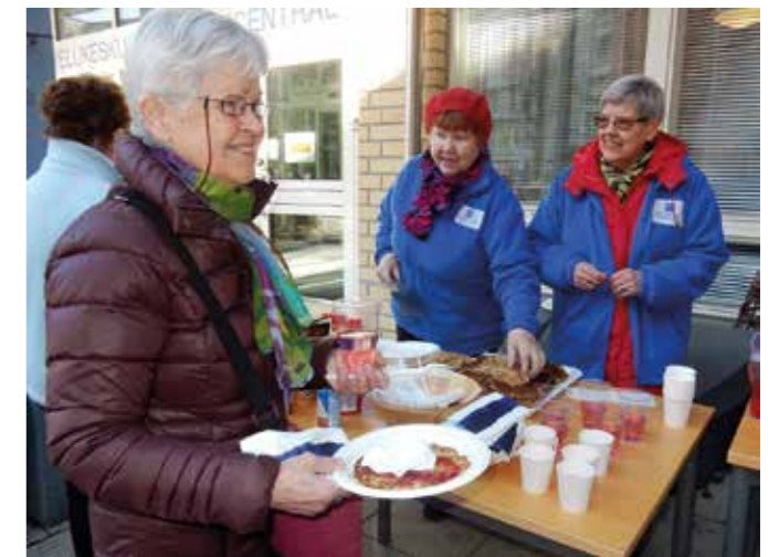
Vapaaehtoiset myyvät sisäpihalla makkaraa Kinaporin seniorimessuilla 2018.

On selvää, että heidän toimintansa kohdistuu ensisijaisesti oman jäsenistön hyvinvoinnin ylläpitoon. Koska järjestöt koostuvat ikääntyvästä aktiivisesta porukasta, on poistuma suuri. Ongelmana onkin uusien toimijoiden saaminen. Tuntuu siltä, että uusi sukupolvi on mielestään tehnyt riit-