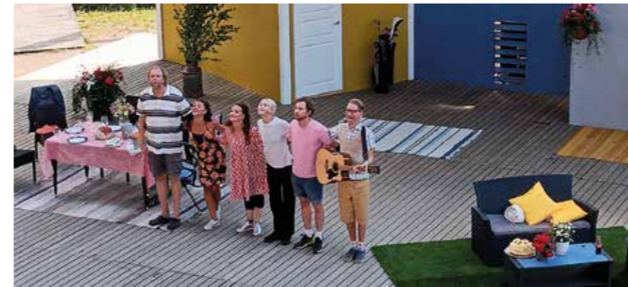
Näyttelijät vastaanottamassa runsaita aplodeja

Näytelmä oli tosi hauska ja viihdyttävä. Näyttelijät olivat taitavia. Pave Maijasen musiikki vetoaavaa. Aikataulu ei sallinut grilliherkkujen Atomi ja Vety maistamista eikä nähtävyyksiin tutustumista. Onneksi näimme pari armeijan ratsua, mutta ratsastajat olivat tyttöjen kanssa kiosilla.