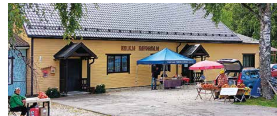
Kolkjan lounaspaikka "Kolkja Rahvamaja"