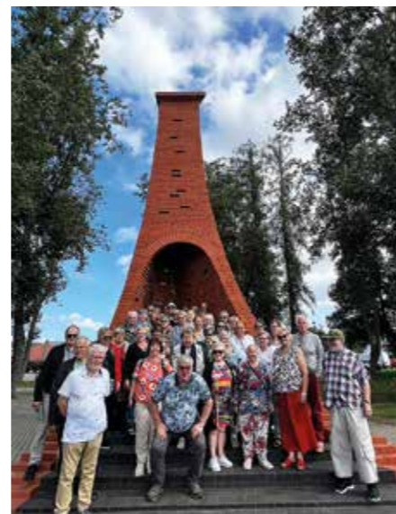
Tässä kelolaisten ryhmä ja tervanpolton muistomerkki

Täältä matka jatkui pitkin Latvian rajaa kohti Taageperen linnaa, joka nykyisin toimii ho-