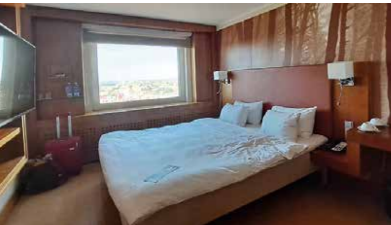
...ja tässä ikkuna, josta näkymä kuvatiin

Majoituspaikkamme osoittautui erittäin hyväksi. Huoneet olivat tilavat ja viihtyisät. Aamiainen ja lounas olivat erittäin monipuoliset ja maittavat.