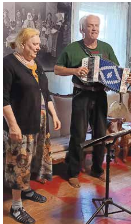
Setokielistä musiikkia, yhtyeeltä "Baba ja ka"

Katarina II antoi Vörulle kaupunkioikeudet 23.8.1784. Ilta oli vapaata ja useat olivat kuuntelemassa nuorten sinfoniaorkesterin konserttia Tamula-järven lavalla. Oli hienoa saada kuulla mm. Jean Sibeliuksen Finlandia.