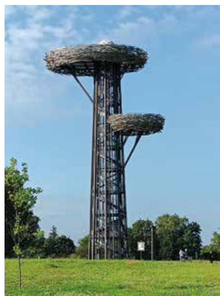
Haanjan näköalatorni; Haikaranpesä

Lauantaina 24.8.2024 matka jatkui Vörusta, lyhyen kiertoaje-