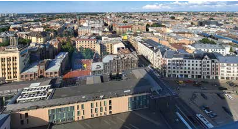
Näkymä hotellin 24 kerroksen ikkunasta...

Parin pysähdyksen jälkeen saavuimme Radisson Blu Latvija 4 tähden hotelliin. Majoituimme 20- 24 kerroksiin, josta oli huikeat näköalat koko kaupunkiin.