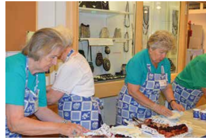
Kinaporin kahvion synttärjuhlat elokuussa 2014. Kinaporin vapaaehtoiset auttavat kakkukahvien tarjoiluissa.

Kuten jo aiemmin sanoin, eläkeläisyhdistysten toiminta keskittyy pääosin oman jäsenistönsä fyysisen ja henkisen hyvinvoinnin ylläpitoon. Perustavoite on saada ikäihmiset liikkeelle omista kodeistaan. Omin vapaaehtoisvoimin järjestetään erilaista kunnon ja mielenterveyden ylläpitävää toimintaa. Järjestöillä on liikunta-, tanssi- ja voimisteluryhmiä. Muita harrastuksia ovat mm. askartelu-, laulu-, näytelmä- sekä erilaiset opintoryhmät.