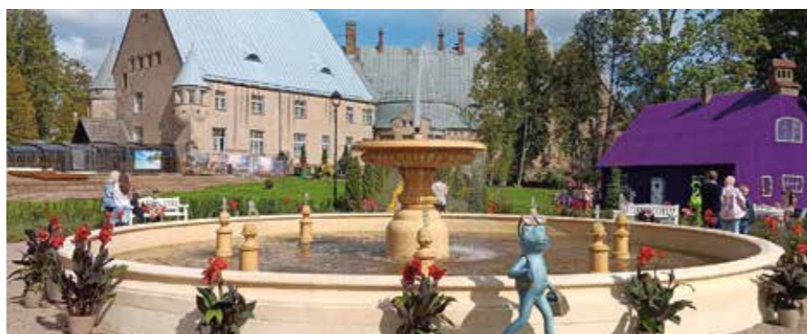
Liisa Ihmemaassa-satupuiston Suihkulähde

Matka jatkui kohti Valga (EE) / Valka (LV), Ensimmäisen tasavallan aikana, vuonna 1920 rajattiin kahden maan välillä. 1/3 osa kaupungista oli Latvian ja 2/3 osaa Viron puolella. Neuvostoaikana