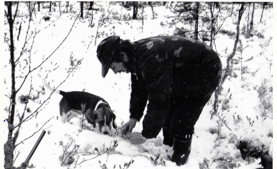
Jänisjahti on tuottanut tulosta Rastunsuolla.