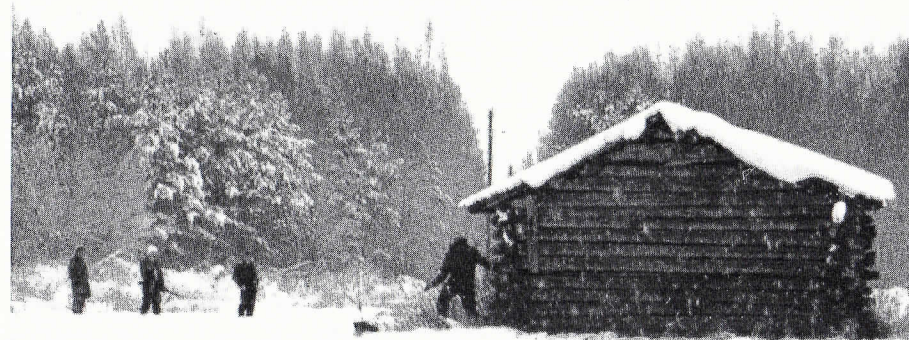
Olisiko kettu mennyt ladon alle?