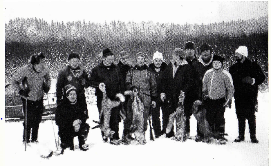
Neljän ketun päivä 15.11.1987.