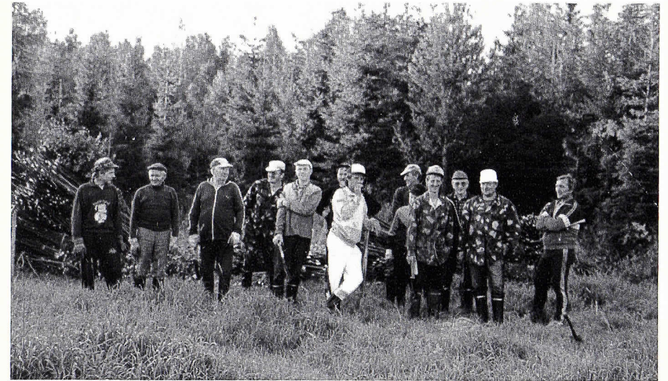
Aurasviittatalkoot Rastunsuolla.

Vuosien mittaan metsästäjä määrä on noussut tasaisesti ja riistakiintiöt ovat pysyneet kohtuullisen pieninä. Seuran periaatteena on aina ollut, että metsästetään riistaa säästään. Tämä periaate on tuottanut tulosta joten seuran alueella on vahva riistakanta.