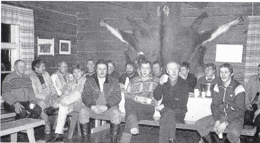
"Valojuhlat" metsästysmajalla.

Majaa on vuokrattu jonkun verran ulkopuolisille nimellivuokra vastaan.