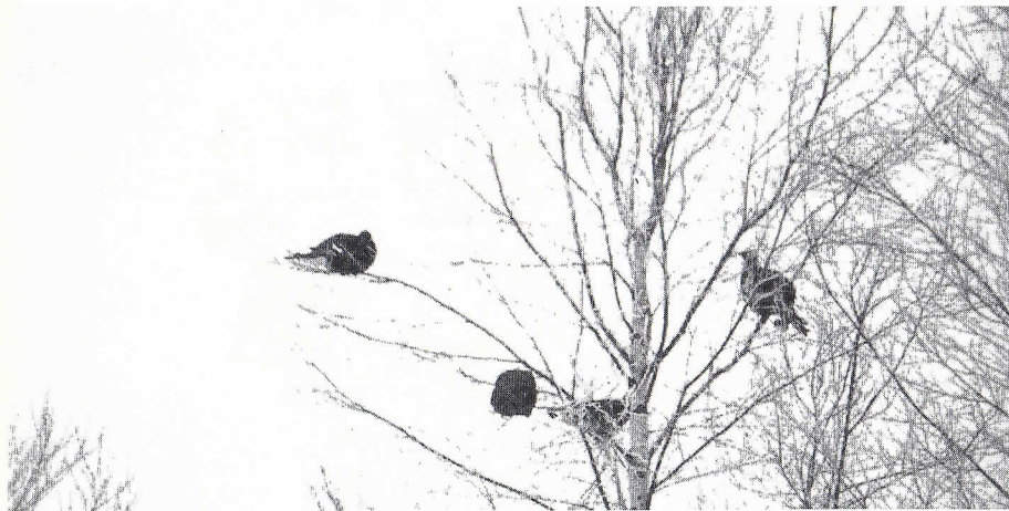
Kiintiöihin perustuvan metsästyksen ja tehokkaan riistanhoidon ansiosta Rastunsuolla näkee vielä nykyäänkin monikymmenpäisiä teeriparvia. Kuvassa teeriä Junnon pelon laidalla Rastunsuolla.