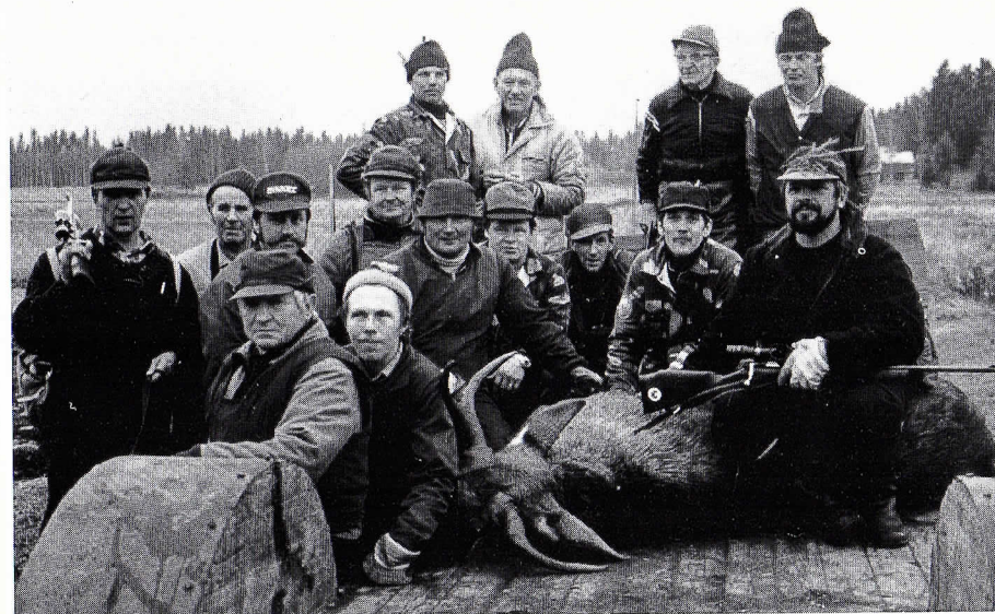
Hirvimiehiä onnistuneen jahdin jälkeen 16.10.1987.