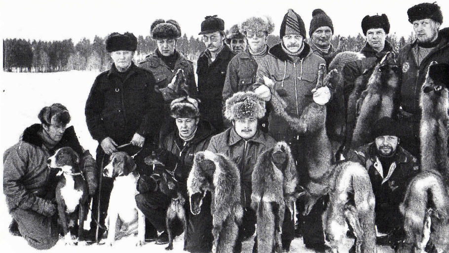
Joukko kettumiehiä jahdin jälkeen.

Seurassamme on ollut jo pitkään voimassa päätös, että pikkupetojahdissa ei seuran ulkopuolisella osallistujalla tarvitse olla vieraslupaa. Kaikki halukkaat ovat olleet tervetulleita ja usein heitä onkin ollut jahdissa mukana. Pienpetopyyntihän on parasta riistanhoitoa.