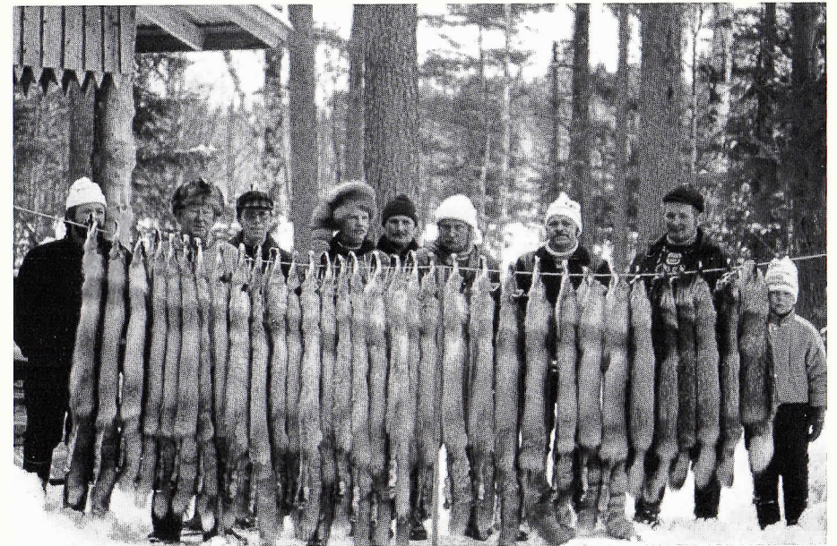
Talvien 1987 – 88 pienpetosaaalista.