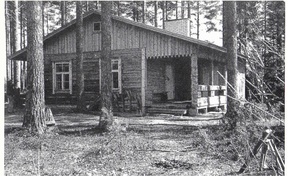
Rastunsuon Erämiesten metsästysmaja.