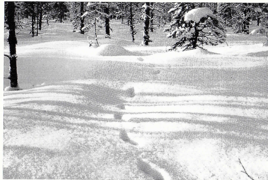
Siitähän on juossut näättä.