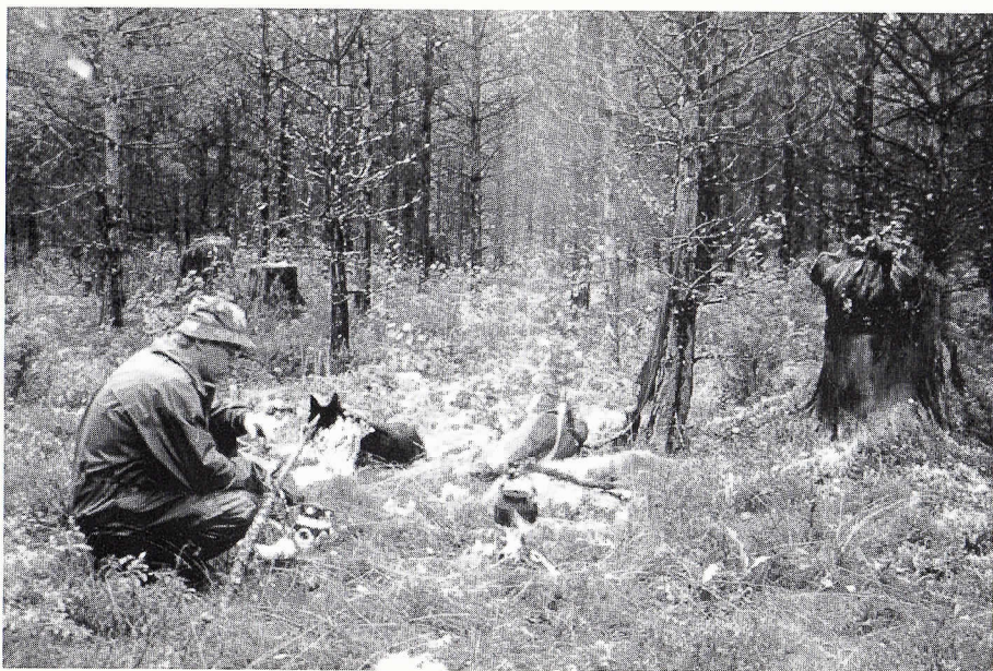
Kahvinkiehumista odotellessa.