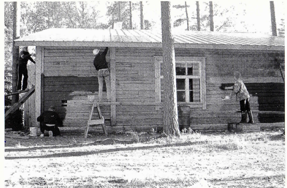
Metsästysmajan rakennustalkoot.