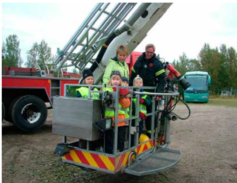
Eskarilaisten tapahtumassa Kallinkankaalla kiinnostivat varsinkin palo- ja poliisiauto.

Tärkeää yhteistyötä on tehty myös kolmannen sektorin, yhdistysten ja urheiluseurojen kanssa.