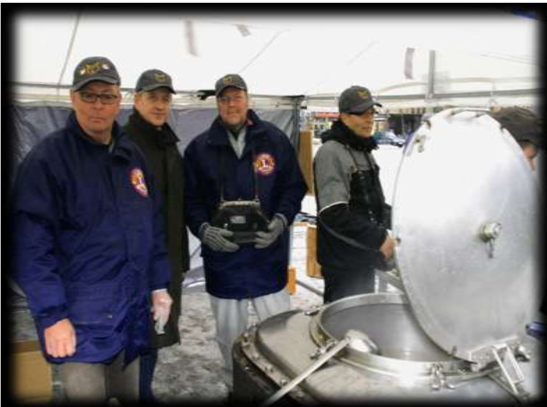
Kuva 15 Hirvisoppa