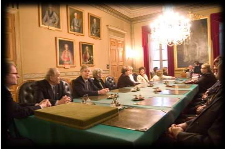
Kuva 26 Vierailu hovioikeudessa