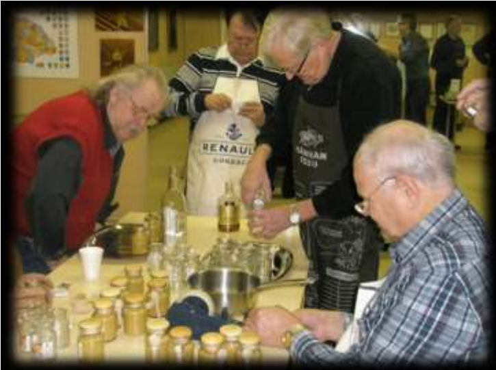
Kuva 25 Ärjäisy-sinapin valmistusta

Muita tilaisuuksia ovat olleet mm. erilaiset talkoo- ja saunaillat, sinapin valmistus, Ladyjen kanssa yhteiset kauden avaus- ja päätöstilaisuudet, lentopallo, lion Göranin leivontakurssit Polar Millsin tiloissa sekä vierailut Vaasan hovioikeudessa ja veteraanimuseossa.