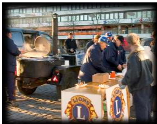
Kuva 12 Soppatykki

LC Vaasa/Meren tärkeimmät aktiviteetit ovat kautta aikain liittyneet ruokaan. Klubissa on ollut taitavia Ladyjä ja lioneita, jotka ovat olleet valmiita ottamaan vastaan ruokaan liittyviä haasteita. Haasteisiin on kyetty vastaamaan menestyksellisesti ja näin vuodesta toiseen on saatu kerättyä varoja hyväntekeväisyyteen. Soppatykki on saavuttanut suuren suosion eri tapahtumien yhteydessä tapahtuvan soppatarjoilun mahdollistajana. Asiantuntemusta tarvitaan, jotta keittoprosessi tuottaisi toivotun lopputuloksen. Maailma on kuitenkin muuttunut, eikä tiukentuneessa EU-sääntelyssä ole välttämättä kovin pitkään sijaa omaehtoiselle ruoan valmistukselle.