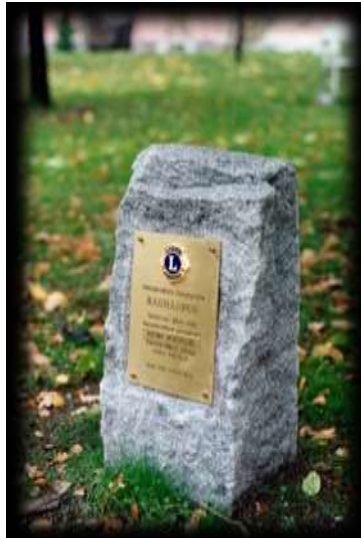
Kuva 3 Rauhanpuun istuttamisesta kertova kivi laattoineen.

Ennen varsinaista perustamisjuhlaa istutettiin Hovioikeudenpuistoon "Kay" Murakamin aloitteesta rauhanpuu. Myöhemmin, 26.10.1996 hankittiin puun viereen laatalla varustettu kivi.