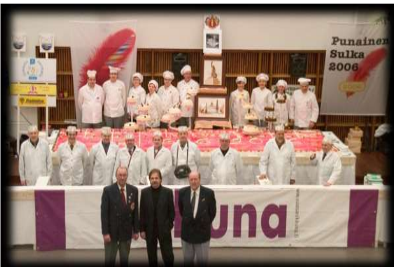
Kuva 16 Vaasan kaupungin 400-vuotiskakku