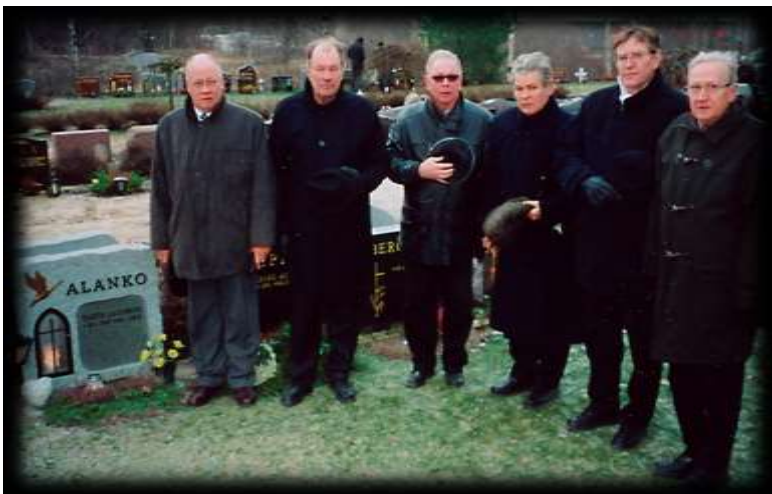
Kuva 4 Edesmenneiden lionien haudoilla

Lions-liiton ja piirin vuosikokouksiin sekä muihin lionskokouksiin on ollut säännöllistä ja runsaslukuista. Edesmenneiden lionien haudoilla vierailaan Charter Night -päivänä.