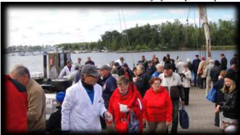
Kuva 10 Silakka-ja siikamarkkinat 2010