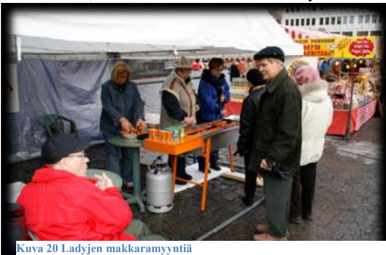
Kuva 20 Ladyjen makkaramyyntiä

Ladyt ovat olleet pyyteettömästi ja sitoutuneesti mukana kaikissa lionshankkeissa. Yhteiset tilaisuudet ovat sujuneet kauniisti ja leppoisasti. LC Vaasa/Meren Ladyt ovat toimineet erittäin aktiivisesti koko klubin olemassaolon ajan. He ovat osallistuneet merkittävästi klubin eri aktiviteetteihin, mutta sen lisäksi heillä on ollut myös omia itsenäisiä tapahtumia.