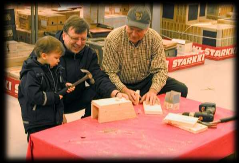
Kuva 14 Linnunpönttöjen rakentelua