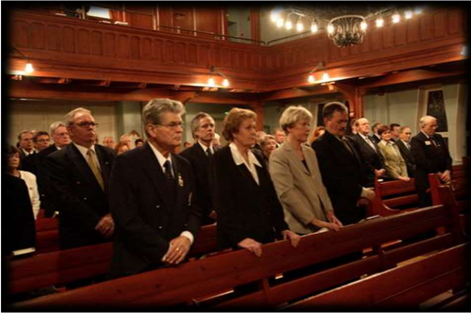
Kuva 24 Joulukirkko

Muita tilaisuuksia ovat olleet mm. erilaiset talkoo- ja saunaillat, sinapin valmistus, Ladyjen kanssa yhteiset kauden avaus- ja päätöstilaisuudet, lentopallo, lion Göranin leivontakurssit Polar Millsin tiloissa sekä vierailut Vaasan hovioikeudessa ja veteraanimuseossa.