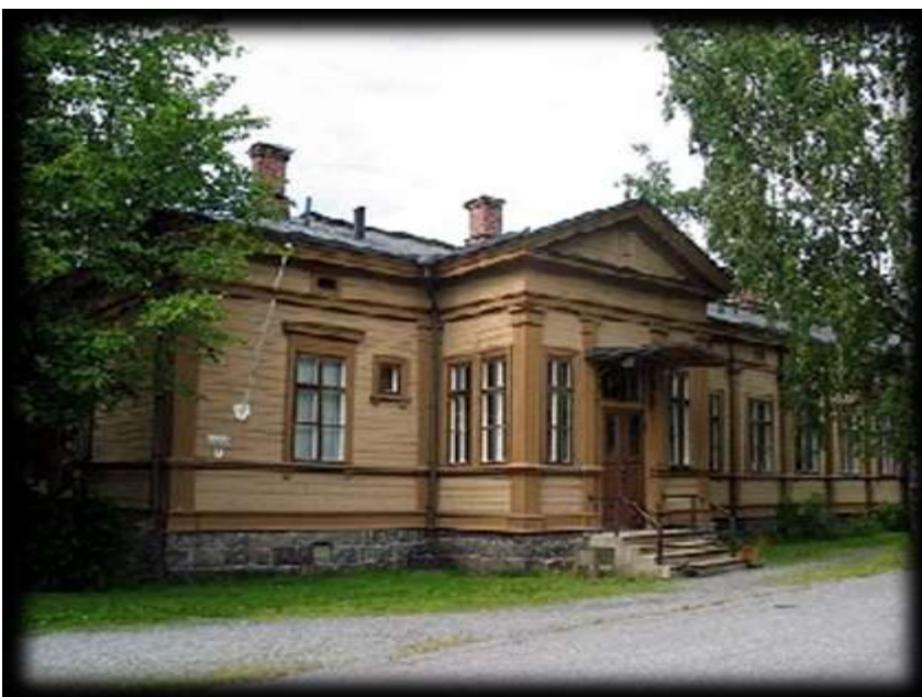
Kuva 7 Vaasan Upseerikerho

Suurin osa LC Vaasa/Meren kokoontumisista on tapahtunut Vaasan Upseerikerholla. Sekä hallituksen- että kuukausikokoukset on pidetty siellä. Vaasan kaupunki on kuitenkin luopunut tilasta ja viime vuosina olemme joutuneet evakkoon. Ongelma on myös menneiden vuosien kirjallisen materiaalin säilytys. Ilman vakiopaikkaa on vaikea löytää tilaa aineistolle kirjalliselle materiaalille, jota on kertynyt hyllymetreittäin. Mapit pitävät sisällään kokouskutsuja, -pöytäkirjoja, saapuneita kirjeitä ja muuta materiaalia. Erityisesti leikekirjat olisi tärkeä voida säilyttää huolellisesti ja tarkoituksenmukaisessa paikassa. Tällä hetkellä hallituksen kokouspaikkana on Tropiclandia ja kuukausikokoukset ovat Svenska Klubbenilla. Jos kokouspaikka onkin haastava, niin tyydyttävä varastopaikka on kuitenkin löytynyt.