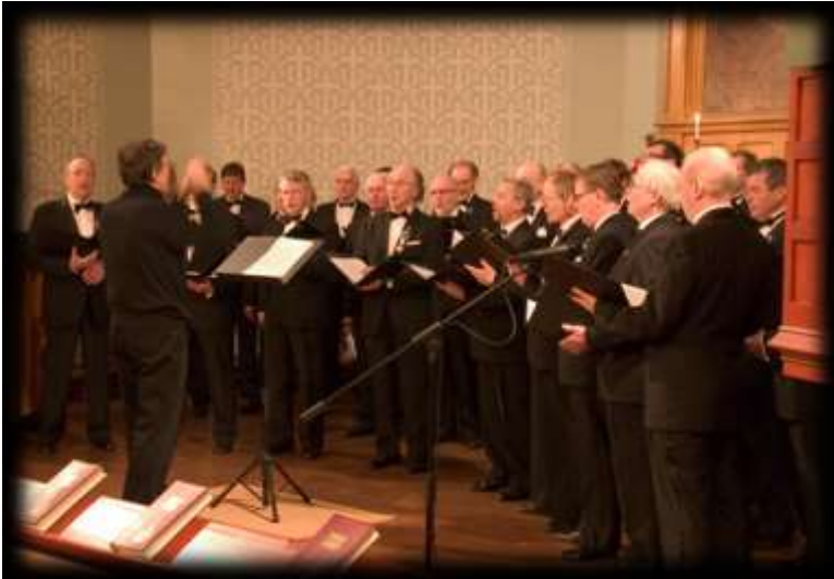
Kuva 17 Isänpäiväkonsertti