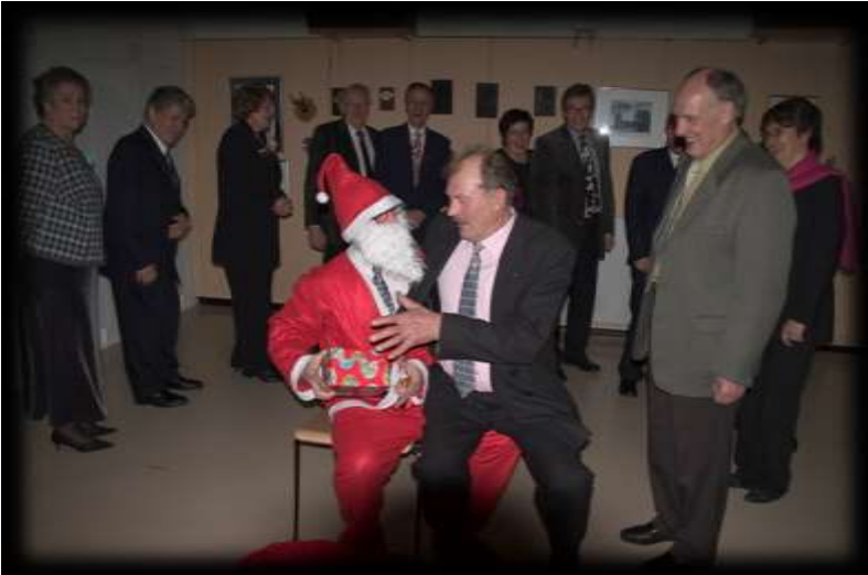
Kuva 22 pikkujoulu