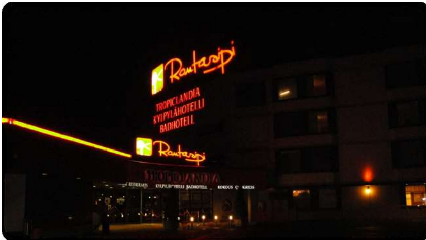
Kuva 8 Tropiandia eli Rantasipi