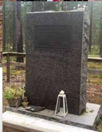
Vuonna 2014 tapahtuneen lento-onnettomuuden muistomerkki.