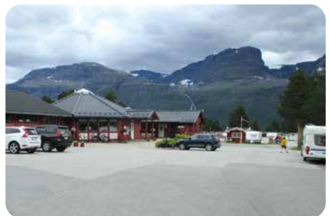
Skibotnin Oldereiv Campingin vastaanotto.