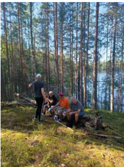
Hellesäässä oli pakko välillä pysähtyä.