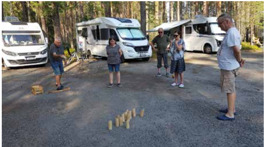
Patikointien välissä pelattiin pihapelejä ja vaihdettiin kuulumisia.