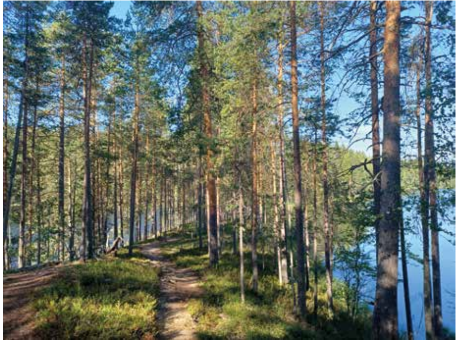
Petkeljärvellä on veden ympäröimää harjumaista kangasmaastoa.

Olipa kaunis esitys. Retkiluonto, mukava porukka ja kelit kohdallaan. Olisiko parempaa voinut toivoa!