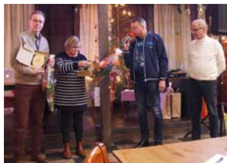
Kellojen luovutus, vuosikokous