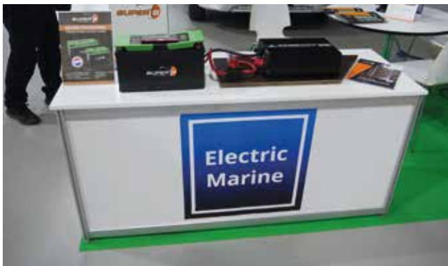
Litiumakut ovat tulossa myös matkailuautoihin. Niiden etuna on pienempi koko ja keveys. Haittana on vielä korkea hinta.