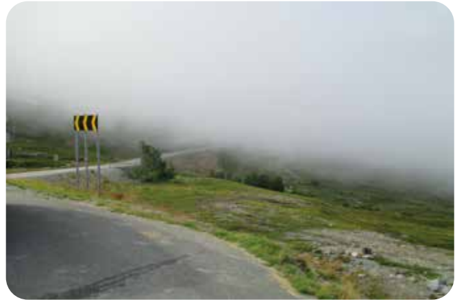
Välillä jouduttiin ajamaan konkreettisesti pilvessä.

Koska Harrinniva on nähty aikaisemmin, päädyimme Muonionjoen rannalle uuteen paikkaan nimeltä Lapin Lomamökkit & Camping . Hinta oli 25 € vuorokausi. Ihan kiva paikka. Tosin naisille ja miehille oli vain yksi oma suihku saunan yhteydessä sekä yksi yhteinen WC. Alueella oli grilliravintola, joka näytti olevan paikallisten suosiossa.