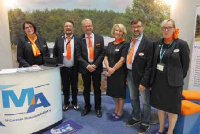
MAry:n hallituksen uudet edustusasut olivat ensimmäistä kertaa käytössä. Tyylikkyudessa ne erottuivat edukseen.