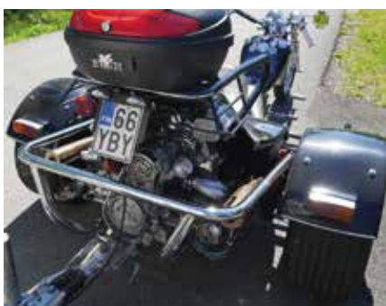
Koneena on VW Kupla 1302:n 1600 cc.