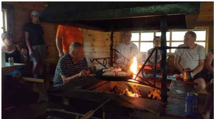
Grillikodassa paistettiin makkaroita ja lettuja sekä seurusteltiin.