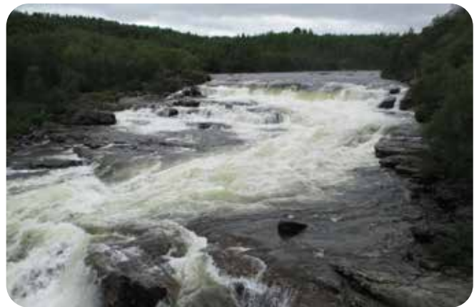
Neidenin koski Näätamönjoessa E6-tien varressa.