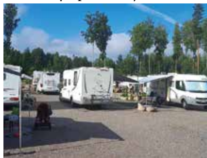
VuoriCaravaniin oli saapunut 17 autokuntaa viettämään venetsialaisia.

paamuotoista toimintaa harrastettiin kunkin maun mukaan. Seuraavan tapaamisen aika ja paikka laitettiin hautumaan.