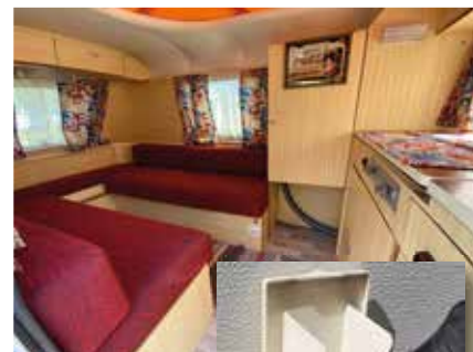
Sisätilat ovat yllättävän väljät. Ulkoseinässä on normaali CEE-virtapistoke.

Leiriydyttäessä ulko-oven päälle viritetään kookas pressukatos sade- ja aurinkosuojaksi.