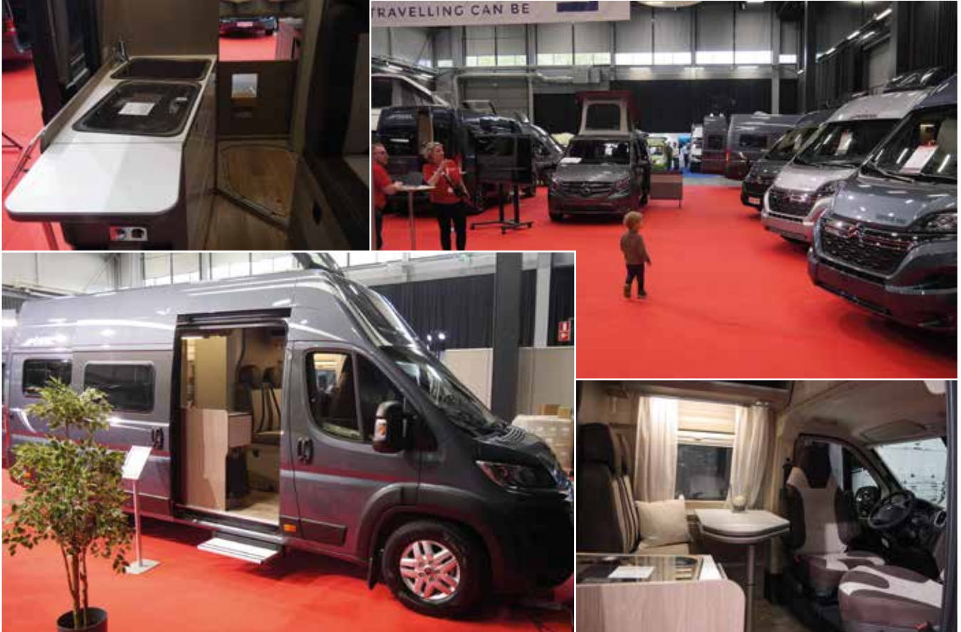
Retkeilyautojen suosion jatkuessa erilaiset sisustusratkaisut ovat lisääntyneet. Vuoden -22 Pössl RC Revolution -mallista löytyi monia pitkälle vietyjä yksityiskohtia, joita retkeilyauton käyttäjät varmasti arvostavat. Esittelymallin hinta oli 75.320 €.