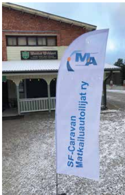
Yhdistyksen uudet beach flagit olivat ensi kertaa käytössä.

Suuret kiitokset Wanhojen Wehkeiden henkilökunnalle, Matkailuautoilijoiden hallitukselle ja heidän puolisoilleen onnistuneista järjestelyistä!