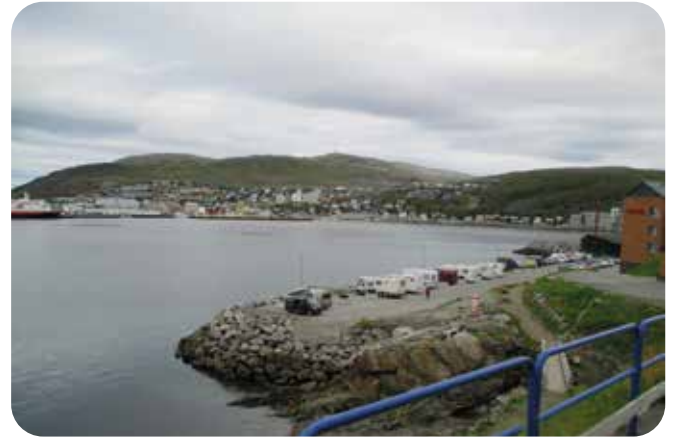
Hammerfestin matkaparkki, jonne emme jääneet.

Matka jatkui tietä E6 Skibotnin suuntaan. Tällä osuudella oli hienot maisemat jylhine kalliivuorineen ja monta tunnelia. Levähdyspaikalla jututimme suomalaisia motoristeja ja autoilijoita. Eräs nainen oli uimassa käydessään seurannut neljän delfiinin hyppeä, eli kaikkea voi nähdä!