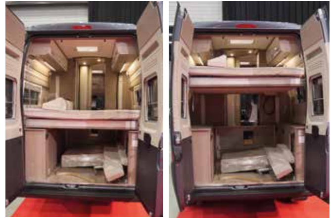
Pösslissä takasänky liikkuu sähköllä halutulle korkeudelle. Tämä mahdollistaa tarvittaessa korkeampienkin esineiden kuljetuksen tavaratilassa sänkyä purkamatta.