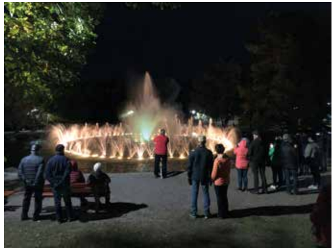
Perinteiset vesiuikesitykset keräsivät iltaisin ison yleisöjoukon Pikku-Vesijärven rantaan ihastelemaan näytöstä.