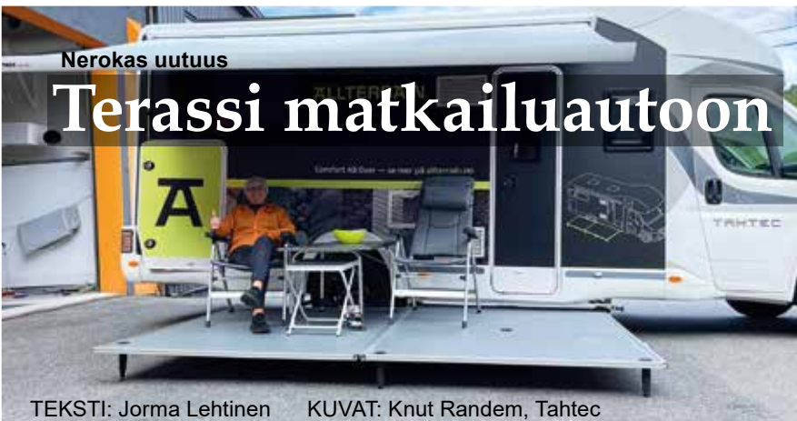
TEKSTI: Jorma Lehtinen

Lahden Caravan-messuille ei ehtinyt vielä uusi norjalainen keksintö, joka mahdollistaa helposti mukana kuljettavan "terassin" matkailuautoon.