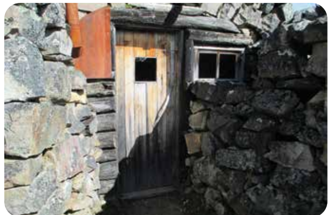
Saksalaisten entisöity korsu Järämän linnoituksilla.