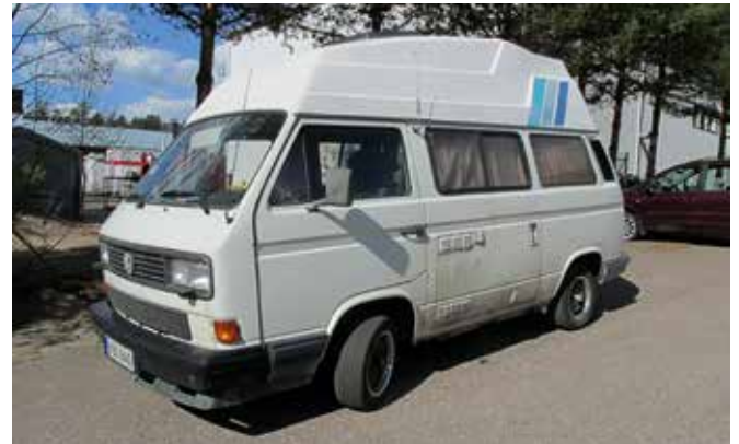
Torikoiden nykyinen matkailuauto VW-Grand California sekä aikoinaan itse rakennettu VW LT ja Caravelle -retkeilyauto.