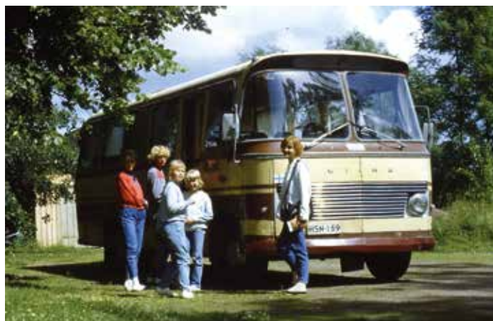
Torikoiden ensimmäinen auto oli Wiima-merkinen Bedfordin alustalle tehty linja-auto, josta oli tehty matkailuauto.

Ensimmäisen oman autoni rakensin itse Volkswagen LT -kuorma-autosta. Tällä autolla matkustimme koko perheen kanssa 1985 Tanskaan, jossa tärkein kohde oli Legoland. Seuraavina kesinä vanhempi tyttäreni ei enää halunnut matkustaa kanssamme, 12