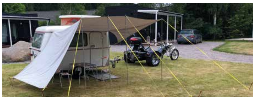
Leiriydyttäessä ulko-oven päälle viritetään kookas pressukatos.