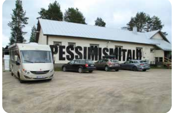
Pessimismitalo Puolangalla olikin auki!

Pykeijan Bistrossa ruokaillessa meitä palveli suomalainen tyttö, jolta kyseltiin paikallisia asioita. Ilmeni, että olimme saapuneet Pykeijalle juuri, kun siellä vietettiin Pykeijan festivaaleja. Se selvensi sitä, että kaikki saunavuorot oli varattu.