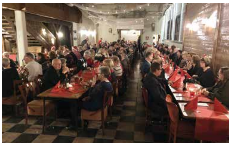
Varsinainen pikkujoulujuhla vietettiin alueen suuressa juhlatilassa.

Perjantai-iltana oli vieraiden käytössä sekä korsusauna että pienoiskylpylän sauna. Molemmat olivat kovassa käytössä ja tunnelma niissä oli tiivis. Joulupolku jouluaiheisine kysymyksineen oli kiertävissä jo perjantaina aamusta alkaen. Myöhemmin illalla oli vuorossa avajaiset ja sen jälkeen karaoketanssit.