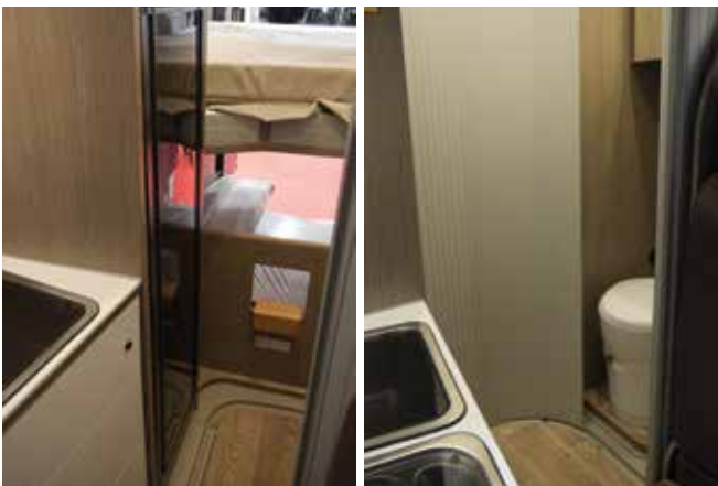
Autoon on saatu mahtumaan korkea kompressorijääkaappi. Suihku syntyy keskelle käytävää pyörivän rulo-seinän avulla. Näytti jopa toimivalta.