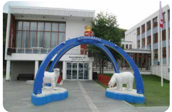
Hammerfestin kaupungintalon ”jäähuhuportti”.