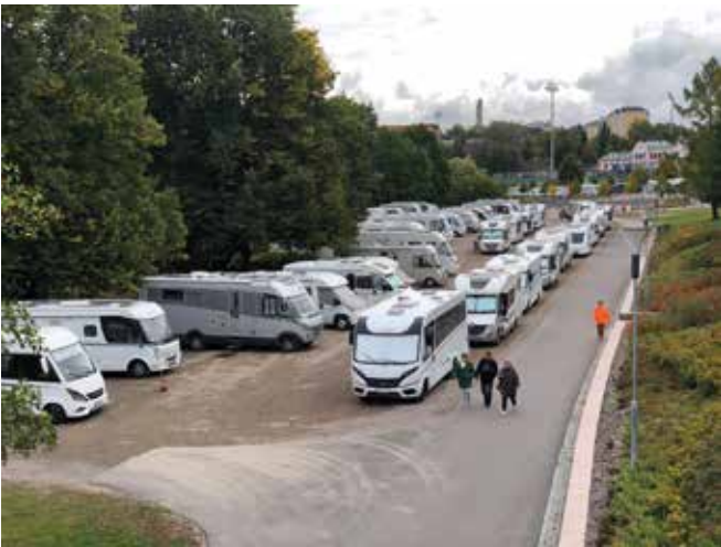
Tilapäisiä caravan-alueita oli jälleen ympäri kaupunkia. Järjestelyistä vastasi luotettavasti jälleen SF-Caravan Lahden seutu.