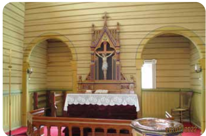
Neidenin puukirkon kaunis alttaritaulu.