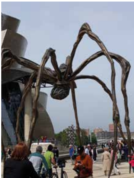
Guggenheim-museo Bilbao, Espanja.

Syksyllä erehdyimme menemään matkailuautonäyttelyyn Ideaparkiin, ja keväinen päätös kumoutui ja seurauksena hankimme VW Grand California-matkailuauton.