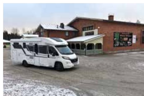
Pikkujoulut, Wanhat Wehkeet