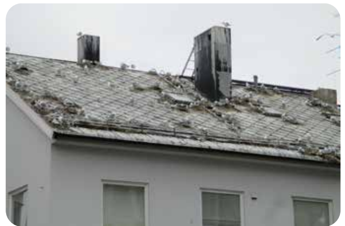
Lokit pesineen olivat vallanneet kokonaisen kerrostalon.