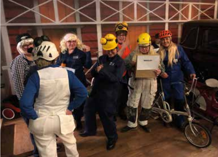
Yhdistyksen "blondit" valmistautumassa pikkujoulunäytelmään.