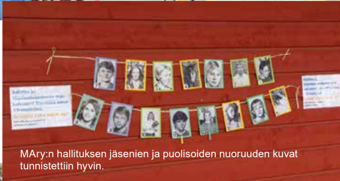
MÄry:n hallituksen jäsenien ja puolisoitten nuoruuden kuvat tunnistettiin hyvin.