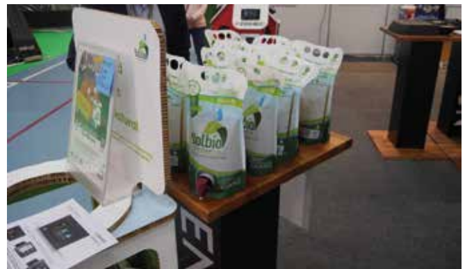
Solbio Original -käymälänesteen väitettiin olevan ekologinen ja yhtä tehokas kuin perinteinen sininen. Testataan!