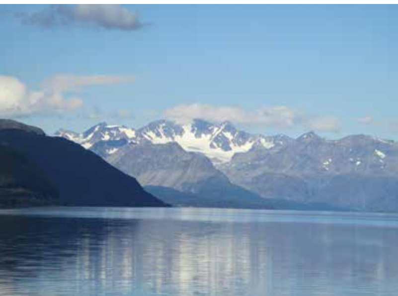
Maisemat ovat Pohjois-Norjassa huippuluokkaa.