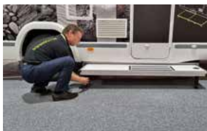
Osittain ulosvedettynä terassi toimii tavallista leveämpänä askelmana.