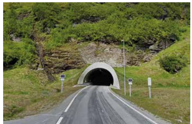
Maantietunneleita on paljon.