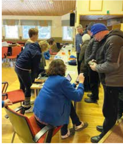
Mary-shopissa Rairannan päärakennuksessa oli ajoittain ruuhkaa.