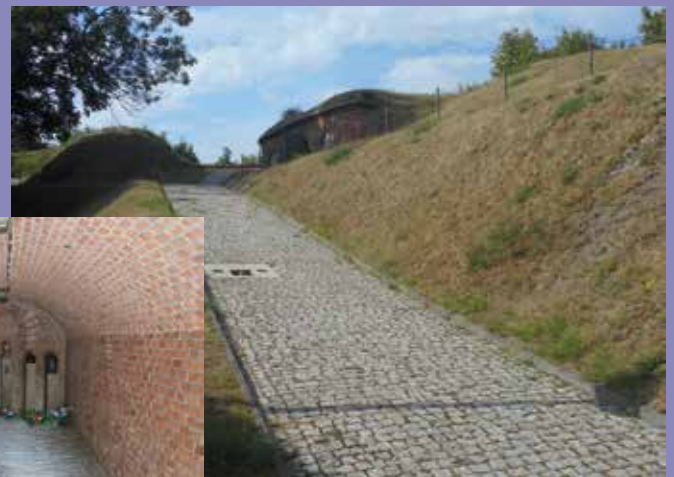
Kaasukammiossa käytettiin hiilimonoksidia ja kokeiltiin myös Zyklon B -kaasua.

Camping Tramp, jossa oli ihan hyvää ruokaa tarjoileva ravintola, oli sijaintinsa lisäksi muutoinkin viihtyisä paikka. Vain liikenteen melu vähän häiritsee. Vieressä oli kolmen suuren uima-altaan maauimala ja uimaan pääsi n. kolmen euron hintaisella päivälipulla. Kun lämpötila oli jälleen +30 °C, oli mukava käydä uimassa.