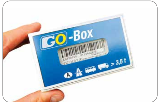
Itävallan puolella tiemaksut maksetaan GO-Boxilla.

Grossglockner on Itävallan korkein vuori, huippu on 3 798 m korkuinen. Maisematie nousee korkeimmillaan 2 571 m korkeuteen. Kuten olettaa saattaa, jyrkkiä nousuja ja tiukkoja mutkia piisaa, kunnes ylhäällä ollaan. Ja alaspäin tullessa sama toisinpäin. Maisemia on turha yrittää sanoin kuvailla, ne pitää kokea!