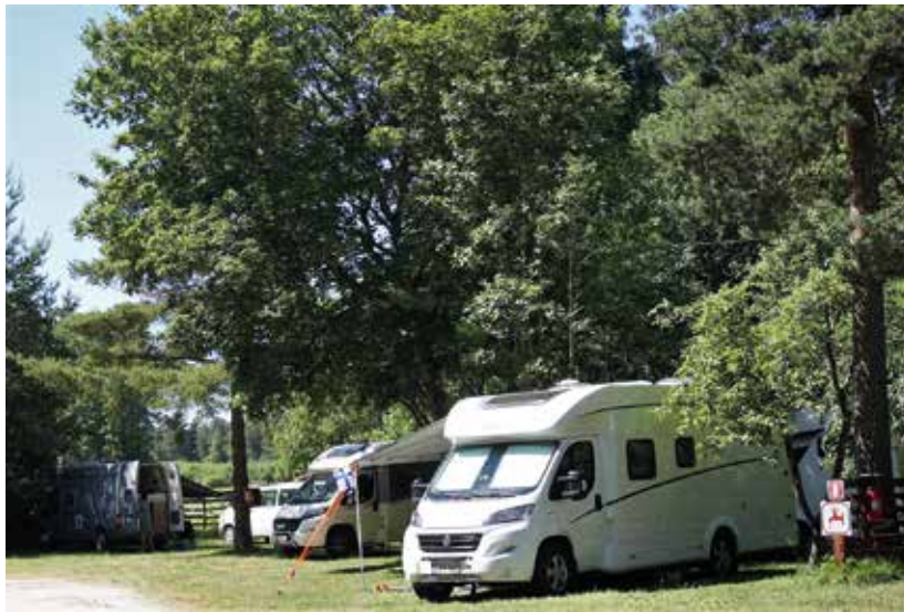
Pikseken auto- ja vaunupaikat sijaitsevat viihtyisästi puiden ja pensaiden varjossa.

- Olemme ehkä vuoden 2013 tasolla. Saksalaiset ja hollantilaiset ryhmät puuttuvat lähes täysin. Joitakin yksittäisiä autoja vaunukuntia käy, mutta ei suurempia ryhmiä. Ukrainan tilanne pelottaa keski-eurooppalaisia.