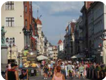
Torunissa oli vierailulla muitakin turisteja.

Matkamme jatkui kohti Torun'ia, jossa Camping Tramp sijaitsee Veiksel-joen toisella rannalla, vastapäätä Torunin keskiaikaista vanhaa kaupunkia, joka kuuluu Unescon maailmanperintöluetteloon. Todella käymisen arvoinen paikka, jossa helteisenä päivänä kiertelimme suuressa turistimassassa.