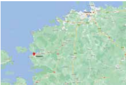
Tallinnasta Haapsaluun on noin puolentoista tunnin ajomatka.

Lisäksi hän Turun kaupungin palveluksessa ollessaan auttoi kaupunkia luomaan kontakteja Viroon ja osallistui Suomen ja Viron Kaupunkiliittojen alkuvaiheen yhteistyöhön.