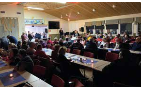
Karaokeillassa riitti laulajia yöhön asti..