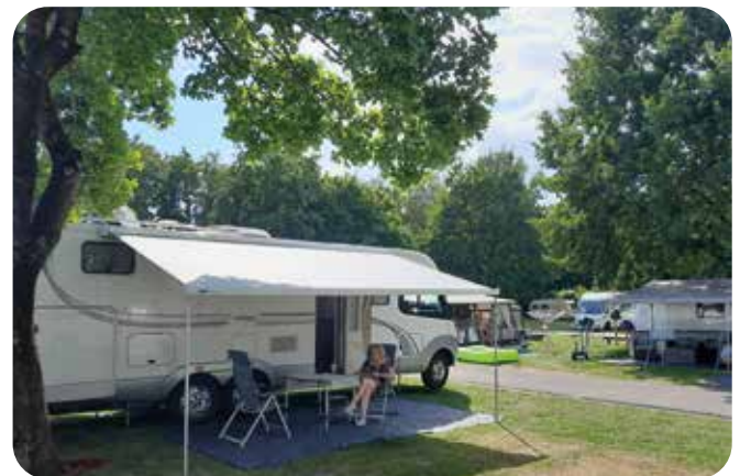
Camping Linz oli siisti ja mukava paikka. Moottoritien melu kuuluu.