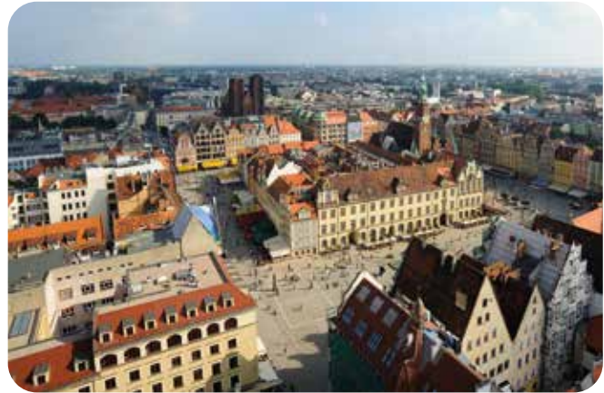
Wroclawissa on hieno vanha kaupunki.

Praha on yksi Euroopan hienoimpia kaupunkeja eikä siihen kyllästy, vaikka olemme siellä aiemminkin käyneet. Kiertoajelulla ja muutoin kaupungissa kierrellen vietimme yhden aurinkoisen päivän. Turisteja oli ruuhkaksi asti lähes joka paikassa. Yhden päivän ja kaksi yötä kulutimme Prahassa ja sitten matka jatkui Ceske Budejovice'a kohti. Liikenne sujui hyvin erinomaisia, rengasmelun kannalta todella hiljaisiksi päällystettyjä moottoriteitä pitkin.