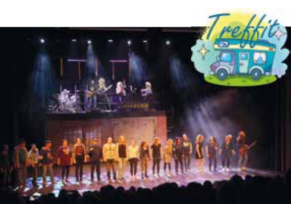
Vuonna -85 oli hieno teatterielämys.