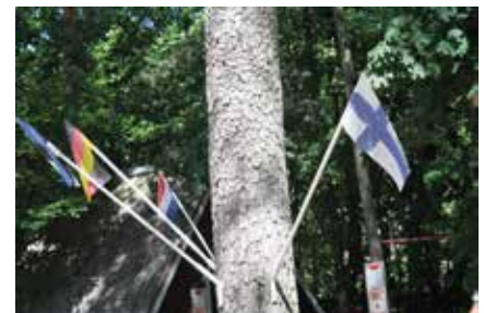
Lippurivistö kertoo, mistä maasta paikalla olevat matkailijat ovat kotoisin.

- Jatkan, jos terveyttä riittää. Ikää alkaa olla sen verran, ettei tässä enää suuria suunnitella.