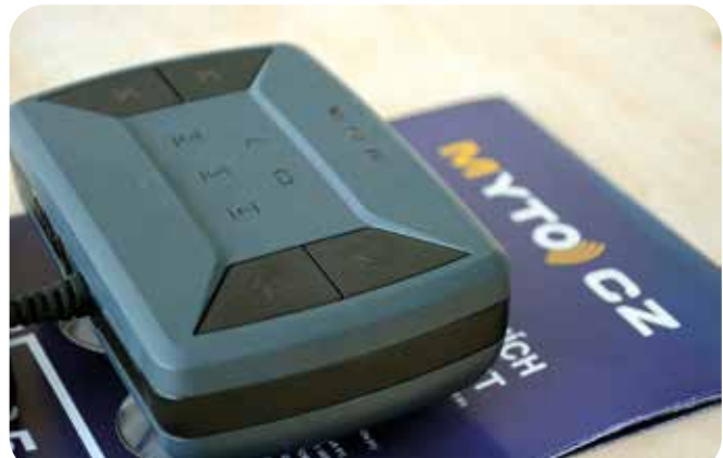
Tsekissä käytettävä MYTO-tiemaksulaite kiinnitetään tuulilasiin.