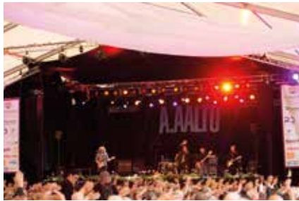
Esiintymislavalle on hyvä näkyvyys.