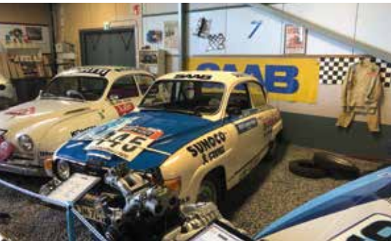
Simo Lampisen ralli-Saab automuseossa.