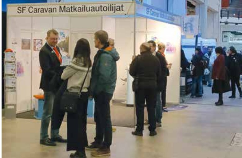
MARY:n messuosastolla riitti kävijöitä tasaiseen tahtiin.

Tapahtumassa oli mukana suurimpia matkailuauto- ja vaunumerkkeitä, jotka toivat esille messuille paljon uusia malleja. Matkailuajoneuvoissa oli valinnan varaa. Erilaisia malleja