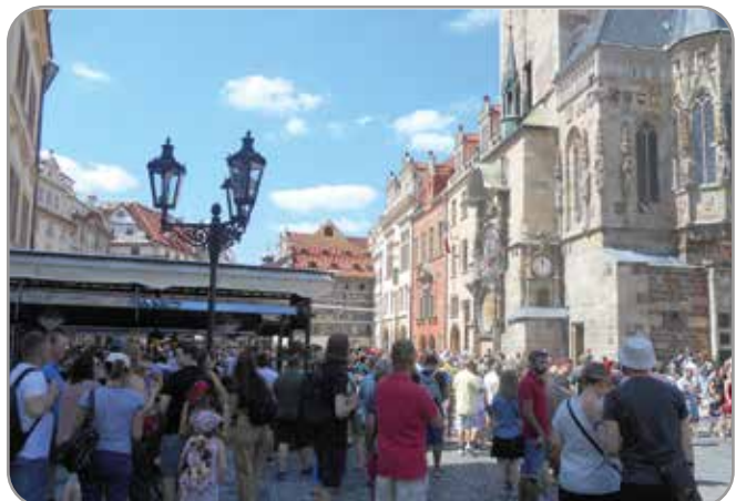
Prahassa ei tarvinnut loma-aikaan yksin katsoa nähtävyyksiä.