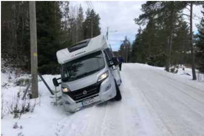
Vahinko ei tule kello kaulassa... Päätoimittajan auto syväparkis-sa. Vaiheista tarkemmin seuraavassa lehdessä.