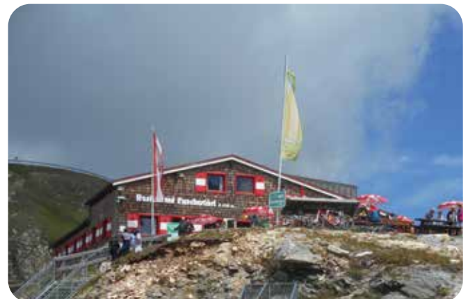
Sananmukaisesti ”korkeatasoinen” ravintola lähellä huippua.