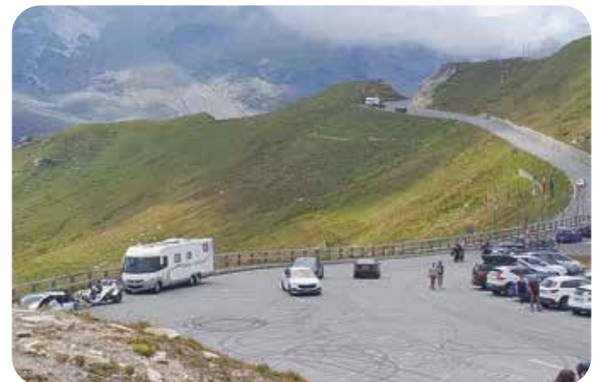
Grossglockner'n in alppitietä sanotaan Itävallan parhaimmaksi nähtävyydeksi. Se on pituudeltaan 47,8 km.