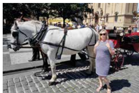
Parasta kyytiä Prahassa