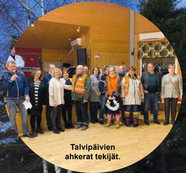
Talvipäivien ahkerat tekijät.

SF-Caravan Matkailuautoilijoiden perinteiset talvipäivät järjestettiin tänä vuonna SFC Vakka-Suomen Rairannassa Uudessakaupungissa. Mukana oli tällä kerralla 68 yksikköä, joista kertyi osallistujia noin 140 henkeä. Lapsia oli mukana neljä. Talvipäivät saatiin järjestää vielä täysin talvisissa olosuhteissa. Pakkasta oli varsinkin öisin yli -10° C, mutta päivällä nautittiin muutaman asteen pikkupakkasesta. Erityisesti lauantain oheishjelmat teatterissa ja automuseossa saivat kiitosta.