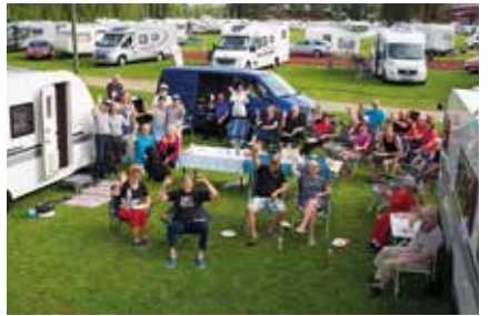
Kävijöillä on aidosti hauskaa!