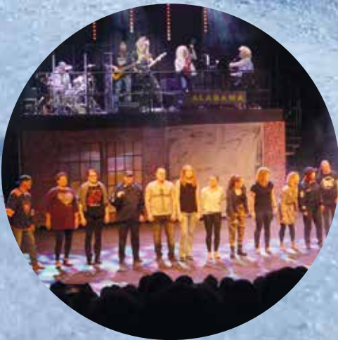
Vuonna -85 Uudenkaupungin teatteri