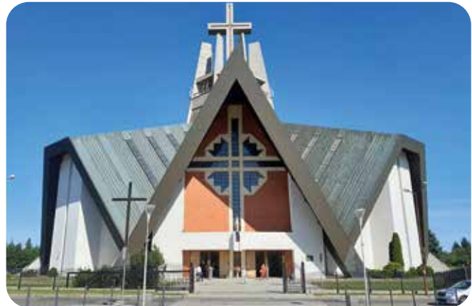
Modernia kirkkoarkkitehtuuria Puolan Swidnicassa.