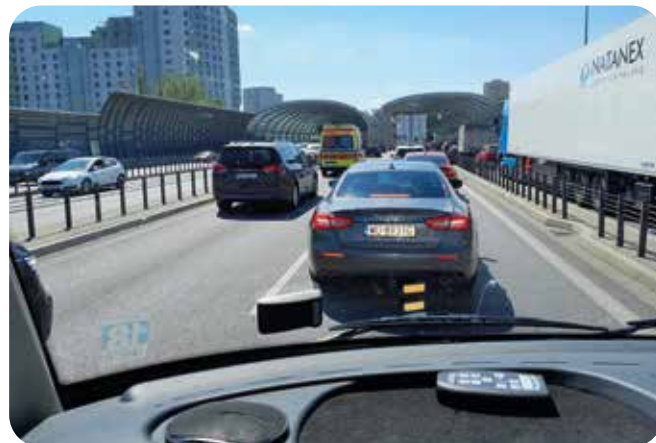
Maserati tien tukkona moottoritieellä Varsovaa ohitettaessa.

Uudet moottoritiet ovat hyviä ja joutuisia ajaa, joskin melko yksitoikkoisia. Varsova ohitettiin sujuvasti emmekä tällä kertaa poikenneet siellä. Helle heloitti ja auton mittari näytti parhaimmillaan +37 °C ulkolämpöä. Samaa kertoivat matkan varrella olleet opastintaulut ja varmimpana vakuutena tienvarressa konepellit pystyssä olevat autot sekä automme jääkaappi, joka alkoi antamaan periksi kuten helteessä ennenkin. Illaksi ehdimme Wrocławiin, jossa majoituimme ennestään tuttuun Camping Stadion Olimpijski'in, joka nimensäkin perusteella sijaitsee kaupungin suuren urheilupuiston ja stadionin vieressä.