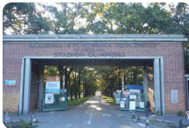
Camping Stadion Olimpijski'n hieno sisäänkäyntiportti.