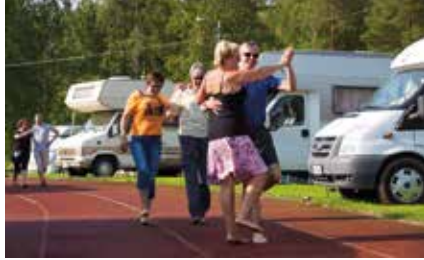
Tanssia voi vaikka urheilukentällä!