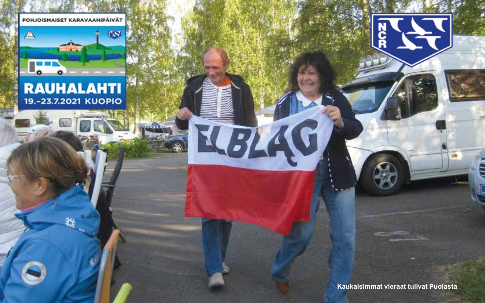
Kaukaisimmat vieraat tulivat Puolasta