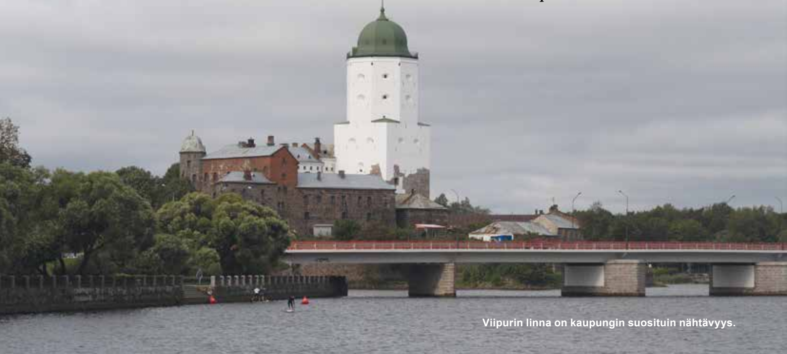
Viipurin linna on kaupungin suosituin nähtävyys.

Kuinka te uskallatte? Ennen koronarajoitusten voimaan astumista ajoimme Baltiaan aina Venäjän kautta. Jokaisella matkalla saimme vakuuttaa kanssakaravaanareille, että matkailu itänaapurissa on yhtä turvallista kuin lähes missä tahansa ulkomailla. Reittivalintaan vaikuttaa – totta kai – kotikaupunkimme Lappeenrannan sijainti Venäjän rajalla. Miksi ajaa ensin satoja kilometrejä satamaan ja jatkaa matkaa vielä lautalla, kun matka Narvaan taittuu tätä kautta huomattavasti nopeammin.