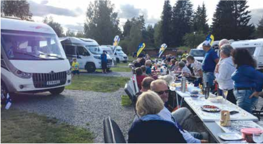
Iltaisin alueella oli pitkät pöydät, ja kisailtiin mm. nännikummin heitossa, pihajazzin peluussa ja bingossa.

km:n pituinen retki kierteli Kallaveden maisemia ja Saaristokaupunkia. Toinen suunnattiin Caramba-kisoihin läheisen City-Marketin parkkipaikalle. Kisat olivatkin tällä kertaa jäsentenväliset.