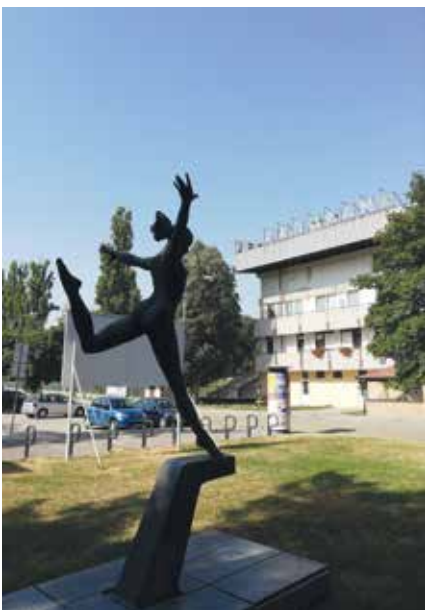
Panorama-keskuksen (Komarno, Slovakia) kunnianosoitus naisvoimistelijoille

Eipä silti, se varsinainen totinen paikka on vielä edessä. Unkari on suljettu, lähetystökään ei lähtenyt arvailemaan avautumisia. Varaudumme siihen, että termaalilähteet pitää etsiä Slovakiasta. Ajamme Besenovaan , ainoa camping kanttuei, ei jatkoon! Velky Meder (kauptunki lounais-Slovakiassa), iso hehtaartermaali Corvinus tökkii jo kättelyssä. Jätämme senkin nuoremmille ja ajamme Komarnoon , sielläkin pitäisi olla termaali. Lukuisia vuosia sitten vietimme yhden yön leirintäalueella, joka oli betoniaidoilla rajattu saksalaisten sumppu. Meitä katselivat silmäkarein. Ihan piruuttamme ajamme Tonavan sillalla olevalle Unkarin rajalle katsomaan, miltä sisarkauptunki Komaromissa Unkarin puolella näyttää.