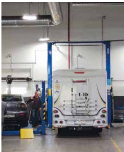
EuroAuton korjaamo on siisti ja ajanmukaisesti varusteltu.

Tällä kertaa varsin yleinen ”kompjuuter problem” ei osunut meidän kohdallemme. Papereiden ja passien tarkastukset