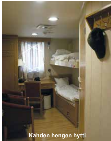
Kahden hengen hytti

käytännöistä. Koska olimme ainoat matkaajat, niin pääsimme miehistömessiin, normaalisti matkaajat ruokailevat matkustajamessissä. Suurin osa aluksen muusta miehistöstä oli filippiiniläisiä tai indonesialaisia, kuten esimerkiksi keittiöhenkilökunta, joten ruoka oli monipuolista ja maukasta.