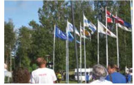
Liput liehuivat avajaisissa.

aktiivisesti eri hahmoissa alueella myyden arpoja. Iltaisin oli sitten jännittävä osuus, osuiko voittoja omalle kohdalle (ei osunut).