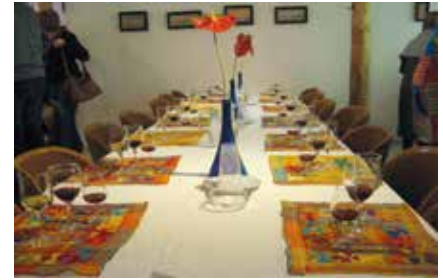
Alahovin tuotteet odottavat maistajia.