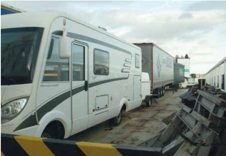
Matkailuauto oli yläkannella hyvin kiinnitettynä ja laivan sähköverkossa.

Ajanvietteeksi aluksella oli televisio, jonka ohjelmia voi seurata Englantiin asti. Käytössä olivat samat kanavat, kuin Travemünden reitilläkin. Lopputaikaan olisi voinut hakea videoita miehistömessistä. Aika kului kuitenkin lueskellen matkaan otettuja kirjoja ja aluksella olevia lehtiä. Puhelimen käyttö onnistui vain satamissa. Saunan saattoi laittaa lämpenemään milloin tahansa ja saunoa rauhassa vaikka päivittäin.