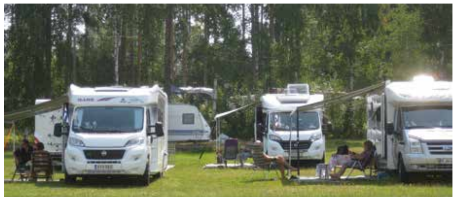
Tapahtumaviikonloppuun sää oli helteinen. Lämpö suorastaan väreili ilmassa. Jokainen pyrki hakeutumaan varjoon, jotta kuumuus oli helpompi kestää.