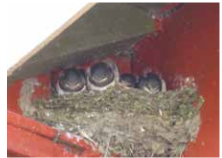
Pienet ”kausipaikkalaiset” räystään alla.

Paikalle oli saapunut n. 55 yksikköä. Myös muita kulkijoita oli paikalla ja tietysti alueen kausipaikkalaisia. Tunnelma oli mukavan leppoisa. Alueella oli myös muitakin ”kausipaikkalaisia”.