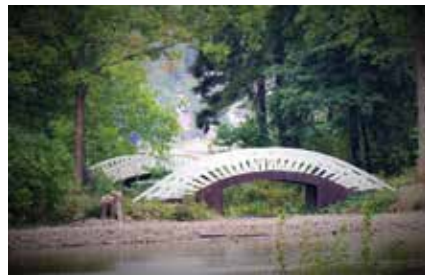
Monrepos-puiston"kauneimmat kaarisillat" kaukaa kuvattuna.

Puiston paikoitusalue on hyvin pieni. Auto sai pysyä vartioidussa parkissa ja me suuntasimme kohti puistoa kävelen. Onneksi niin. Autojono alkoi täälläkin kapean kadun varrella jo satoja metrejä ennen puiston porttia. Seuraavan reissun teemme arkipäivinä!