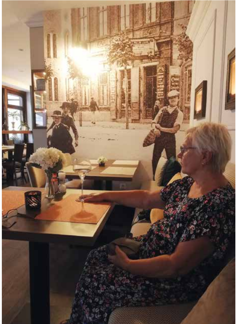
Ravintola Klapkassa astuu sisälle Komarnon menneisyyteen

Ajetaan Budziskoon lähelle Liettuan rajaa, sillä tarkoitus on pistäytyä myös Kaunasissa . Rajalla menee se tunti, joka monta viikkoa sitten rajalla Ogdodnikissa vaivalla hankittiin. Jossakin eteläisellä Riian tiellä tulee autostaan ulos keltaliivinen mies. Käsi nousee, siis hetkinen: mitenäs sen nopeusrajoituksen kanssa taas olikaan? No ei ollut poliisi asialla, vaan tullit. Kysyy henkilöpapereita, ajokortti riittää hyvin. Kysytään, oliko kenties sattunut föliin ylimääräisiä matkustajia Valko-Venäjän suunnalta? Tulli nyökkäilee hyväksyvästi, kun avaan vaatekaappina palvelevan pesuhuoneen oven. Sanoo myös uskovansa, että etupenkillä matkustava henkilö on vaimo. Päästään taas matkaan. Perhekeskustelussa esitetään väite, jonka mukaan keskustelu oli selvästi kuulostanut yritykseltä myydä vaimo liettualaiselle