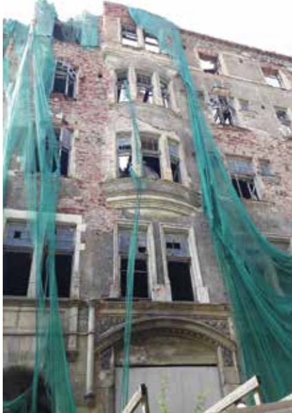
Domuksen talo Linnankadulla.

Toisaalta kaupunki rapistuu huolestuttavasti. Aikoinaan yksi Suomen hienoimmista asuinkerrostaloista, vuonna 1904 valmistunut Domuksen talo Linnankadulla, on romahtamisvaarassa.