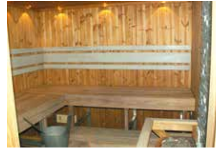
Saunan sai lämmittää aina halutessaan.