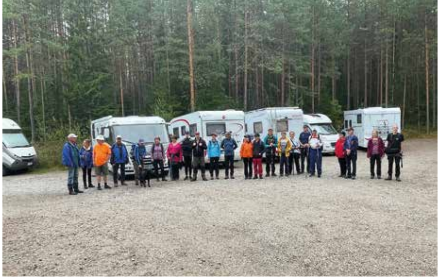
Tapahtumassa mukana oli 17 autokuntaa, joka oli tämäntyyppiseen tapahtumaan hyvin sopiva määrä.

Sateen ropistessa huppuihimme kävelimme autoille ja siirryimme Orilammen Majan camping-alueelle. Orilammen rannalta meille oli varattu savusauna, jonka löylyistä oli virkistävää pulahtaa uimaan. Samassa saunassa on