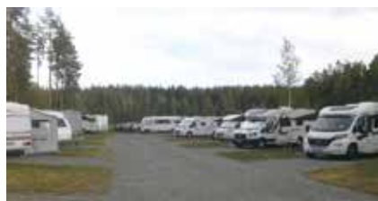
Paikalla oli 88 yksikköä.