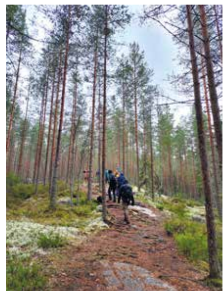
Repoveden kansallispuistossa reitit ovat yleensä helppokulkuisia. Korkeuseroja voi kuitenkin olla paljon.