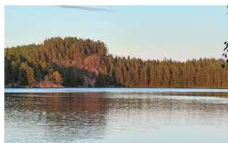
Repoveden kansallispuisto ss. 26-27