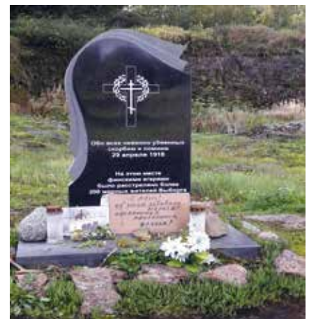
Pyhän Annan Vallien -muistomerkki

Jälleen viittaus lähihistoriaan. Ihmi-set toivat paikalle kukkia ja kynttilöitä. Tapahtumia ei ole unohdettu.