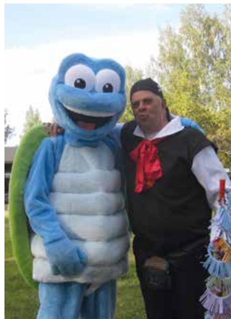
Malti Matkaaja ja Ari Arpamyyjä ss. 24-25