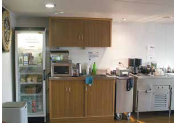
Laivan ainoa "ravintola", eli matkustajamessi.

Laiva ajaa Vuosaaren ja Bilbaon välin viikossa ottaen ja jättäen rahtia reitin satamiin. Meidän matkalamme kävimme Belgian Zeebruggen ja Englannin Tilburyn satamissa. Rahtilaivan luonteesta johtuen aikataulu on noin-arvio. Sovittu lähtöpäivä siirtyi vuorokaudella, samoin saapuminen Bilbaon, jonka lisäksi nukuimme extrayön satamassa laivan purkamisen ajan. Kokonaisuudessaan matkaan kului miltei kahdeksan vuorokautta. Levänneenä oli kuitenkin hyvä jatkaa matkaa.