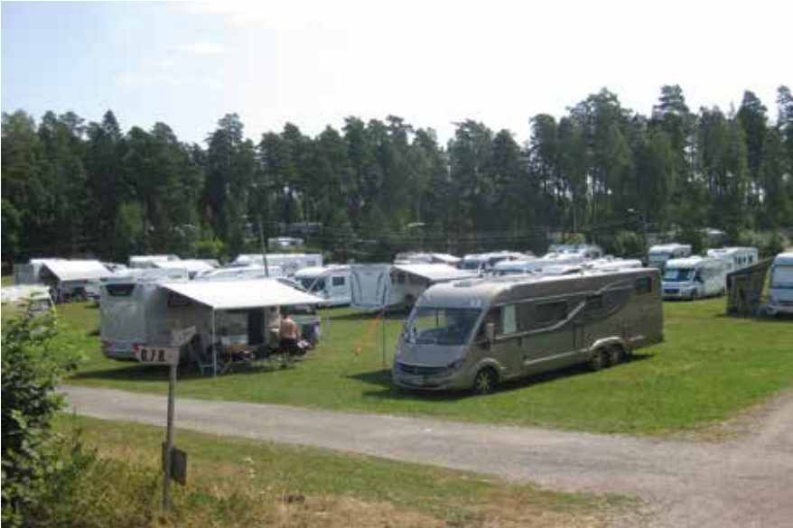
Kokoontumisajoihin saapui lähes 60 yksikköä MA-jäseniä. Lisäksi paikalla oli runsaasti alueen kausipaikkalaisia.

Korona oli estänyt Matkailuautoilijoiden tapahtumat niin talvella kuin keväälläkin. Jotain piti keksiä, jotta ihmiset voisivat tavata tuttuja pitkää aikaa. Tällainen hyvin vapaamuotoinen kokoontuminen ilman mitään isompaa ohjelmaa. Nähdä vain tuttuja ja vaihtaa kuulumisia.