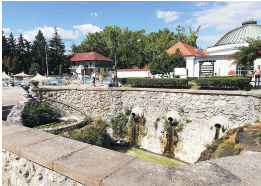
Turkkilaisajan edelleen käytössä olevia rakennelmia Egerin termaalikylpylässä.

Siis mitä ihmettä? Ei ristin sielua rajalla täälläkään! Ajamme suoraan Komaron leirintäalueelle ja kysymme tonttia ensi yöksi. Ei tipu sanoo virkailija ja selittää, että kyllä Unkariin tulla saa mutta yösjää ei anneta. Mikäs siinä sitten, taas toiselle puolelle Tonavan ja termaaliin. Se osoittautuu todelliseksi löydöksi! Vanhaa on ja osaksi kulunutta, mutta altaat ovat kuin meille tehtyjä ja tilaa riittää kaikille, myös leirintäalueella, joka on kadun toisella puolella. Kiireet loppuivat tähän, Panorama-urheilukeskus on meidän mesta!