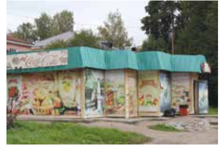
Kauppoja on Viipurissa monen tasoisia.

Vielä ennen kotimatkaa pistäytyminen uudessa kauppakeskuksessa. Pitkien palvelutiskien tarjontaa ei voi kuin hämmästellä. Mitähän täältä ei tarvittaessa löytäisi?