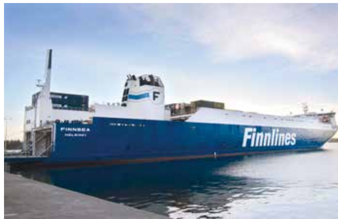
Tarvittavat matkustusasiakirjat kannattaa selvittää ennen lastausta.

Hinnat laskee linjapäällikkö. Kaksi matkustajaa voidaan majoittaa yhteen hyttiin, joka on tarkoitettu kahdelle henkilölle. Yksin matkustava voi halutessaan ostaa koko hytin itselleen. Tämäkin riippuu ammattikuljettajien määrästä.