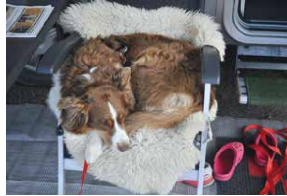
Matkailu on rankkaa hommaa.