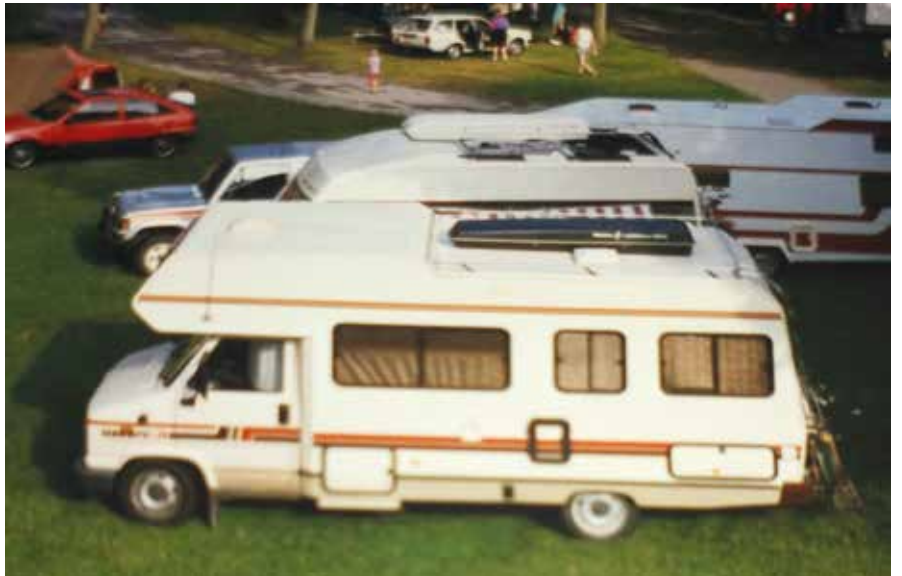
Pilote oli ensimmäinen matkailuautomme ja sillä teimme vuonna 1992 ensimmäisen Euroopan matkamme.