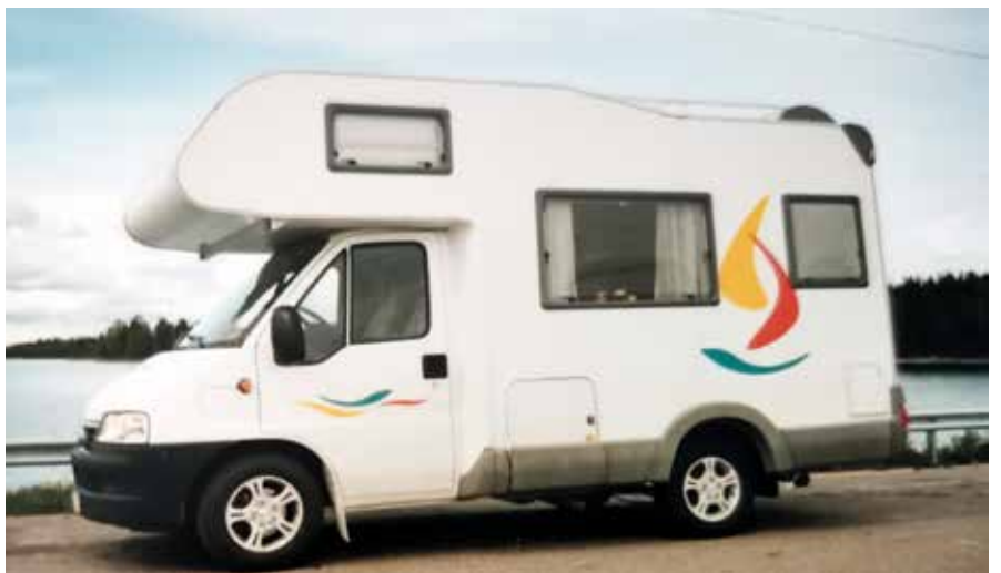
Pikkuinen Knaus auto sai meidät vuonna 2003 kiertelemään kaunista kotimaata.