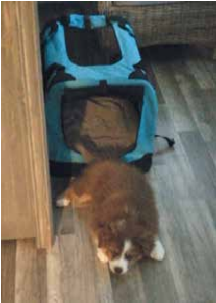
Nailoninen kevythäkki soveltuu hyvin pentujen kuljattukseen.