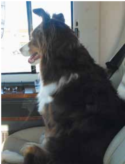
"Kartanlukija" valvoo matkan sujumista koko ajan. Toinen menee heti nukkumaan.

Meillä toinen koirista toimii seurakoirana ja valvoo koko matkan ajan ajoa ja sen sujumista penkiltä käsin. Toinen menee suoraan, liikkeelle lähdettyä, pöydän alle ja rupeaa nukkumaan.