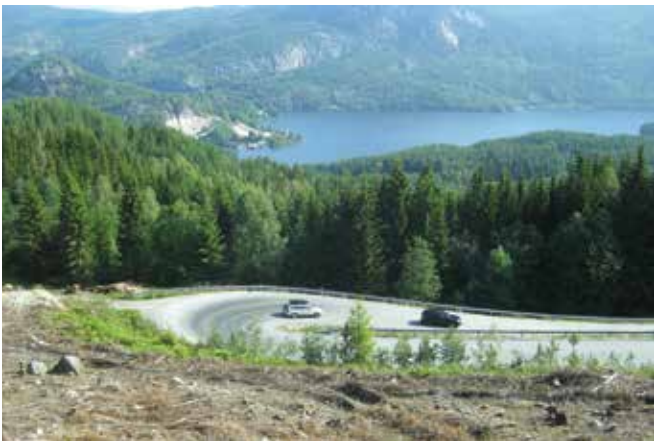
Aina ei tiedä onko menossa vai tulossa.