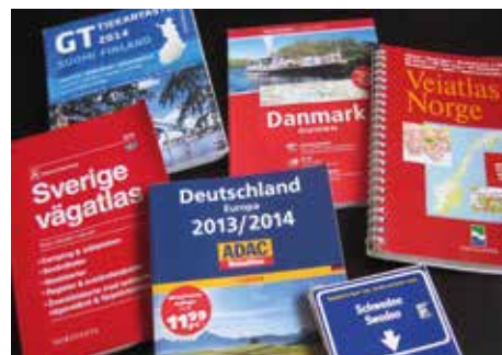
Kartoista on vielä hyötyä