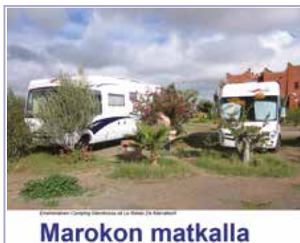
Matkakertomuksia ulkomaanmatkoista oli helpompi saada kuin kotimaan matkoista.

hallitukseen 2008. Hallitusurani kesti sitten lähes 12 vuotta vuoteen 2020 saakka.