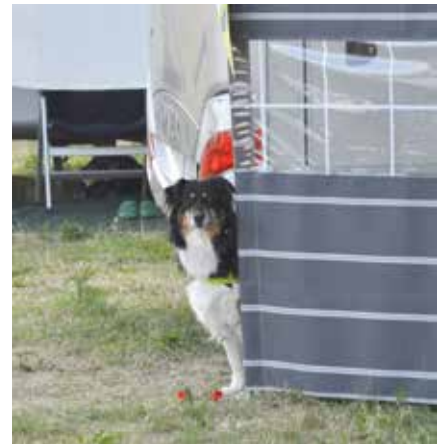
Minä vahdin täällä.

Koiran sopeutumisesta matkailuharrastukseen kertoo myös karvakuonujen runsaus alan harrastajien keskuudessa. Normaalisti autoon ei tarvita rakenteellisia muutoksia koiran takia, mutta jos sellaisia tarvitaan, kannattaa miettiä miten toteutus tehdään ja käyttää toteutuksessa ammatti-ihmisten apua.