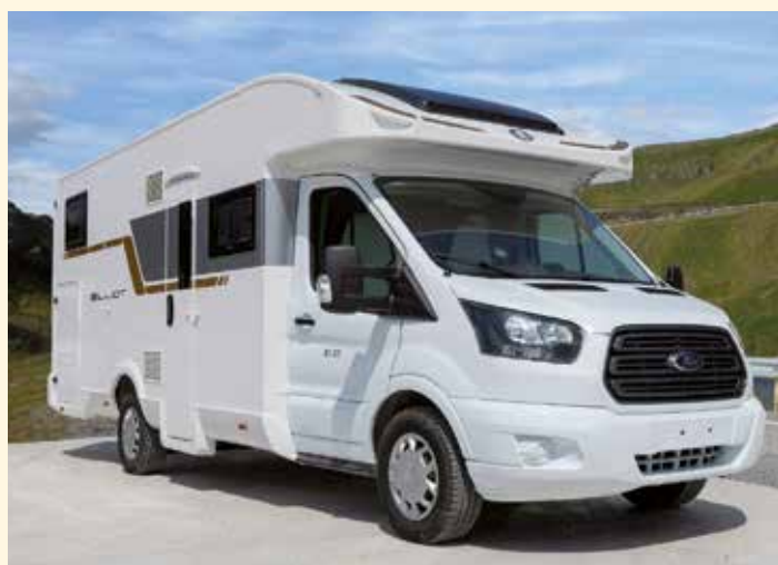
CI Elliot puoli-integroidut ja alkovit Ford-alusta 170 hv moottorilla