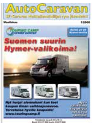
MA-Sanomien edeltäjä AutoCaravan -lehti

SF-Caravanin Vuoden yhdistykseksi MARY valittiin Kokkolan liittokokouksessa 2009.