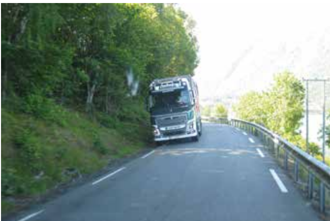
Joskus joutuu kaapeille teillekin.