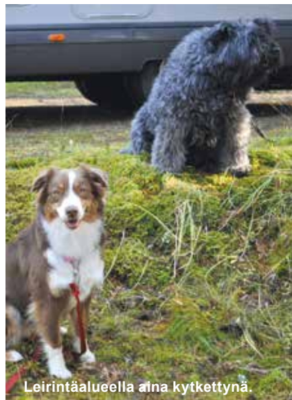
Leirintäalueella aina kytkettynä.

Koira on alueella pidettävä kytkettynä. Meillä siihen on varattu omat liinat, jolloin koira pääsee vaikka auton alle varjoon, jos on kovin kuuma ilma. Liinojen ei auta olla liian pitkät, että ohikulkijat pääsevät turvallisesti ohi. Tietysti on myös huolehdittava siitä, etteivät koirat aiheuta ylimääräistä häiriötä haukkumalla. Alueella muistetaan myös käyttää aina ns. kakkapusseja, sekä yrittää aina ehtiä koiran kanssa alueen ulkopuolelle ennen tarpeiden tekemistä. Kesällä kannattaa myös kysyä, onko koirille omaa uimarantaa tai muuta suosituspaikkaa, mukavaa luontopolkua tai ulkoilureittiä. Alueita valitessamme arvostamme näitä kovasti.