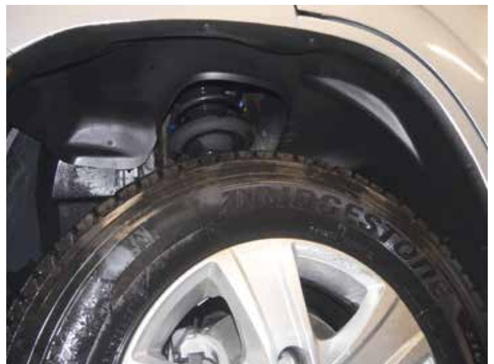
Lopputuloksena on hyvin suojatut etulokasuojat. Näin estetään kuran ja suolan pääsy varsinaisiin lokasuojiin ja suojataan jousien yläpäätä.

Sisälokasuoja sulkee lokasuojan sokkelot. Etureunassa olevan ilmakaunan ansioista kosteus poistuu kotelosta ajon aikana, joten lika ei kerrostu koteloihin, eikä mekaaninen kulutus vahingoita pellin suojakerroksia.