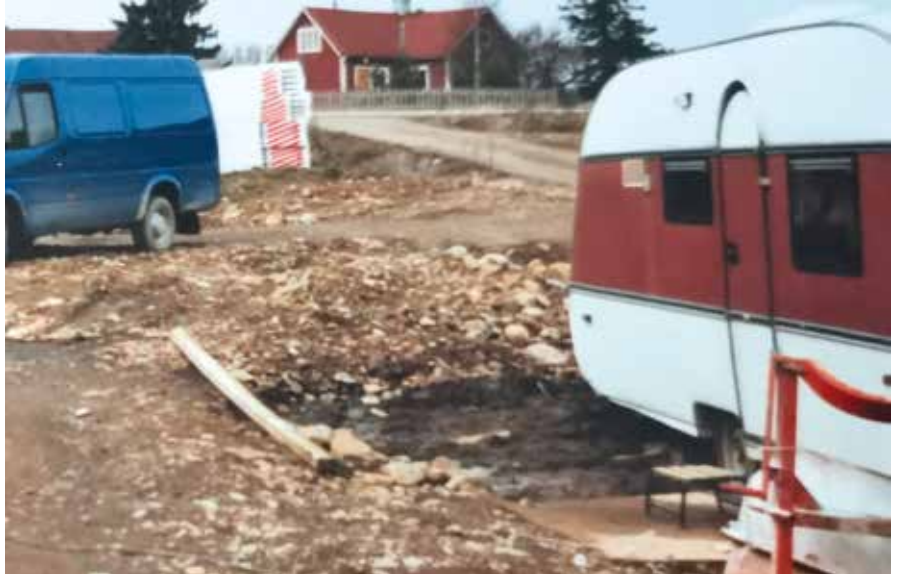
Matkailuni alkoi SMV:llä 1980 -luvun puolivälissä perheeni kanssa. Vaunu toimi aluksi myös aviopuolison työmaalla taukotilana. Tästä se kipinä lähti matkailuun.