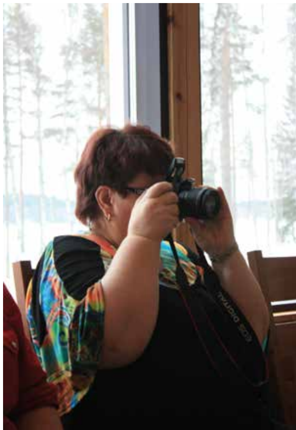
"Paparatzzi" taas kerran etsimässä kuvattavia kohteita.

Kun yhdistys oli hyväksytty liittokokouksessa SF Caravan ry:n yhdistysten joukkoon, piti yhdistykselle valita ensimmäinen täysikokoinen hallitus. Tämä yhdistyksen vuosikokous pidettiin Gasthaus-Camping Koskenniemessä Hartolassa. 24.5.2008. En tiedä mikä mielenhäiriö minuun iski, kun annoin luvan ehdottaa itseäni hallitukseen. No, niinhän siinä kävi, että tulini valituksi