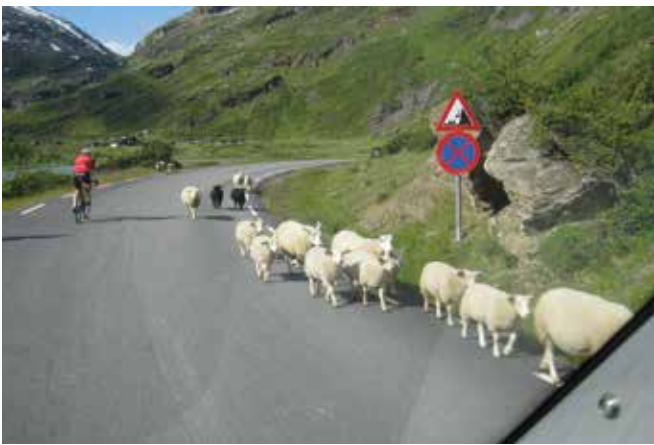
Matkalla kohtaa monenlaista kulkijaa.