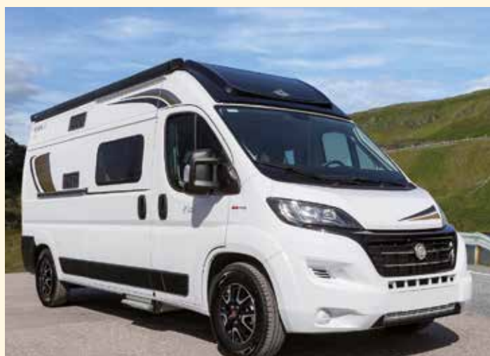
CI Kyros Retkeilyautouutus nyt Suomessa!