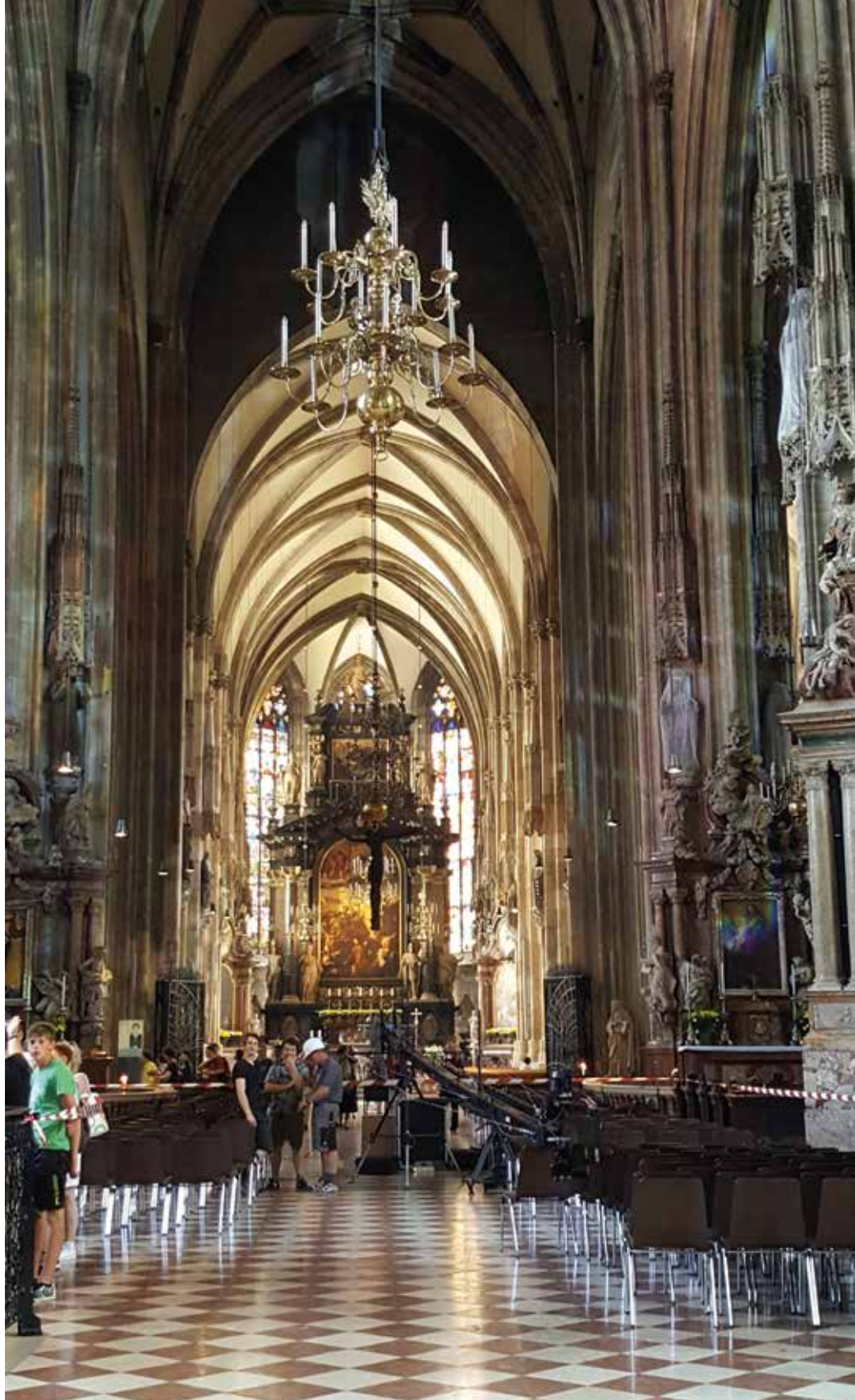
Wien, Pyhän Tapanin katedraali

Brnosta seuraava yöpymispaikka oli Puolassa Czestochowan kaupungissa oleva entuudestaan tuttu leirintäalue nro. 76 ”Camping Olenka” Jasna Goran kukkulalla kuuluisan 1300-luvulla perustetun pauliiniluostarin vieressä. Luostari on Neitsyt Marian kultin keskus ja vetää puoleensa vuosittain kymmeniä tuhansia pyhinvaeltajia ja turisteja koko maailmasta. Luostarin kappelissa on kuuluisa ihmeitä tekevä Jumalanäidin ja Jeesuslapsen ikoni, niin kutsuttu Musta Madonna 1400-luvulta. Myös luostarin aarekammio on todella uskomaton ja tutustumisen arvoinen.