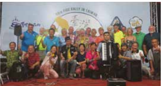
Tässä pääosa ulkomaalaisista ja kaksi näkövammaista muusikkoa jotka viihdyttivät yhden illan.