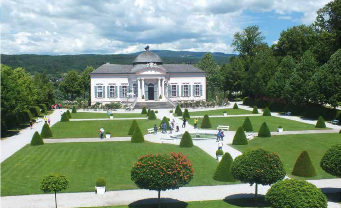
Luostarin barokki puutarha