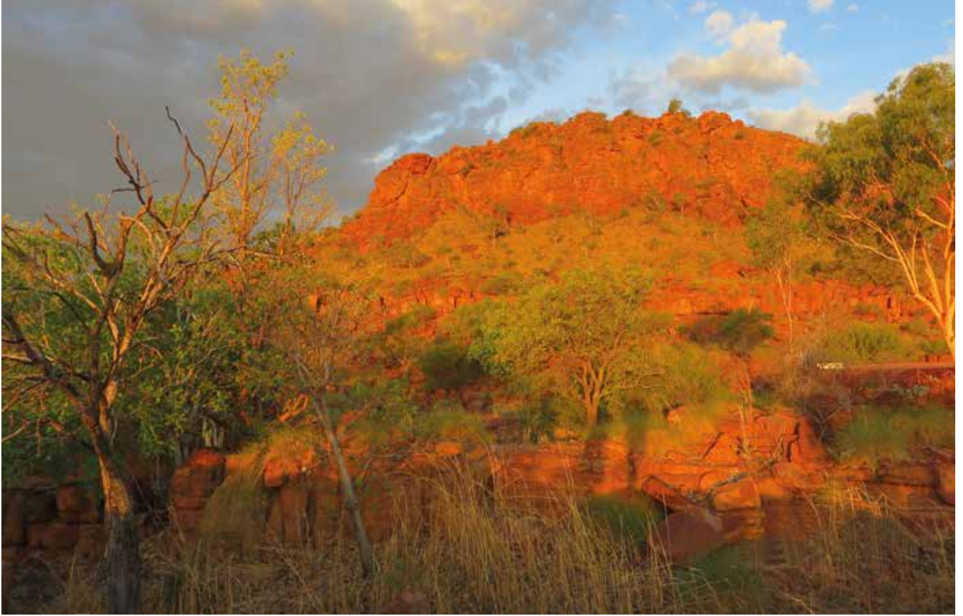
Päivällä harmaata, illalla auringon laskiessa loistavia värejä