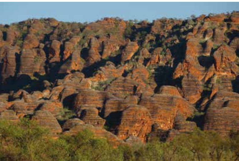
Gorkin Kansallispuiston kalliomuodostelmia

Matkareitti oli yksinkertaisuudessaan, ensin pohjoiseen, sitten itään, sieltä länteen ja takaisin pohjoiseen, paluu Suomeen Darwinista. Matkamme suuntautui luonnon- ja kansallispuistoihin. Edellisellä matkallamme olimme ihastuneet eläimistöön ja karuun luontoon. Pohjoisen luonto tarjosi enemmän vaih-