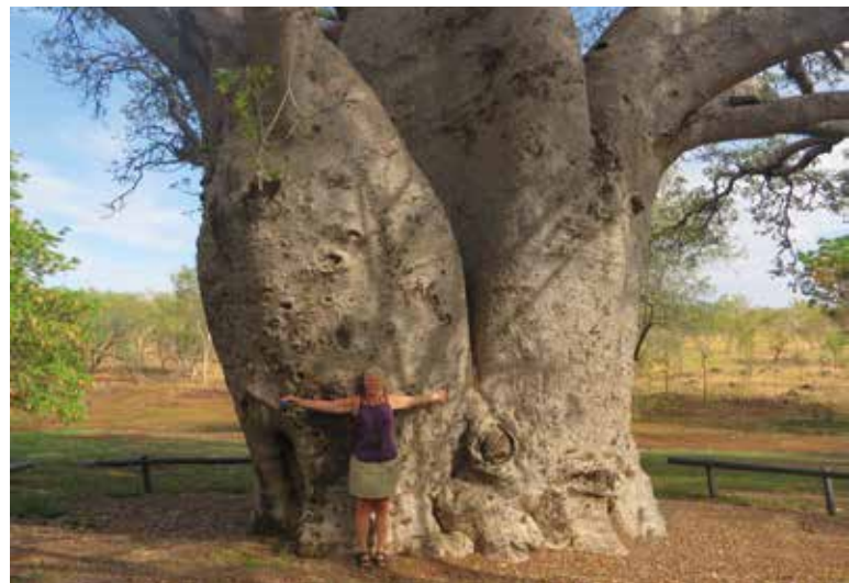
Joku maahanmuuttaja perhe oli asunut tällaisen puun sisällä useita vuosia