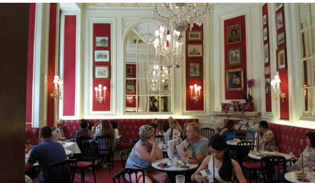
Sacher kahvila Wienissä

Seuraavana päivänä palasimme hetkeksi moottoritielelle jatkaen matkaa pohjoiseen sekä Katschberg- (5,4 km), että Tauern tunnelin (6,4 km) kautta kohti Salzkammergutin kaunista alppijärviä Salzburgin itäpuolella. Päätimme kuitenkin muuttaa hieman alkuperäistä suunnitelmaa ja suuntasimme aluksi Hallstattin kaupunkiin pienen Hallstättersee järven rannalla. Saapuessamme tähän pieneen viihtyisään kaupunkiin yllätyimme, sillä turistien määrä oli valtaisa. Asiaa siinä ihmetellessämme vastaan tuli kyltti jossa luki Camping Klausner-Höll, jota toivoimme löytävämmekä kaupungista, sillä alue ei löydy mistään leirintäalueoppaasta. Leirintäalueen mukava omistaja istui vastaanotossaan tarjoten meille kaksi vaihtoehtoa. Joko perinteinen leirintä tai