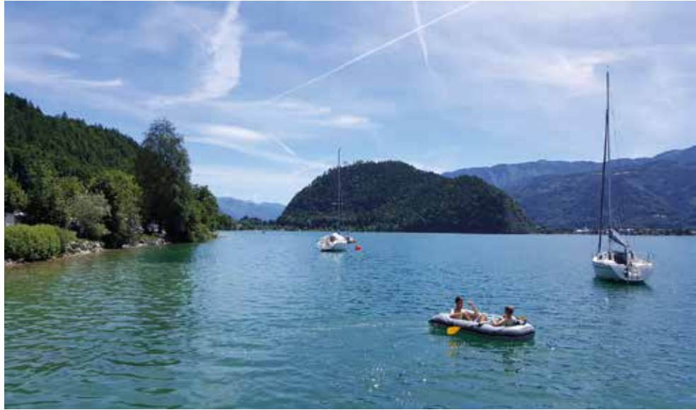
St. Wolfgang See

mutta maltoimme pysyä poissa jatkaen matkaamme kohti via Balticaa ja Latvian rajaa.