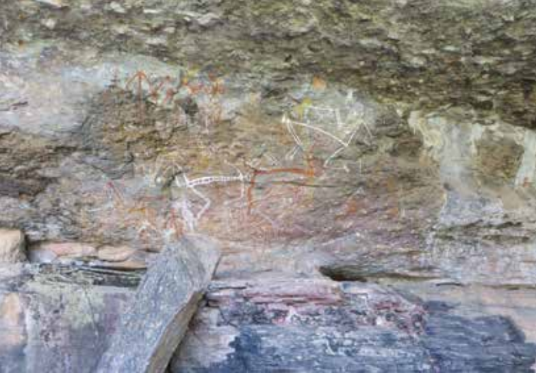
Kalliomaalauksia Kakadun Kansallispuistossa