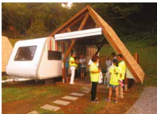
Vaunussa kaksi makuuhuonetta ja keskellä olohuone, keittiö ulkona katoksessa.