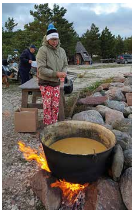
Kukahana tuon lopun sopan syö

Saavuimme Kalanaan hyvissä ajoin jo torstaina. Pystyimme leirin ja lähdimme tutustumiskierrokselle alueella. Sää oli aurinkoinen mutta kova tuuli puhalsi Itämereltä päin.