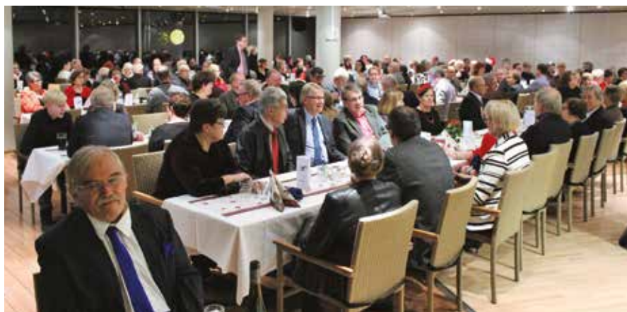
Puheensorinaa riitti salissa ruokaa odotellessa