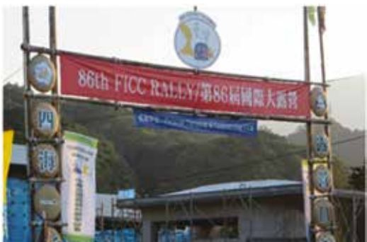
Portti FICC alueelle