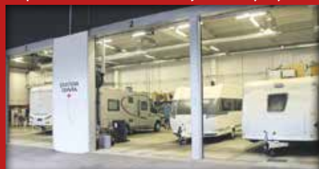
Nykyaikaisissa huoltotiloissa työskentelee 10 mekaanikkoa.