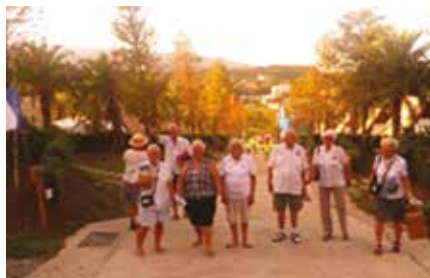
Näissä kuvissa monelle FICC kävijälle tuttujahmisiä.