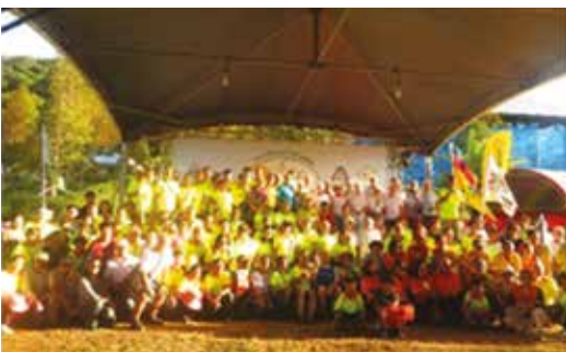
Kaikki osallistujat ei tähän kuvaan sopineet

S uomesta osallistujia 3kpl, Brittejä n. 20, Hollannista muutama, ranskalaisia yksi pariskunta, kiinalaisia parikymmentä, Japanista muutama osallistuja esittelemässä Japanin tapaamista v.2019, Taiwanista 200-300 henkeä.