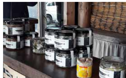
Kalaa sai ostaa kotinviemiseksi myös

Illalla alkoivat sitten tanssit, jonka lisäksi yllätysohjelmanumerona estradille astui oikea sirkustaikuri, joka esitti taidokkaan ja vauhdikkaan ohjelman. Kaikki viihtyivät, niin lapset kuin aikuisetkin. Siinä ohessa tarjoiltiin suklaakonvehtia melkoisia määriä. Ja jossain välissä ehdittiin myös pitää perinteisiä arpajaisia.