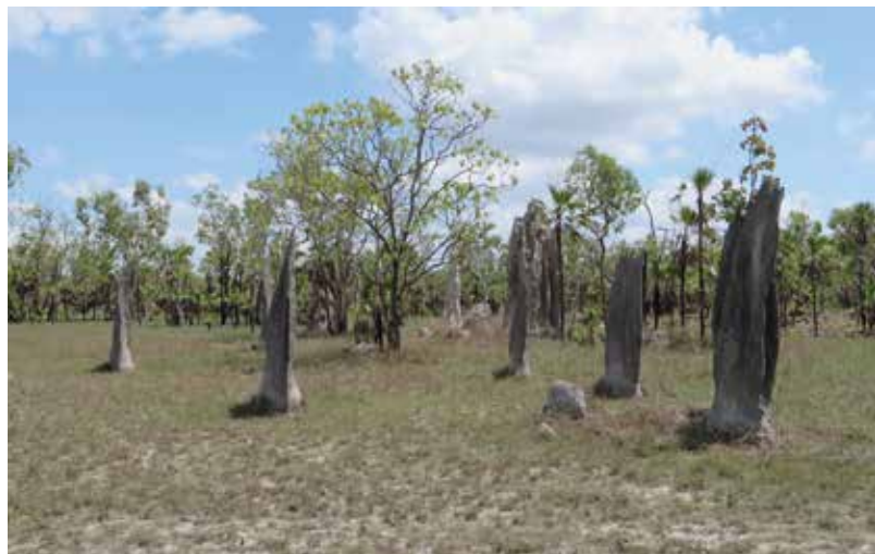
Mangnetik termiittien kekoja kaikki rakennettu saman suuntaiseksi