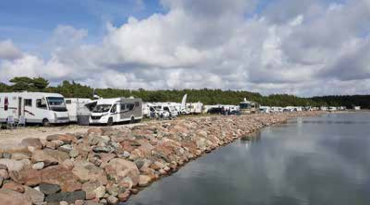
Sää suosi treffiväkeä