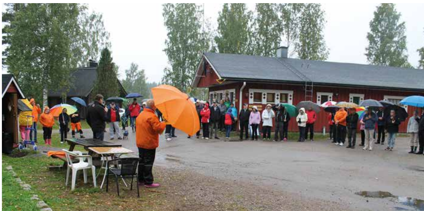
Syyspäivien avaus pienessä tihkusateessa

Perjantaina paikoitus saatiin tehtyä melko hyvässä säässä. Palvaanjärveläiset olivat savustaneet lohta myyntiin. Lähes kaikki tulijat nauttivatkin maukaasta kalasta. Alueella oli kaksi ranta-saunaa. Perjantai iltana naiset pääsivät-