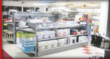
Tarvikemyymälässämme laaja valikoima tarvikkeita ja varaosia.