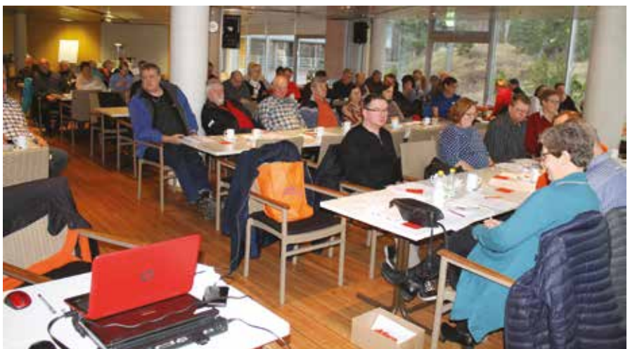
Ennen kokouksen alkua nautittiin kahvit suolapalan kera