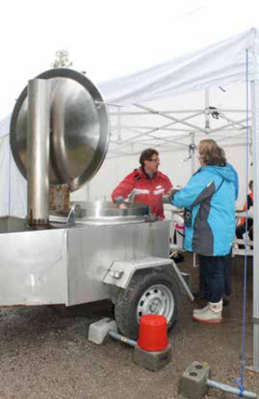
Kaikille tarjottiin lohikeittoa, santsatakin sai