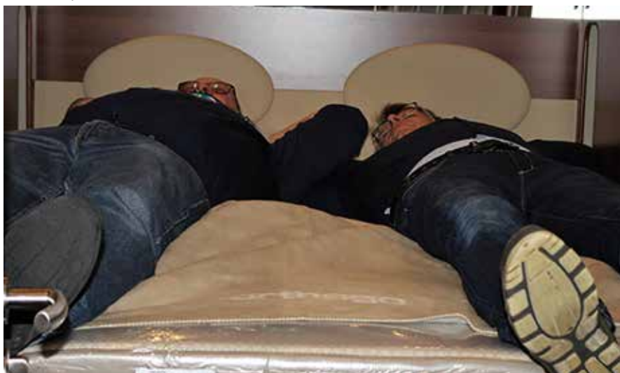
Rankka messuviikonloppu takana, reporterit ja kuvaajat, ovat huikeassa autokuumeessa..