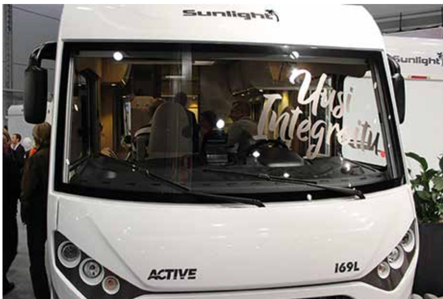
Huokeampi integroitu matkailuauto.