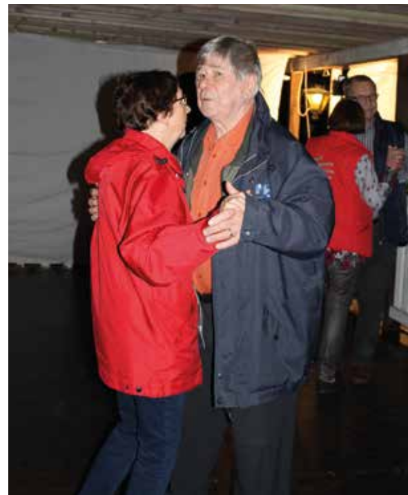
Teltassa oli tunnelmaa ja tanssi maistui