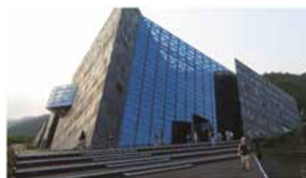
Retkikohde upea museo National Centre for Traditional Arts and Lan Yang Museum ja arkkitehtia innoittanut esikuva hämmöttää merellä. Kauempaa katsottuna näyttää kuin rakennuksen toinen pää olisi vajonnut maahan.