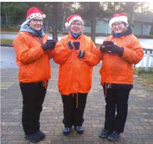
Perjantaina pikkujoulun viettoon saapuvia otti vastaan nämä tontut