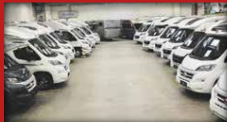
Lämpimissä sisätiloissa 40 matkailuajoneuvon näyttely.