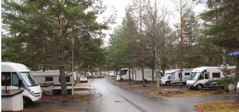
Ei ollut lunta Yyterissä