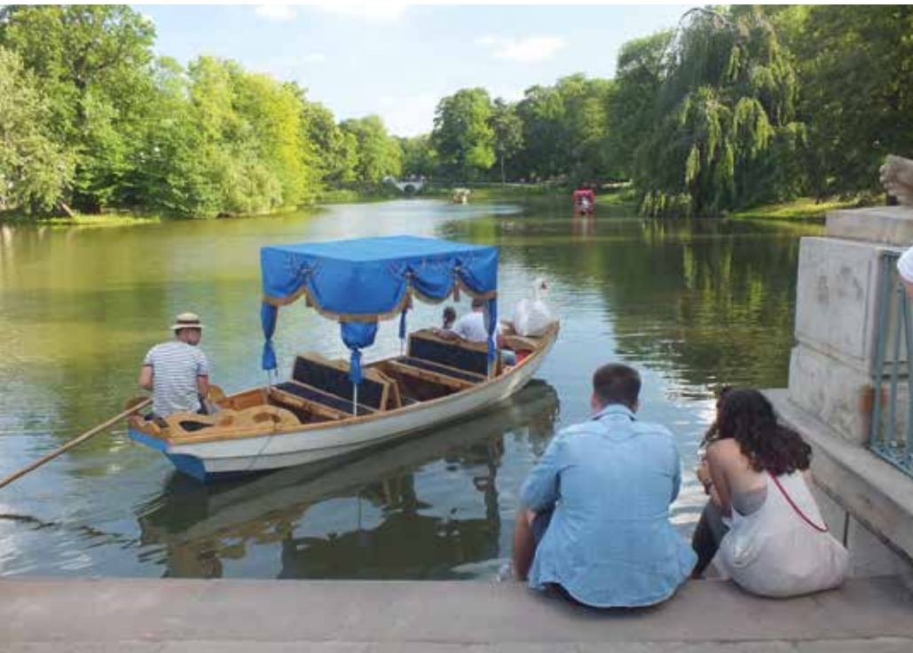
Lazienkin puisto Varsovassa