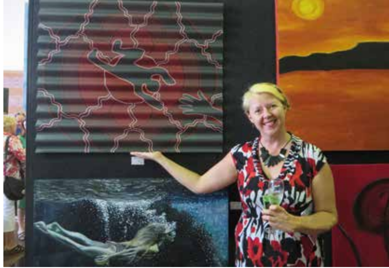
Suomalainen taiteilija monikulttuurisessa taidenäyttelyssä

telua, vehreyttä, autiomaata ja erilaista elämistä.