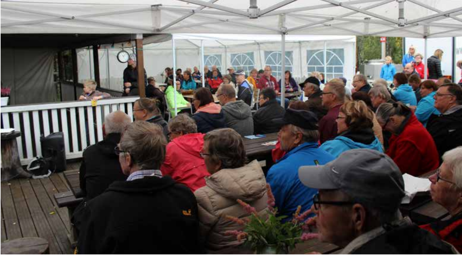
Sunnuntain turpakäräjille riitti vielä väkeä

kin ensiksi testaamaan vasta aamulla valmistunutta saunaa. Löylyt olivat erinomaiset. Miehet päästettiin lauantaina testaamaan uuden saunan löylyjä. Saunan jälkeen vietimme iltaa, seurustellen ja karaokea laulellen.