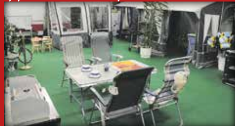
Meiltä löydät myös teltat ja muut lisävarusteet.

Uutta! Nyt meiltä kaikkiin uusiin Fiat-matkailuautoihin kaupan päälle FIAT MAXIMUM CARE CAMPER FIAT-ALUSTAN LAAJENNETTU TAKUU 5 vuotta / 100 000 km!