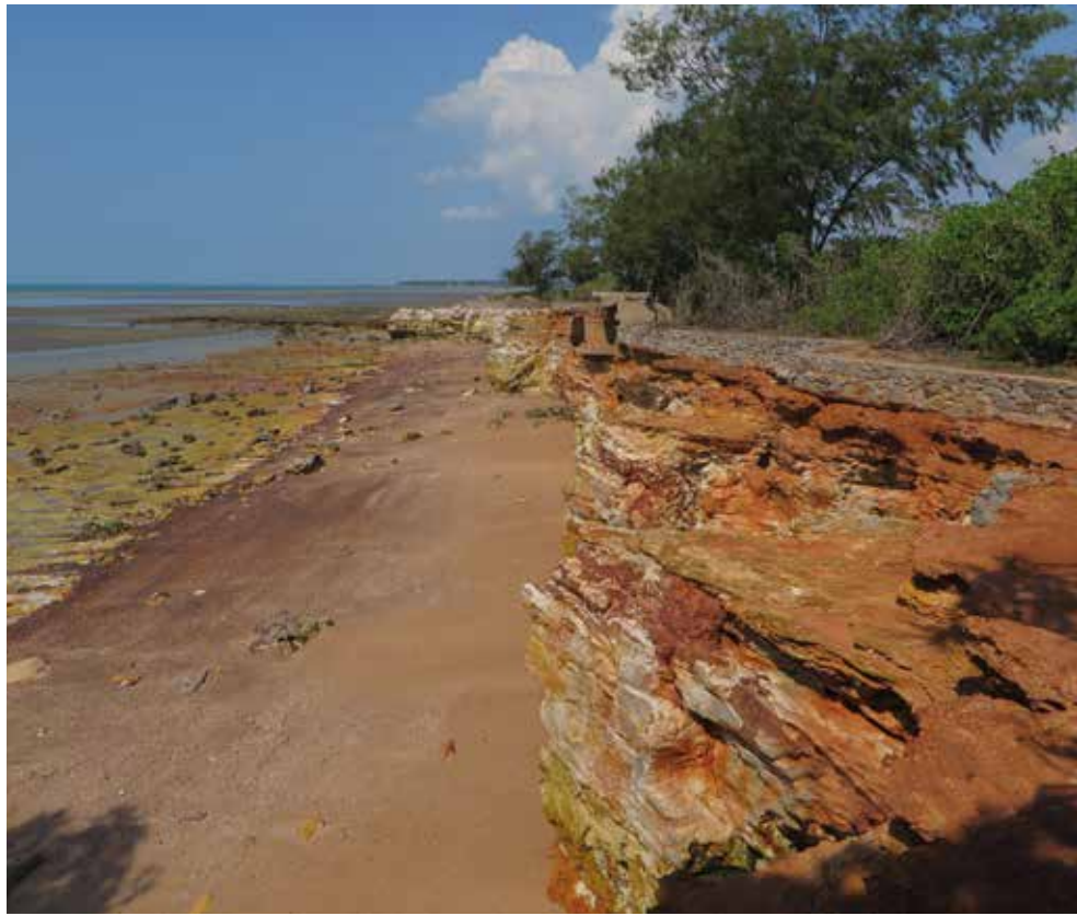
Meri ottaa rantaa haltuunsa

Purnululu Kansallispuistoon ajoimme 40 km matkan, mutkaista, ylös ja alas