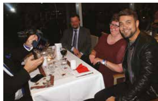
Näin se huippuartisti osaa ottaa yleisönsä

Illan vaihtuessa yöksi ja yön valjettessa aamuksi jokainen palailikin omiin yösijoihinsa yöpuulle. Ilta oli kaikin puolin vatsantäyttävä, mukava, viihdyttävä ja juhlava.