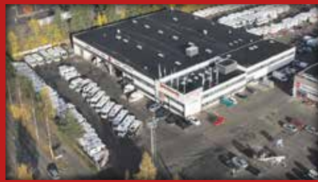
Valikoimissamme yli 150 matkailuajoneuvoa.

Tarvikkeet ja varaosat nopeasti ja kätevästi verkkokaupastamme https://kauppa.jyvascaravan.fi