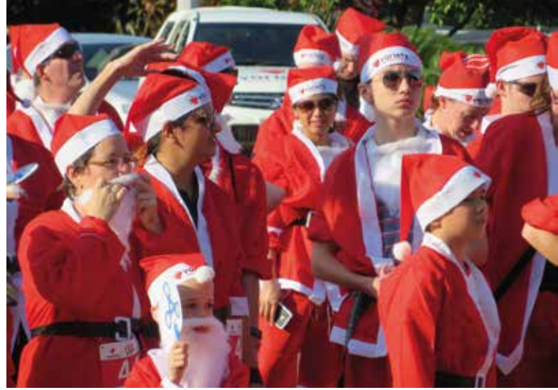
Tontut ja pukit lähdössä kuntolenkille Darwinissa