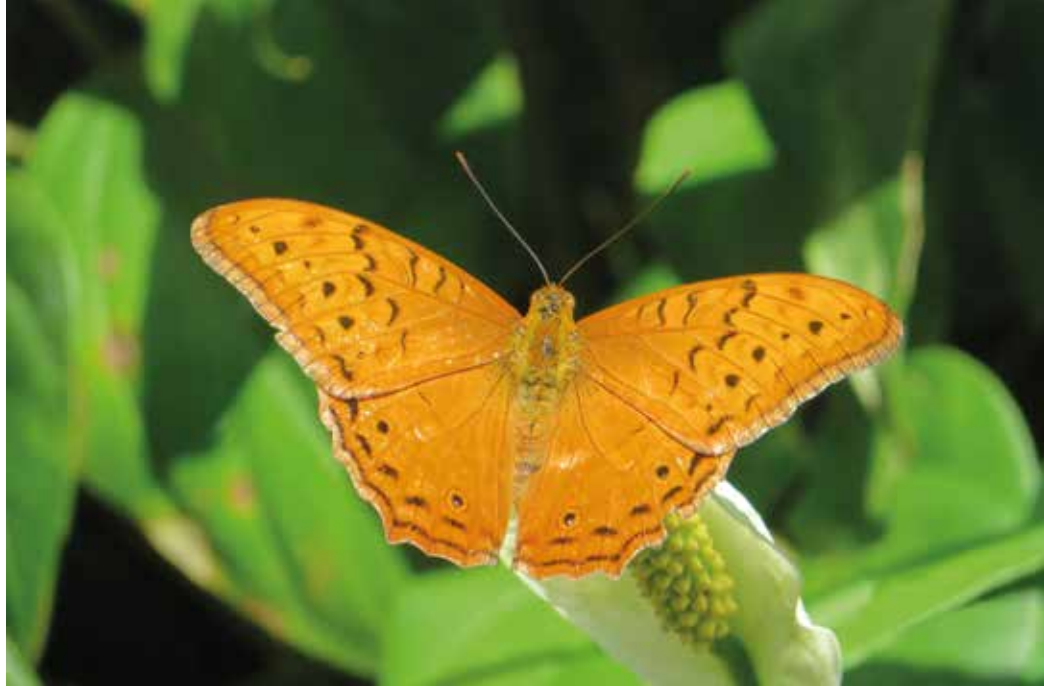
Siipenväli reilut 10cm

Cairnsin botanicgarden oli hieno. Yhdessä kasvihuoneessa oli upeita vä-