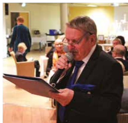
Timon mietteiden alkuperä oli peräti 1800 luvulla