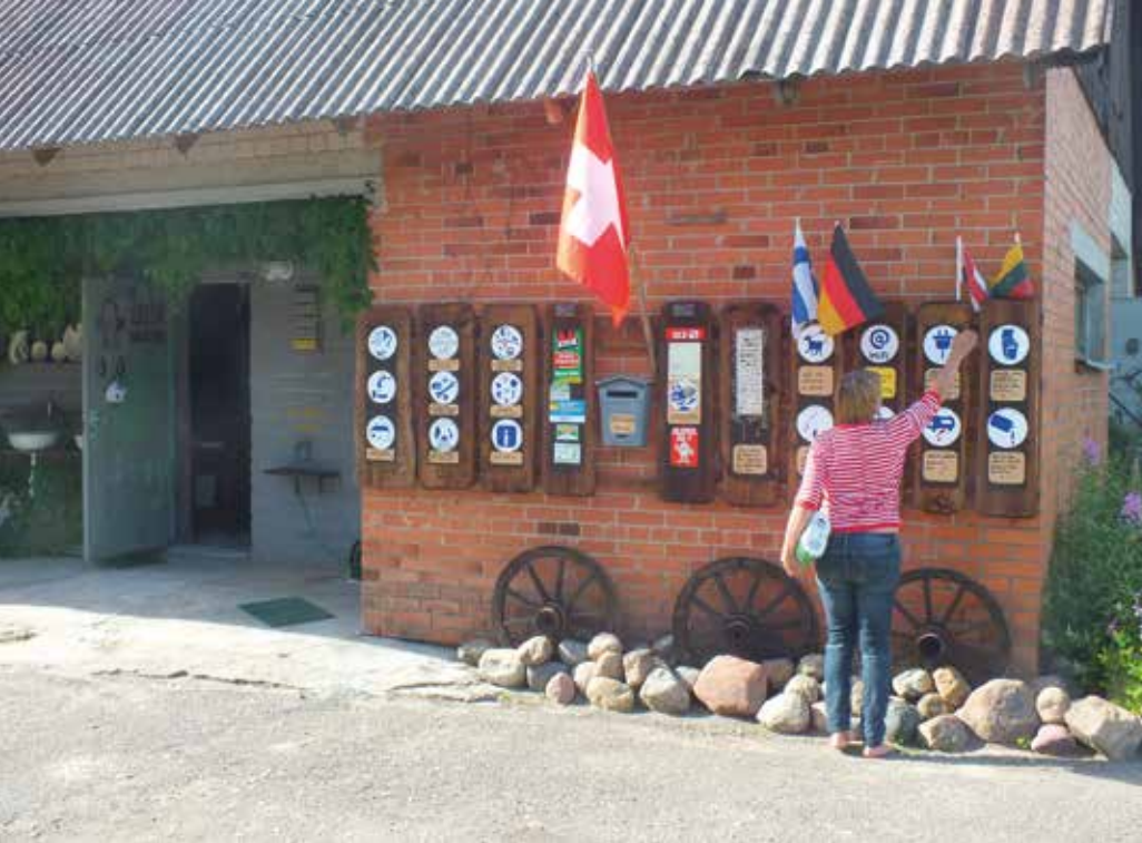
Pihaleirintäalue Pajiesmeniain kylässä Liettuassa

pittoreskisessä kaupungissa, hakeuduimme autolle ja jatkoimme matkaamme suunta kohti Klosterneuburgin pikkukaupunkia Wienin pohjoispuolella.