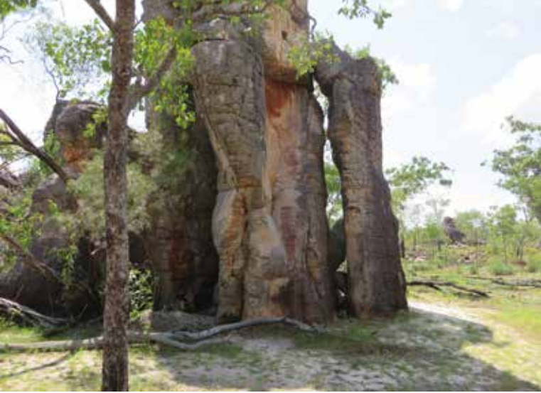
Maahanmuuttaja perhe oli asunut tällaisen puun sisällä useita vuosia