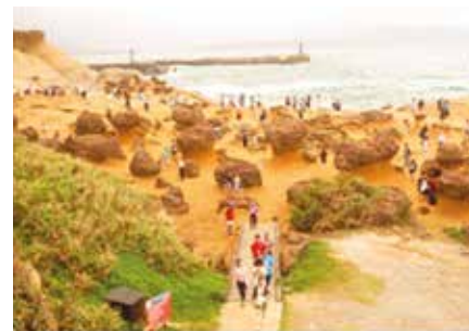
Yehliu Geopark. Veden muotoilemaa hiekkakivistä merenpohjaa