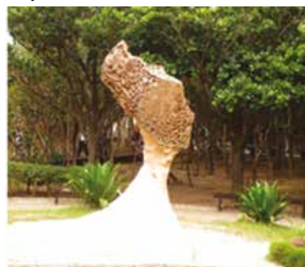
Queen's Head ( Kleopatran pää), myös veden "veistämä" Luonnon muotoilemia