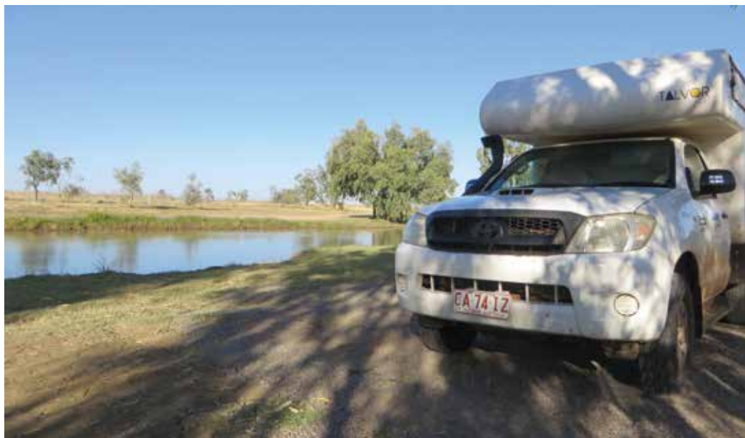
Kotimme ja kulkuvälineemme

Luolamaalaukset, kalliopiirroksat ja arkeologiset löydöt kertovat heidän kulttuuristaan, uskonnostaan ja tai- doistaan. Yli 50000 paikkaa on tähän mennessä luetteloitu, mm. Ubirin ja Nourlangie Rockin upeat kalliotaide- galleriat. Monet maalaukset esittävät arkielämän tapahtumia. Niissä on myös