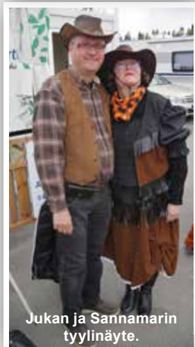
Jukan ja Sannamarin tyylinäyte.