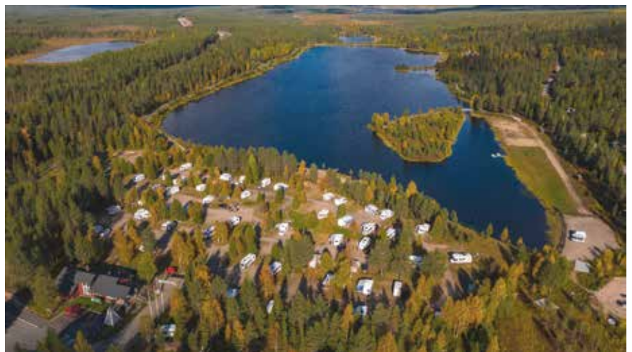
Sallinen Camping Salla-tunturin juurella oli onnistunut valinta yöpymispaikaksi.