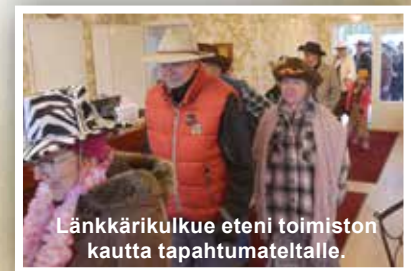
Länkkärikulkue eteni toimiston kautta tapahtumateltalle.