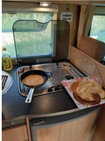
Rovaniemellä pidimme lettukestit autossa.

Joulupukin pajalla joululaulujen soidessa sai kummasti kiinni joulutunnelmasta, vaikka helle olikin. Lapsenlapsille piti myös laittaa joulukortit tulemaan Joulupukin Postista. On todella kiva tapa, että voi laittaa ne laatikkoon, josta ne postitetaan vasta jouluna. Kävimme jopa tapaamassa poikien kanssa Joulupukkia pajallaan. Hän kuultuaan Rudolfin nimen olisi jopa palkannut koiramme töihin sijaistamaan poroansa Rudolfia eli Petteriä!