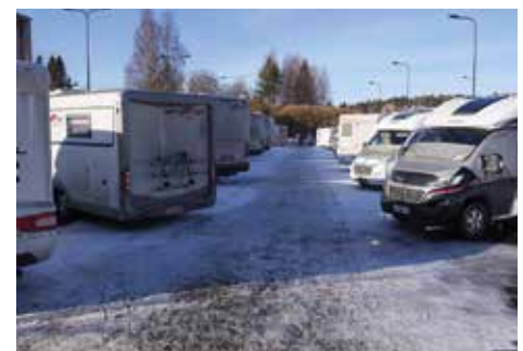
Talvipäivät Vesileppiksessä ss. 16-17