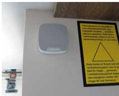
Järjestelmään voi valita sisä- tai ulkosireenin.

valitessasi, että se toimii myös Suomen rajojen ulkopuolella. Ajax-sovelluksen asennus ja käyttö on maksutonta. Hyvä ominaisuus on se, että käyttäjä voi tarvittaessa sopia hälytysvalvonnasta vartiointiliikkeen kanssa esimerkiksi talvisäilytyksen ajaksi, jos ajoneuvo ei ole kotipiirissä.