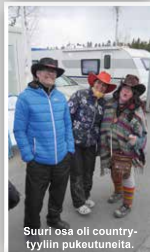
Suuri osa oli country-tyyliin pukeutuneita.