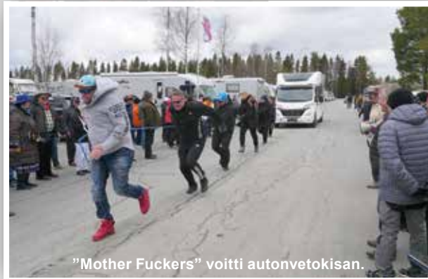
"Mother Fuckers" voitti autonvetokisan.