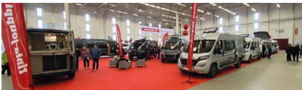
Varsinkin retkeilyautoja oli esillä paljon erilaisiin käyttötarpeisiin.

”Parkkeja alustaan on saatu kerättyä hyvin. Erityisen tyytyväinen olen suomalaisten kylien ja kyläyhdistysten kanssa aloitetusta yhteistyöstä, joka tuo pienillekin paikoille uusia matkailijoita