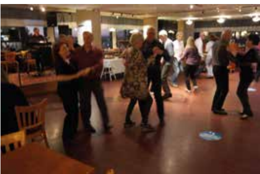
Tanssijoita riitti molempina iltoina.