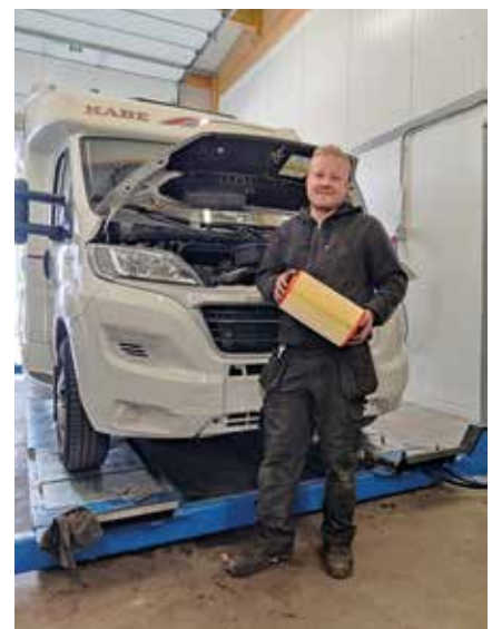
Jesperi vaihtaa ilmansuodatinta.

JEKI OY Rajamaankaari 21, 02970 Espoo Puh. 010 5175630 www.autohuoltojeki.fi