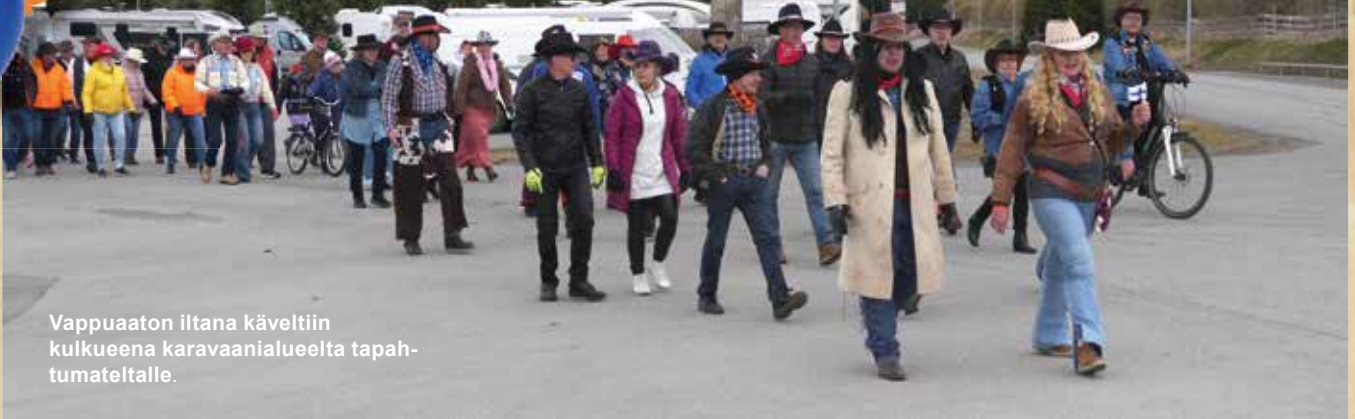
Vappuaaton iltana käveltiin kulkueena karavaanialueelta tapahtumateltalle.