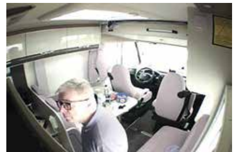
Hälyttimen asennus ss. 12-13