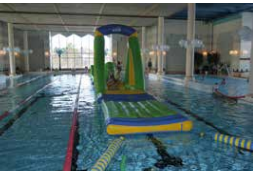
Kylpylässä viihtyivät lapset ja aikuiset.