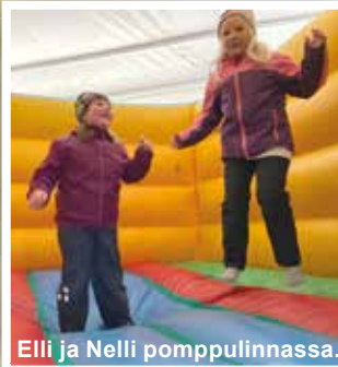
Elli ja Nelli pompulinnassa.