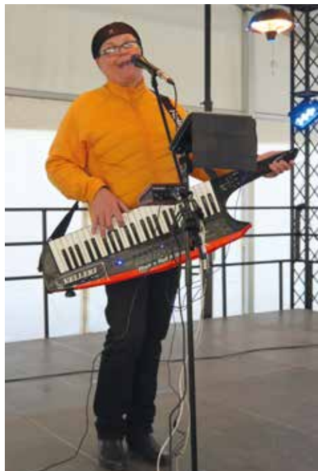
Velleri viihdytti OnnenWapussa perjantai-iltana ss.8-9