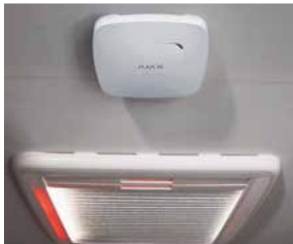
Kattoon sijoitettu palovaroitin on tärkeä osa järjestelmää.