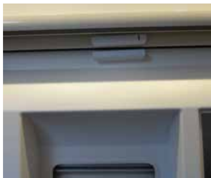
Ovitunnistimet voidaan sijoittaa ylä- tai sivukarmiin.