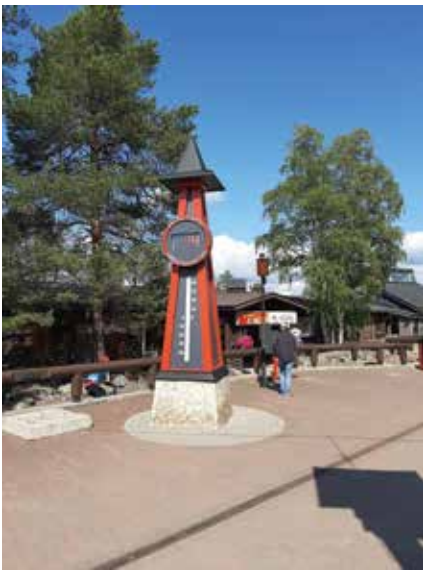
Rovaniemelle Napapiirin (Arctic Circle) ja Joulupukin Pajakylän kautta.

No, autolle koirien kanssa päästyäni ja suihkussa käytyäni olin jo rauhoittunut. Päätin sitten leipoa miehelleni tuoreet sämpylät anteeksipyynnöksi kimpaantumisestani tunturissa. Vähän alkoi jo naurattaakin koko juttu. Ulos katsellessani luonto ja Saana tunturi alkoivat kummallisesti myös tuntua sydänalassa lämpimänä tunteena. Olisko se sittenkin totta se Lapin lumo?