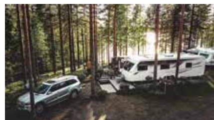
Kiiltomäkien Suomen "koti" pari vuotta sitten.

Kaikkiaan Kiiltomäet kokivat, että heidät otettiin heti lämpimästi vastaan.