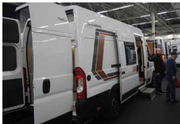
Esim. huoltomiehillä tarkoitetussa retkeilyautossa makuutila on huoltotallin päällä.