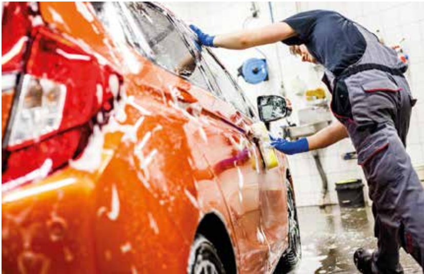
Prescon korkealuokkaiset tuotteet ovat erityisesti ammattilaisten suosiossa.

maan uutta tuotesarjaa mihin olen valinnut yli 30-vuoden kokemukseni perusteella mahdollisimman kapean valikoiman eli parhaat kemikaalit, tarvikkeet ja koneet, siis kaikki ylimääräinen turhuus on tästä tuotesarjasta karsittu pois. Tämä uusi linja on saanut myös oman yhtiön, jonka nimi on House of Ghost Killer Oy , jonka alaisuudessa on seuraavat brändimerkit: Ghost Wash eli viralliset kotisivut, Ghost Killer eli kemikaalit ja vielä Ghost Shield eli nanokeraaminen pinnoite.