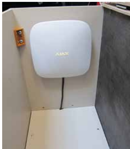
Keskusyksikkö sijoitettuna istumalaatikkoon.

Kolmesta vaihtoehdosta päädyin Ajax-hälytinjärjestelmään, joka on palattu useasti parhaaksi hälytin- ja turvajärjestelmäksi. Valmistaja on Euroopan suurin kiinteistöjen hälytinjärjestelmien valmistaja. Nyt järjestelmän uudistusten myötä Ajax-hälyttimet soveltuvat myös matkailuajoneuvoihin.