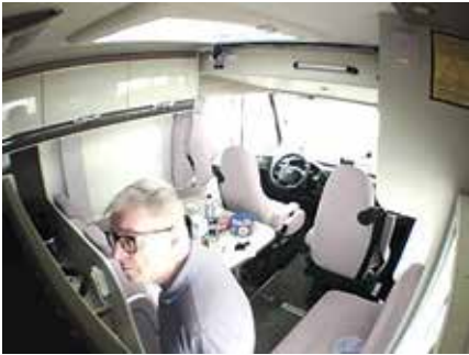
Kameralla varustettu liiketunnistin välittää kuvan hälytyksen aiheuttajasta.

meen kuvat hälytyksen aiheuttajasta. Sireenejä on valittavissa kaksi: sisä- tai ulkosireeni, joiden äänitasoa voi säätää kolmeen eri tasoon.