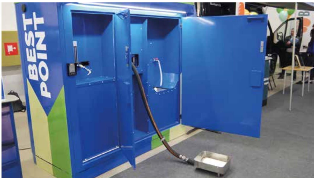
Uusi BestPoint -huoltopiste hoitaa kemsan ja harmaaveden tyhjennyksen sekä raikkaan veden täytön.

BestPoint huoltopisteellä käynnin voi varata ja maksaa BestParkin varausjärjestelmän kautta verkossa tai mobiilissa ja palvelut saa käyttöön koodin avulla. BestPointin avulla voi perustaa muutamallekin parkkipaikalle pienen BestParkin ”Easy” -matkaparkin.