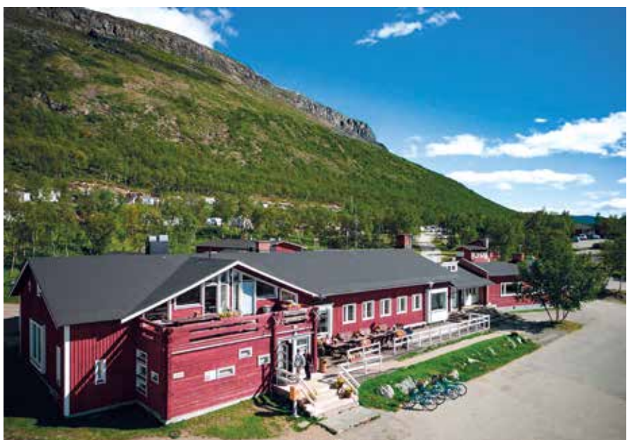
Saanalle nousu ei ollutkaan niin helppo tehtävä kuin olin kuvitellut. Varsinainen karavaanarialue on päärakennuksen takana tunturin juurella.

Seuraavana aamuna aika huonosti nukutun yön jälkeen jatkoimme matkaa jo klo 5.30 jälkeen. Mies kyllä nukkui hyvin, mutta minä vielä tottumattomana auton ääniin ja viereisen tien rekkojen huminaan en osannut nukkua. Siispä kohti Saanaa ja Kilpisjärveä.