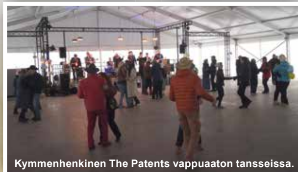
Kymmenhenkinen The Patents vappuaaton tansseissa.