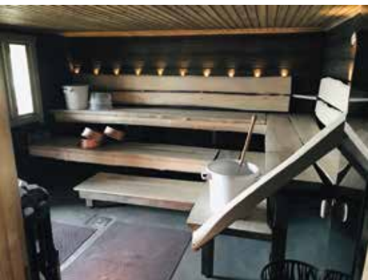
Arctic Campingilla Pellossa ”pojatin” pääsivät saunomaan. (Kuva Arctic Camping).

Tämä tuntui uskomattoman hyvältä näin etelä-suomalaisesta, joka ei saa viedä 3 kg painavaa sylikoiraa edes ravintolan terassille omalla paikkakunnalla etelässä! Meillä kun on tapana, että koiria ei jätetä koskaan autoon yksin. Näin saatiin aloittaa miehen kanssa saunoen jokivarressa Lapin seikkailumme yhdessä eikä erikseen. Tästä olen edelleen tuolle isännälle kiitollinen.