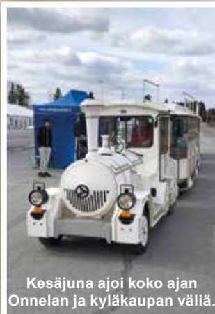
Kesäjuna ajoi koko ajan Onnelan ja kyläkaupan väliä.