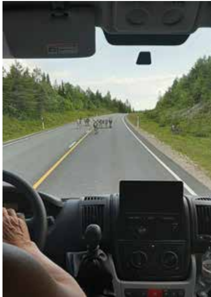
Poroja tiellä. Nyt ollaan Lapissa!

huolellisesti mahdollisimman kaukana vedestä ja mielellään tuuliselta paikalta. Käytännössä siis pysähdys oli aika nopea muina kertoina.