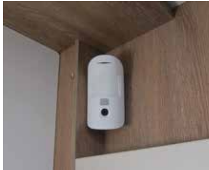
Liiketunnistin kameralla oven matkustamon oven yläkulmassa.

Laitteen keskusyksikköön tarvitaan puhelin- ja nettiyhteys. Puhelinoperaattoreilta on saatavissa edullisia laitenettiliittymiä . Esimerkiksi Elisa tarjoaa laitettiliittymää 3,99 euron kuukausimaksulla. Hintaan sisältyy 3 Gt tiedonsiirtoa ulkomailla. Tarkista liittymää