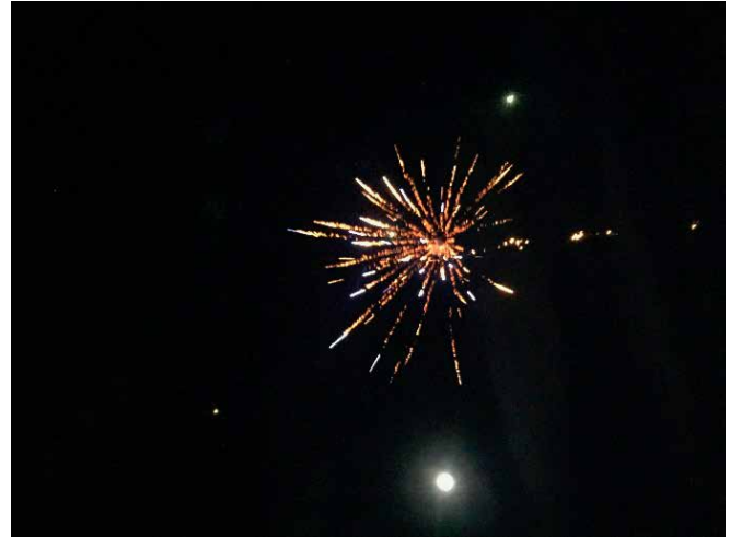
4th of July ilotulitteita kodin takapihalta!