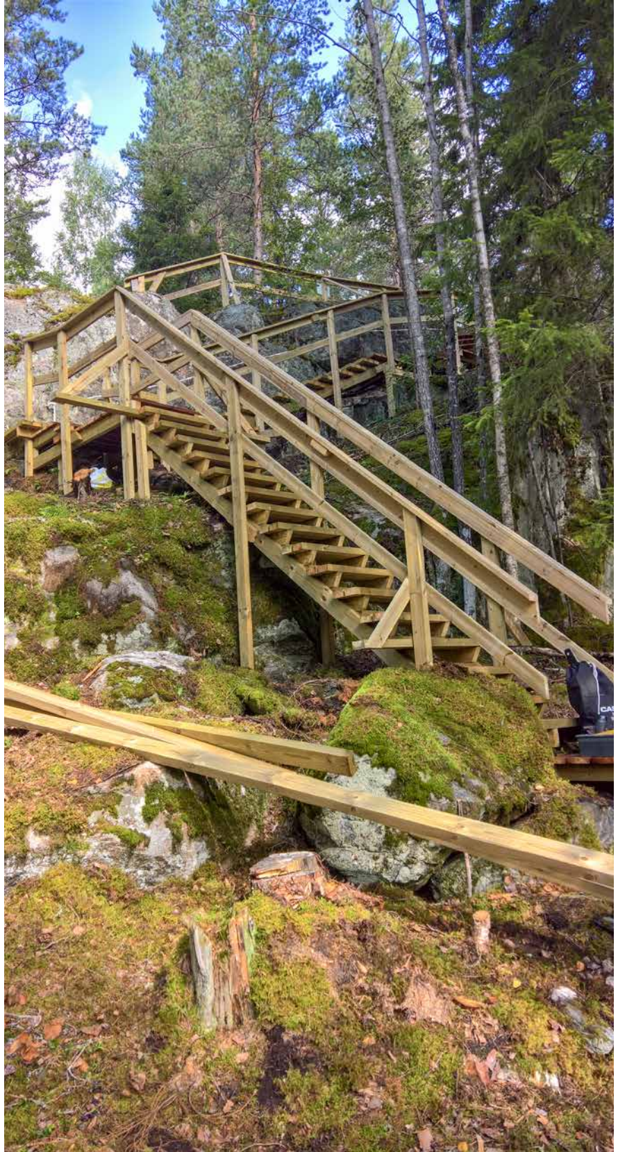
Korkeuseroa eri väylillä on huimat 44 metriä. Siirtymien helpottamiseksi on radalle rakennettu portaita, joissa on yhteensä 170 rappusta.

– Hienoa, että olemme tässä vaiheessa. Nyt on tarjolla urheilu- ja liikuntahenkisille hieno ja sinänsä halpa harrastus, johon on helppo päästä mukaan. Yhdelle kierrokselle kertyy mittaa likemmäs neljä kilometriä, ja jos se ei riitä vielä liikkumisen tarpeisiin, jäädyttelylenkin voi ottaa viereisellä Uotsolan kuntoradalla, toteaa Esa Piippo.