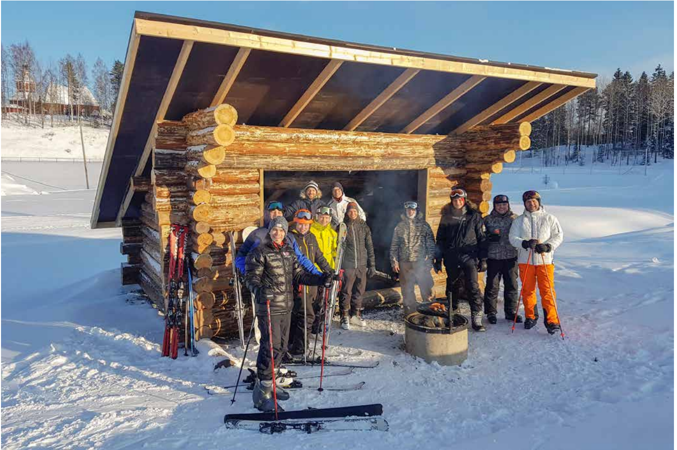
Polttariporukka Vaasasta laavulla hilpeällä mielellä, taustalla Virtain kirkko