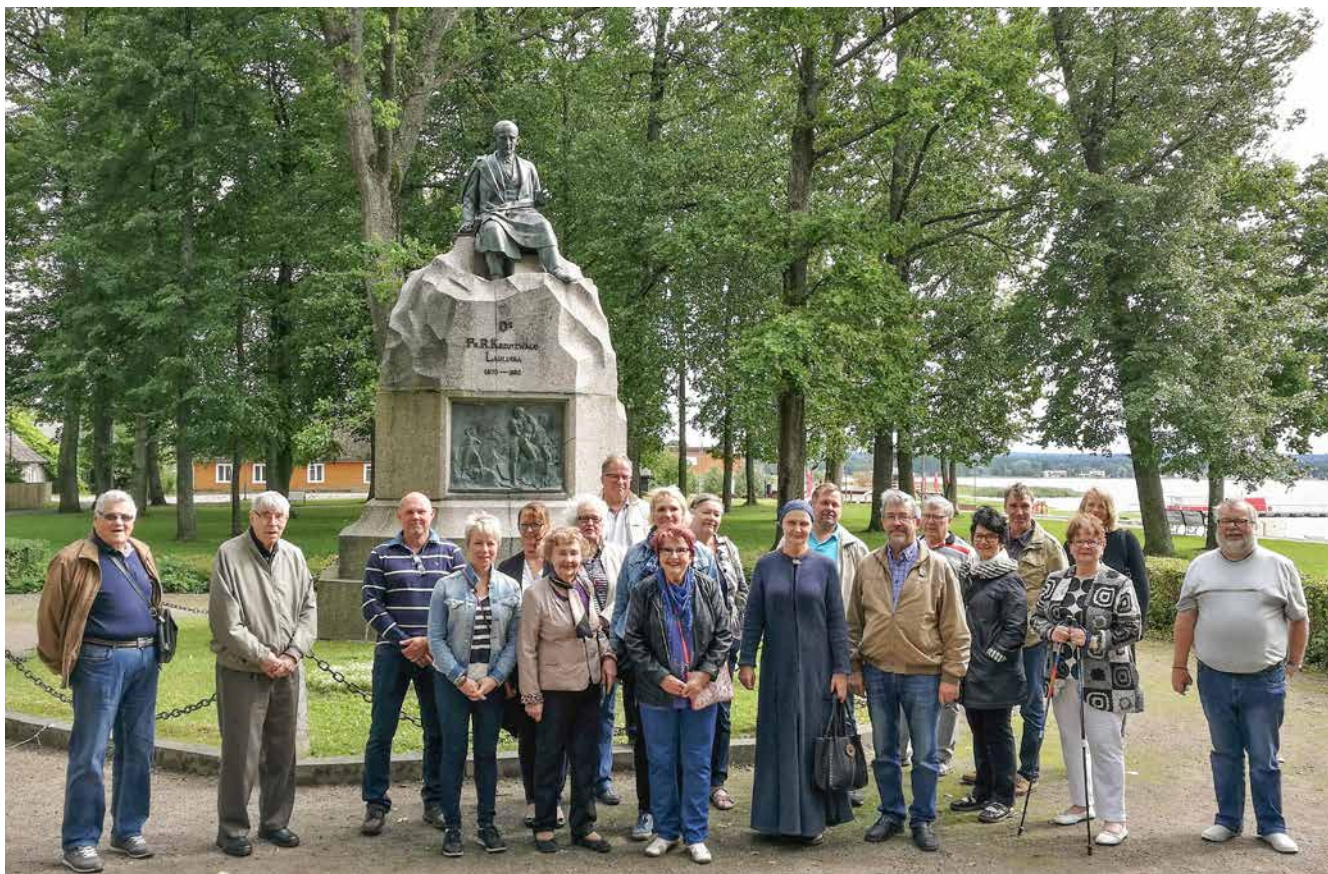
Yhteiskuva F.R. Kreutzwaldin muistomerkillä

R uoveden Lionsit ladyineen tekivät jo viidennen vuosittaisen matkan etelänaapuriiimme Viroon elokuussa 2017 (aikaisemmat matkat: 2013 Otepää, 2014 Saaren-