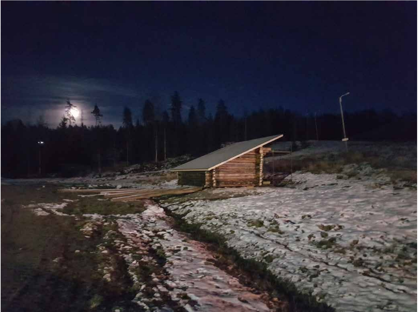
Valaistut maastohiihtoladut lähtevät laavulta Löytyjärvelle ja takaisin

LC Virrat/Torisevan jäsenet veistivät ja rakensivat uuden laavun Pukkivuoren laskettelurinteen alarinteesen maastohiihtoladun varteen jäähallin ja urheilukentän läheisyyteen. Paikalla on myös frisbeegolfrata.