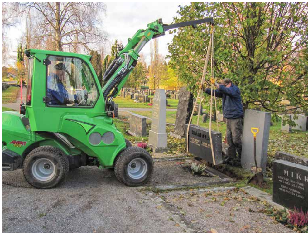
Oikaistaan vielä tämä, niin 2017:n urakka on pulkassa.