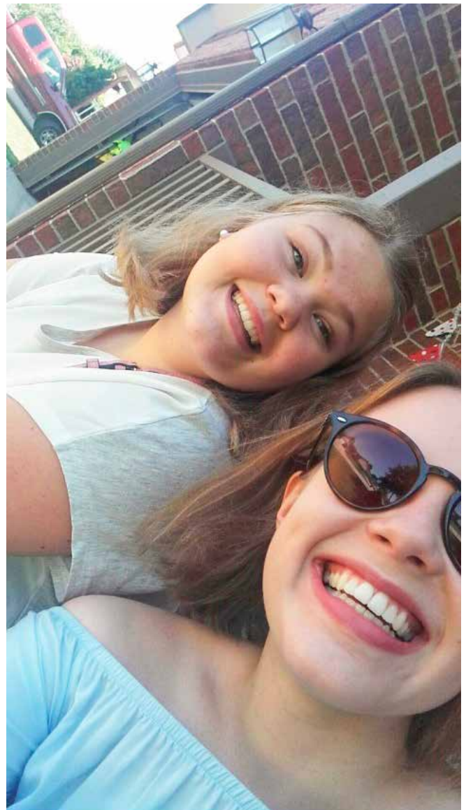
Ellenin kanssa lähdössä tapaamaan muita nuoria nuorisokahvilaan Augustassa.

Itsenäisyyspäivän juhlat olivat kovin erilaiset kuin meillä täällä Suomessa. Katselin huuli pyöreänä sitä iltatulleiden sekä oheisen ”säätavaran” määrää. Ennen lähtöä olin hymähdellyt Suomi100 -tarralla koristettuja leipäpusseja sekä juustopaketteja, mutta kotiin tultuani olin tyytyväinen väritettyihin leipäpusseihin värikkäiden leipien sijasta. Toin kotiin