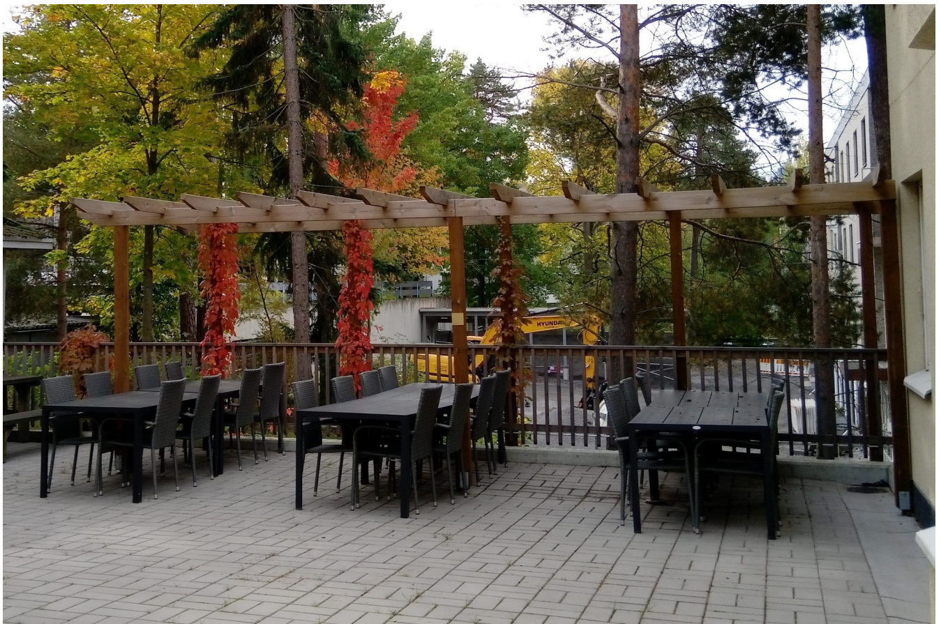
KUVA 1 ja KUVA 2