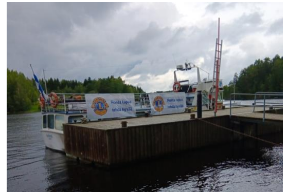
Kuva 1 MS Nottbeck Ravintola Maisan laiturissa.