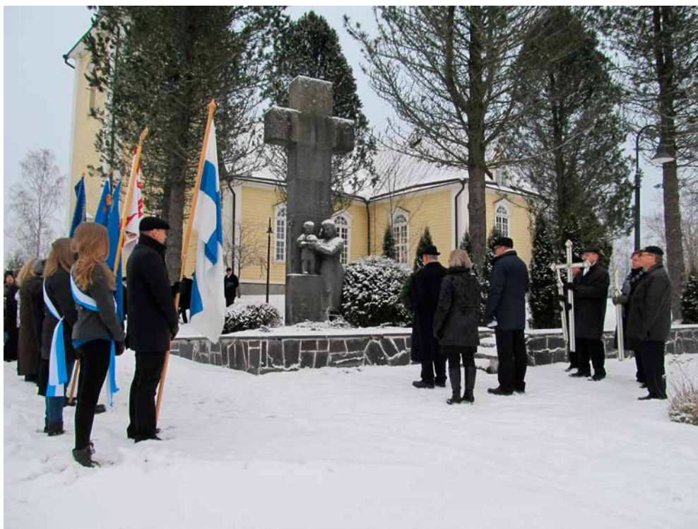
Seppeleenlasku sankaribaudalla, jonne kirkosta siirryttiin risti- ja lippukulkueen johdattamana.

Risti- ja lippukulkue otettiin kirkossa vastaan seisten