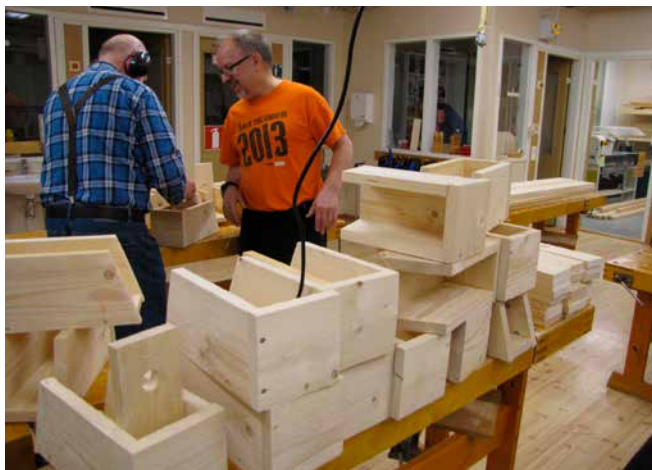
Lähes valmiit tuotteet

maan aikaan MILJOONA PÖNTTÖÄ- tapahtuma laajalla mittakaavalla ( http://yle.fi/aihe/miljoona-linnunpontoa ). Ilmoitimme siis tehdyt ja asennetut pönttöt ko. kisaan mukaan. Tätä kirjoitettaessa (22.1.2017) pönttöjä on jo 862 276 kappaletta!