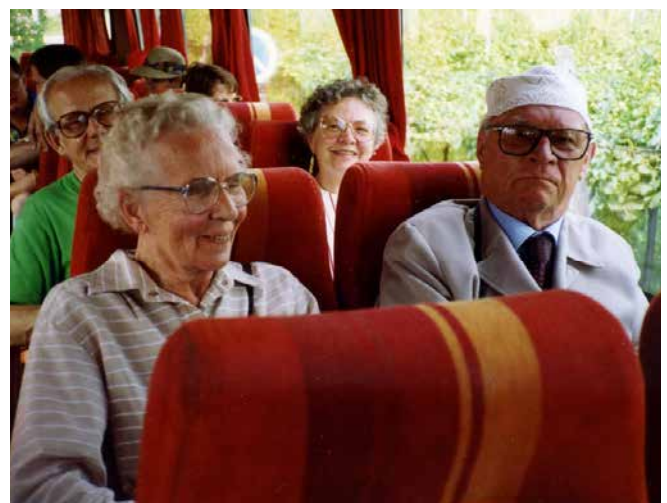
Kuva Garda-järven matkalta kesällä 1992. Salvenit edessä ja Voipiot.

Tammerkoski Klubimme säännöissä mainitaan, että tarkoituksena on luoda hyvä toveruus eri ammattiryhmistä olevien jäsenten keskuuteen. Sekä harjoittaa aktiivisesti yleishyödyllistä toimintaa. Olemme 60-vuotisen toimintamme aikana pyrkinneet noudattamaan näitä periaatteita.