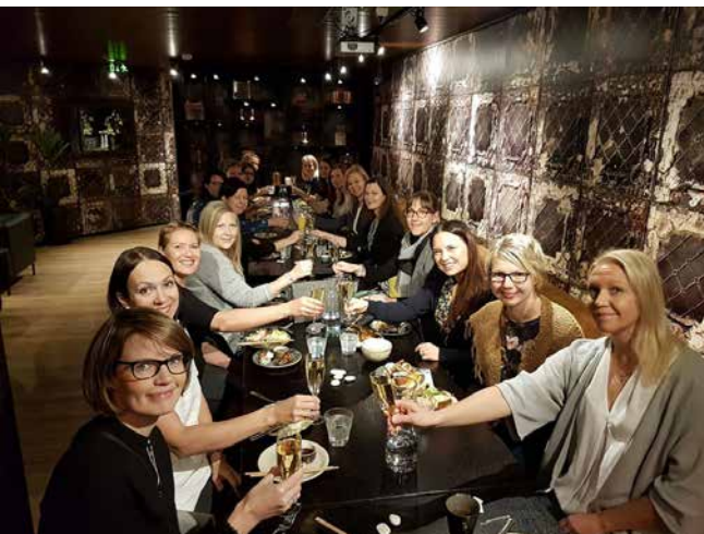
LC Diamonds vuosijuhlaibrunssi.

klubi, Lions Club Tampere Diamonds ry. Hyväntekeväisyystoiminnan lisäksi klubin tavoitteena on aina ollut nuorten naisten verkostoitumisen edistäminen sekä yh-