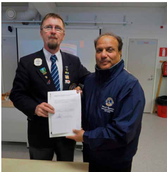
Kuhmon KVN:n yhteydessä sain luovuttaa varapresidentti Aggarwalille yhteispohjoismaisen adressin lasten turvallisuuden puolesta.