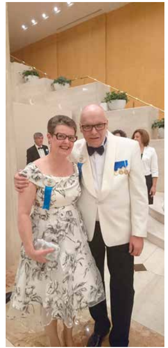
6. Seminaarin päätösjuhlan jälkeen.

Lauantaina sitten heti aamusta taas junaan ja sama reitti päinvastoin takaisin Fukuokaan, jonne saavuimme alkuillasta. Hotellimme oli tällä kertaa Ten-Jinin puolella. Lähdimme etsimään illallisarvintolaa ja olihan niitä hienoja ”Dinner”-kylttejä joka paikassa. Ruokalistaa ei kylläkään mistään englanniksi löytynyt, ei edes kuvia, että