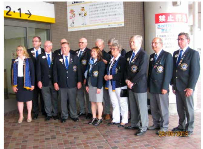
8. Uudet DG:t nyt jo naurattaa.

mitähän tämä tai tuo mahtaa olla. Lopulta tulimme erään nepalilaisen ravintolan ovelle. Omistaja – hänkin nepalilainen – tuli ovelle ja pahoit-