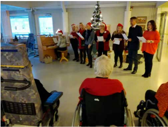
kuva Maritta Moisio, teksti Elina Pusa Lions Club Ylöjärvi /Helmi

M arraskuun lopulla Lions Club Ylöjärvi Helmen naiset pistivät pystyyn jälleen piparitalkoot. Tämä oli jo kolmas vuosi, kun käärimme hihamme ja kaivoimme piparimuotit esiin. Kaneli ja inkivääri tuoksuivat ja jauhot vaan pölylsivät, kun taioimme piparitaikinasta jouluisia herkkuja. Kaunis sokerikuorute viimeisteli niin muumit, porot kuin sydämetkin suorastaan syötävän herkullisiksi.