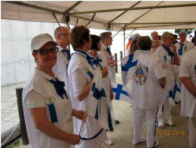
9. Marssille valmistautuminen.

teli, että hänellä ei ole kuin englanninkielinen ruokalista. Sinne ja äkkiä! Nepalilainen ruoka on maukasta, mutta ei niin voimakasta kuin intialainen. Ja oluen ystäville tie-