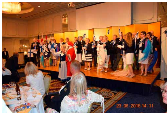
3. Get to Gether Japanin jenkka.