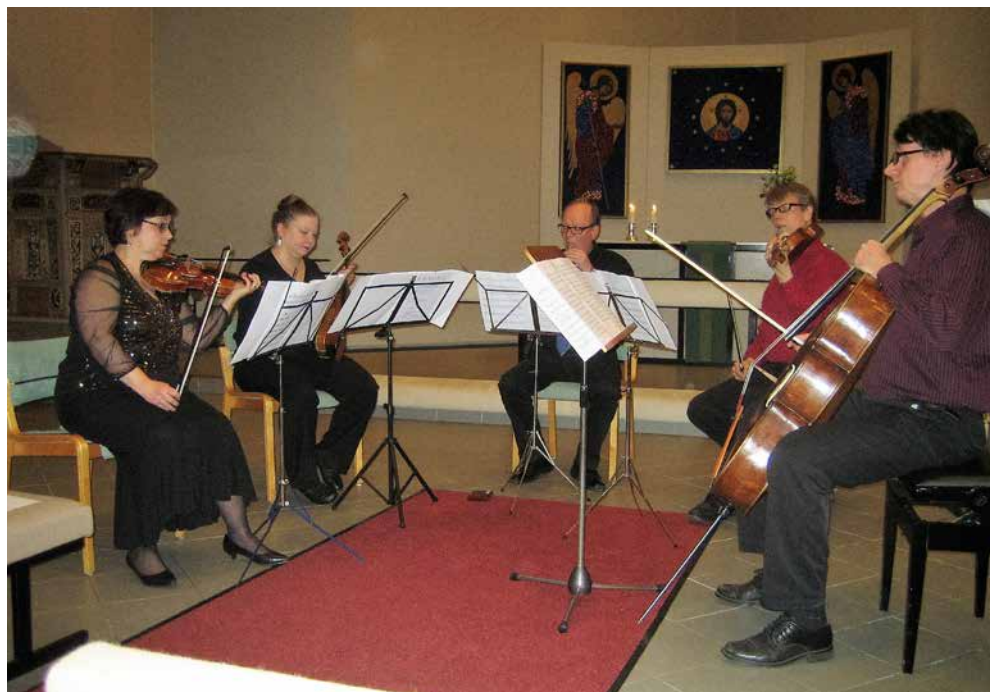
Tampereen Filharmonian soittajat, paikka Pispalan kirkko, vuosi 2017 tammikuu