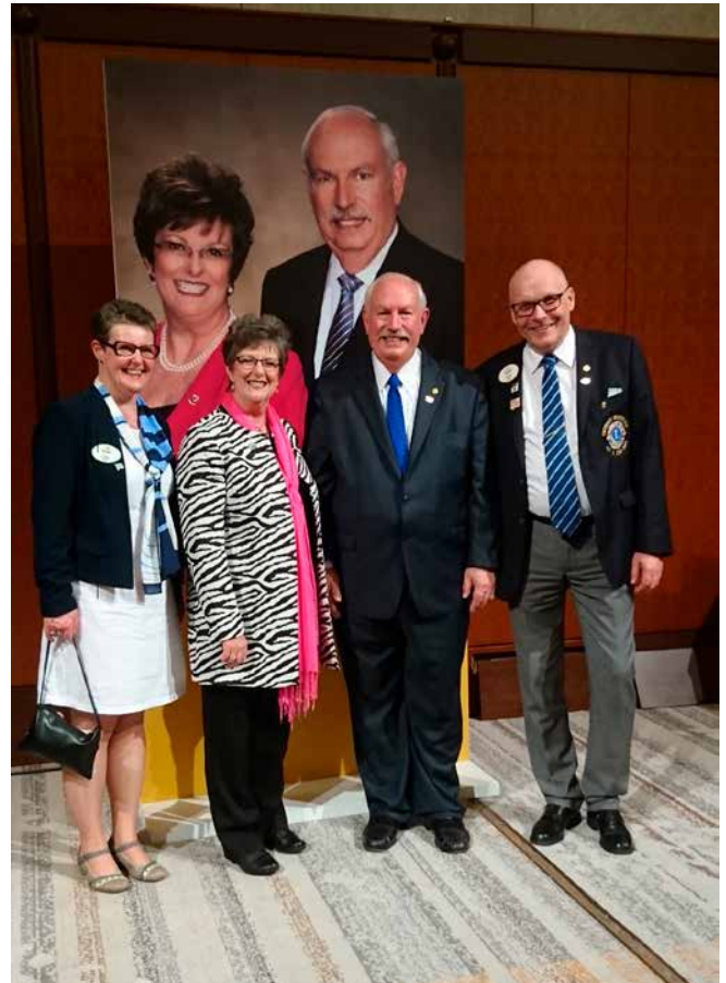
10. Päätösillallisella Corlewien kanssa.

terrail –sukupolvea, sen veran rankka myös lomasta tuli. Jälkiviisaana onkin helppo todeta, että nyt suunnittelisimme lomamme niin, että Fukuokasta kolmeksi yöksi Kiotoon ja sieltä takaisin. Ehtisi nähdä sen parhaan kohteen paremmin.