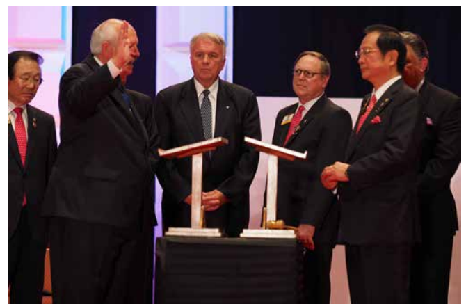
7. Corlewin vala.