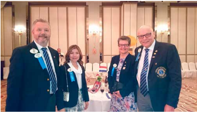
4. Hollannin vastaanotot suomalaiset.