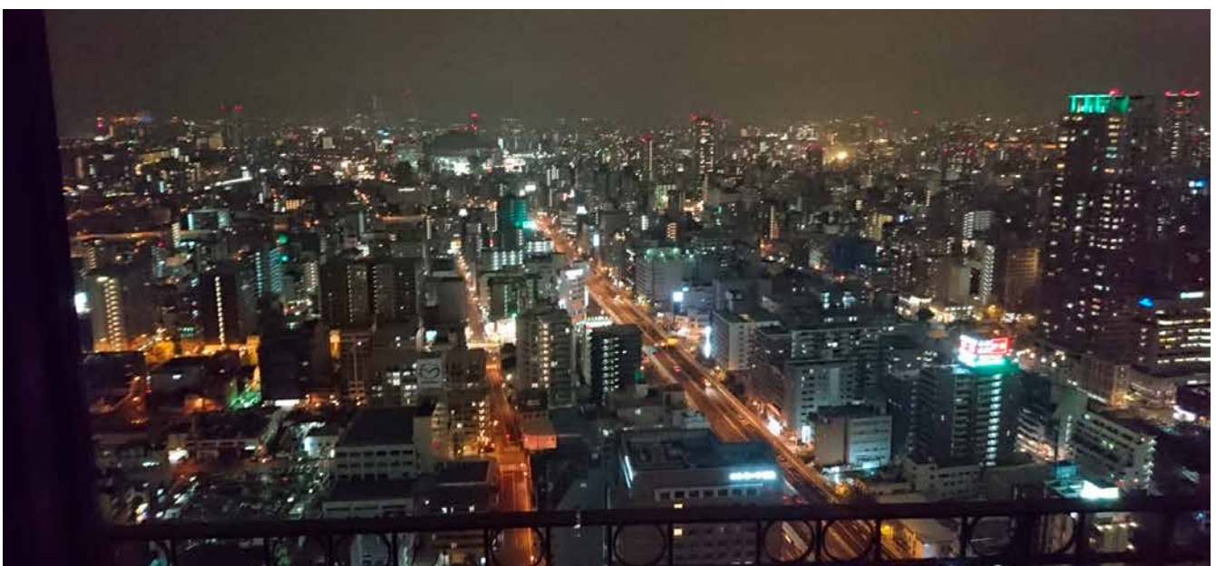
12. Osakan yöstä.

Sunnuntaina oli aikainen herätys, kansainväliselle lentokentälle josta sinivalkoisin siivin kotiin. Turengin kohdalla oli sitten varikkostoppi Linnatuuleen ja tummalle leivälle tehty sillimunavoileipä kunnan kahvin kanssa. Ai ai, että se oli hyvää!