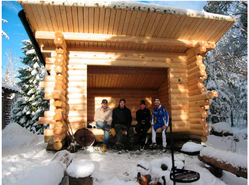
Komea ja ylväs talkootulos

Jälleenrakennustyön suunnittelu, kustannuslaskenta ja rahoitusselvitystyö alkoi heti. Aluksi hiiltynyt runko oli purettava, sahattava haloiksi ja paikka muutenkin siivottava. Paras apu oli naapurapu. Pinsiö-Seuran raa-