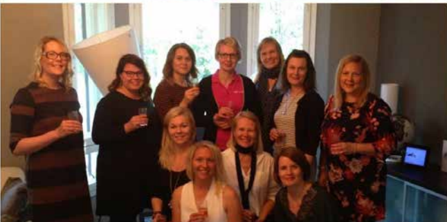
LC diamonds kauden aloitus.

Idea lähti 9 vuotta sitten – mitä jos perustettaisiin nuorten naisten oma lionsklubi. Niin Tampereella perustettiin huhtikuussa 2008 Suomen tuhannes Lions-