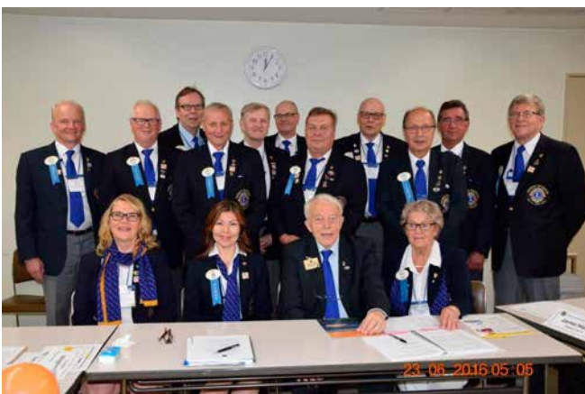
5. Suomen elektit.