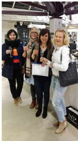
LC Diamonds Ostosilta.