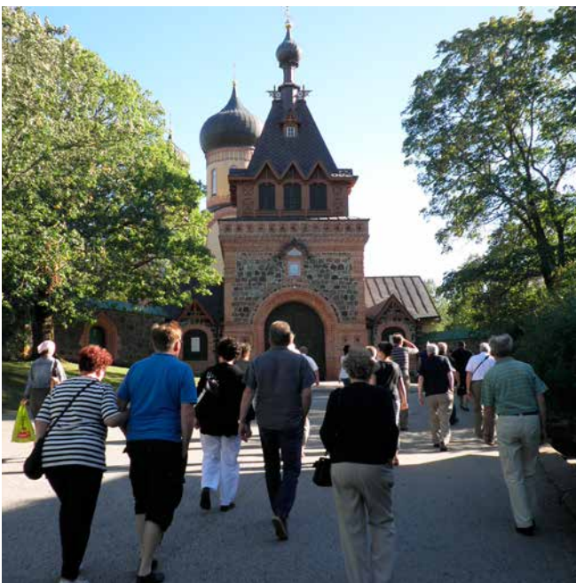
Retkikuntaamme Pyhtitsan luostariin menossa