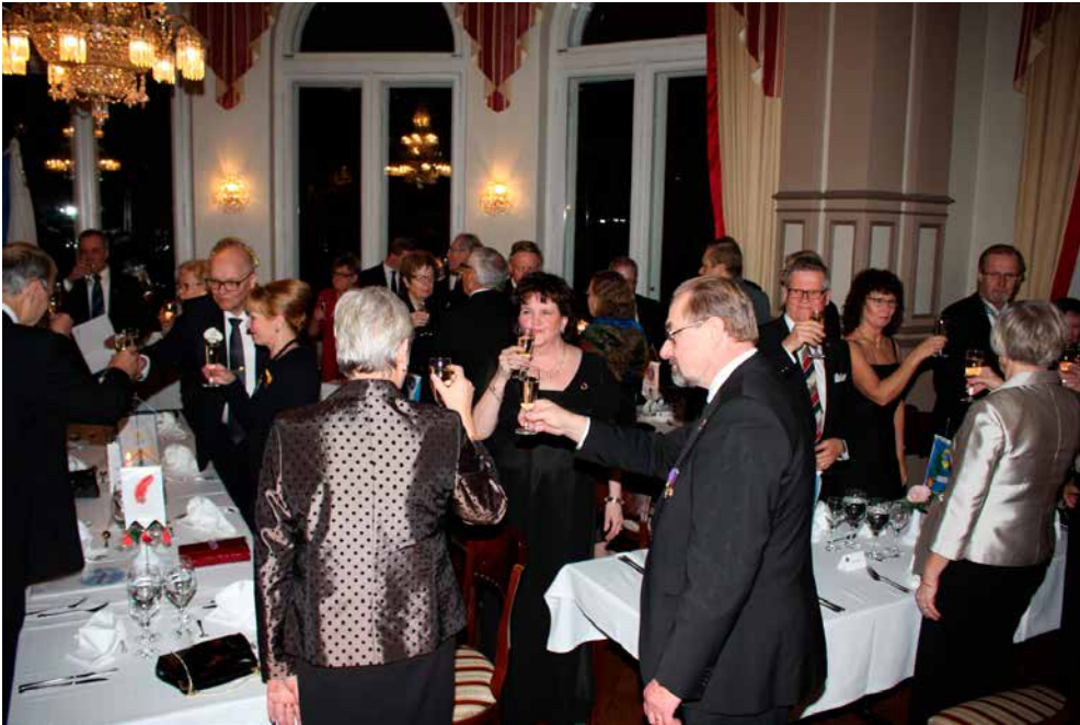
Onnittelumaljat 40 vuotta toimineelle klubille nostettiin 22.10.2016.