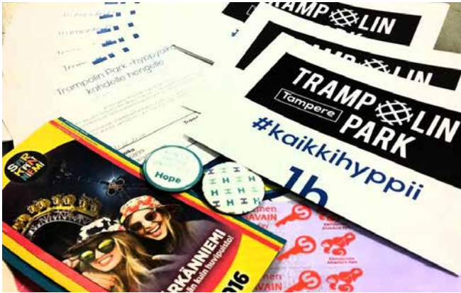
LC Diamonds:n lahjoitukset kesälomalaisille.

Kulttuurituottaja Maija Köntti liittyi klubiin syksyllä 2015 ja toimii Diamondsin hallituksessa sihteerinä. - Hakeuduin mukaan lions-toimintaan, koska halusin olla osaltani mukana tekemässä muille hyvää. Kulttuurituottajataustani puolesta esimerkiksi erilaisten hyväntekeväisyystapahtumien järjestäminen mahdollistaa oman osaamisen hyödyntämisen, mutta tuo samalla mukavaa vastapainoa työlle, Maija Köntti kertoo.