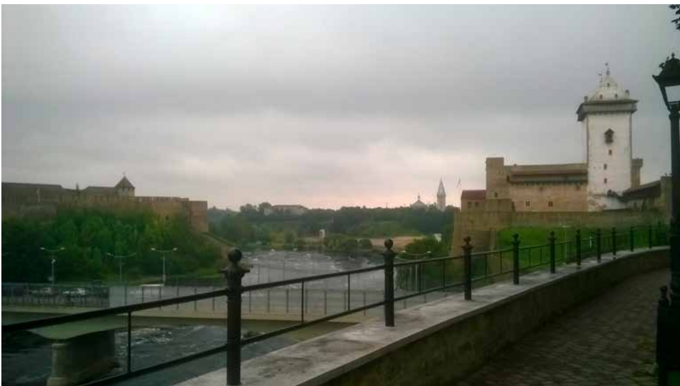
Idän ja lännen vanhat vartijat vastakkain, Iivananlinna ja Narvanlinna.

Toisenlaista kauneutta päästiin ihailemaan niin sa-