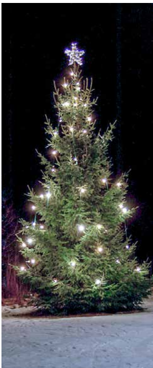
Kuusi Juupajoen torilla.