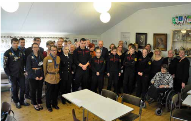
LC Lempäälän- sekä vierailijoiden puoliset kukitettuina.