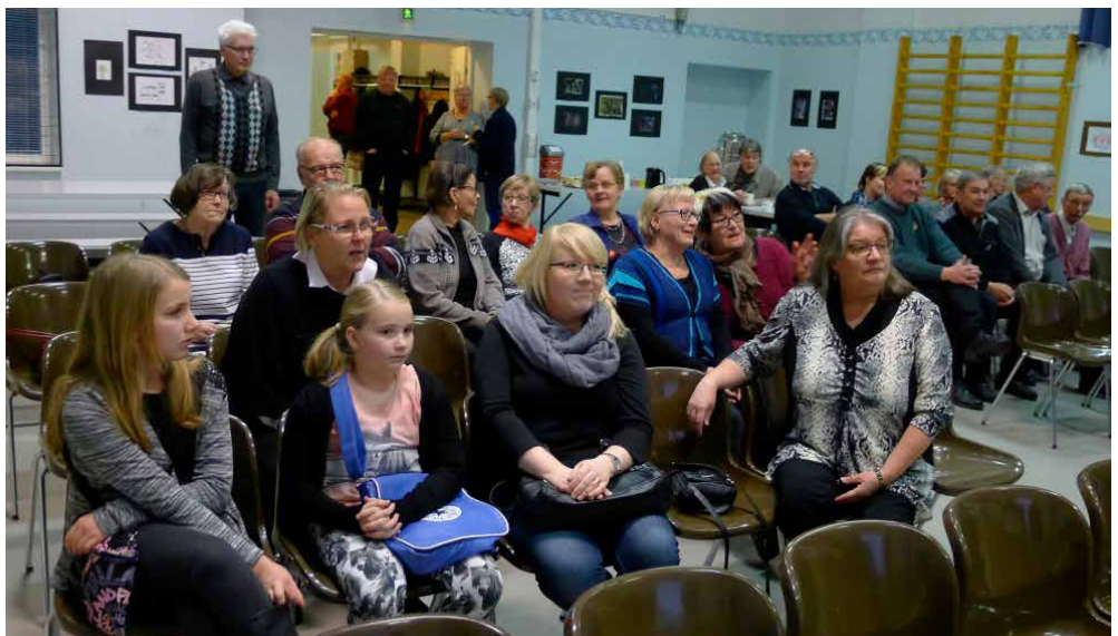
Leppoisaa rupattelua ja kahvittelua musiikin kera ennen videosesityksiä.