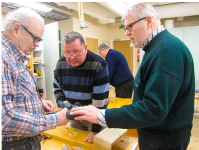
Työkoneiden jakoa ja vertailua