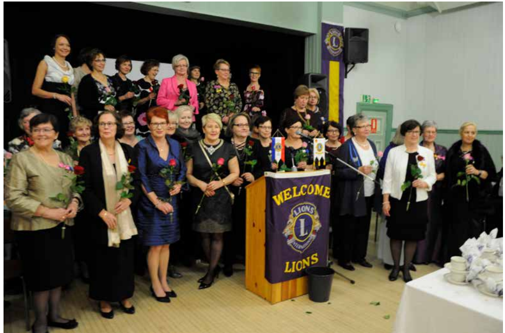
Lahjoitusten saajat yhteiskuvassa