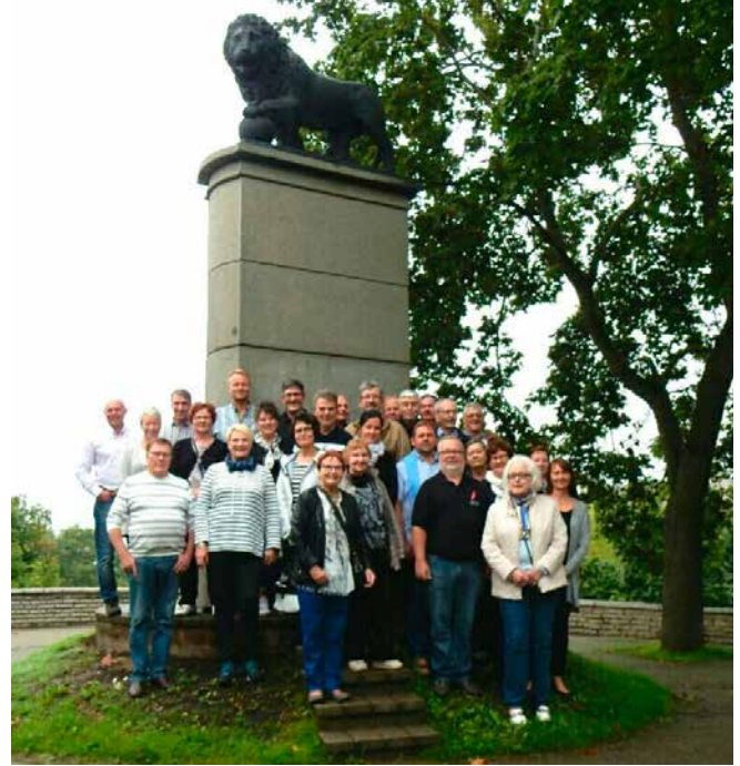
Ruoveden leijonat ja ladyt Ruotsin leijonan, Kaarle II:n, muistomerkillä.

Suomalaistenkin merkittävä osuus Narvan historiassa tuli oppaan toimesta kuultua ja nähtyä. Suomalaiset olivat olleet isolla joukolla rakentamassa Narvanlinnaa ja tietenkin sotimassa muun muassa Kaarle XII:n joukoissa Narvan taistelussa vuonna 1700. Viron vapaustaistelussa Ekströmin pataljoonaksi kutsuttu vain 600-miehinen suomalainen osasto valloitti