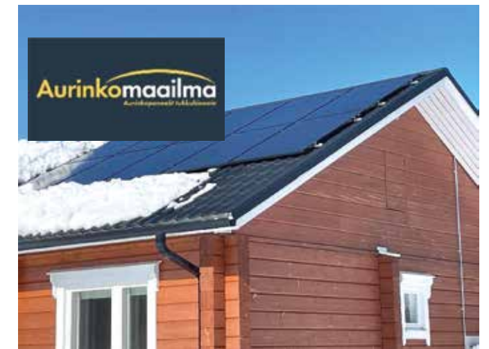
www.aurinkomaailma.fi on Haukiputaalainen aurinkopaneelien myynti- ja asennusliike jo lähes 1000 aurinkosähköjärjestelmän kokemuksella.

Jos 8-paneelin vuosituottoarvio suoraan etelään olevalla lappeella Oulun korkeudella on noin 2900 kWh niin 16-paneelilla samalla katolla olisi noin 5800 kWh. ●