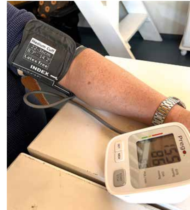
Kotona itse tehdyt verenpaineen mittaukset ovat luotettavin tapa saada selville oma verenpainetaso. Mittauksia tehdään vähintään neljänä peräkkäisenä päivänä.

Kohonnut verenpaine. Käypä hoito -suositus. Suomalaisen Lääkäriseuran Duodecimin ja Suomen Verenpaineyhdistys ry:n asettama työryhmä. Helsinki: Suomalainen Lääkäriseura Duodecim, 2020 (viitattu 15.4.2024). Saatavilla internetissä: www.kaypahoito.fi