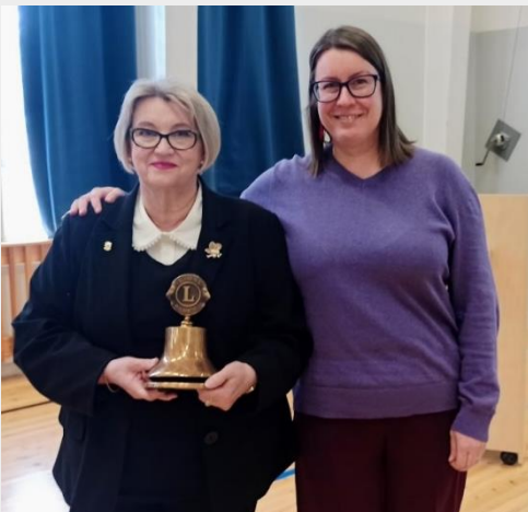
Vuoden viestintäpalkinnon sai LC Oulu/Kuivasjärvi.