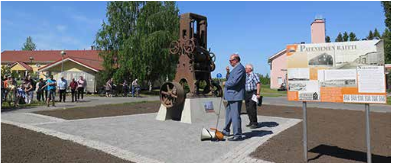
Pateniemen sahamuseon vierestä voi bongata Pateniemi-Seuran viime kesänä pystyttämän sahan muistomerkin ja kulkea Pateniemen Raittia, jolta löytyy 13 alueen historiaa käsittelevää opastetaulua. Kuva muistomerkin avajaisista 17.6.2023.