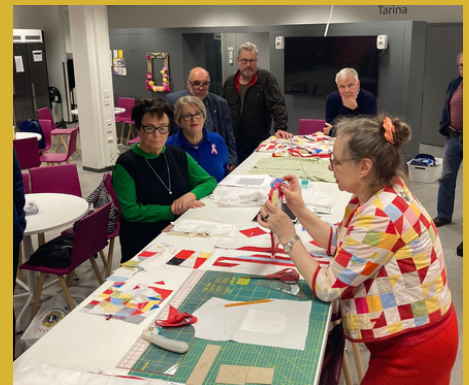
Kuva 1. alueen tapaamisesta

LION -LEHTI NUMERO 4/2023 JA SEN MUKANA LIONS - INFO 2023/24 OVAT ILMESTYNEET. MOLEMMISSA MIELENKIINTOISIA JUTTUJA, KLUBIEN KUULUMISIA, TÄRKEÄÄ INFOA LIONSTOIMINNASTA JA ESIMERKIKSI OHJEITA PRESIDENTILLE, SIHTEERILLE JA RAHASTONHOITAJALLE. WWW.LIONS.FI/LIONLEHTI .