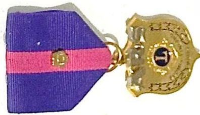
YHDEK RUUSUKKEEN ARS ANSIOMITALI