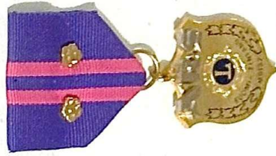
KAHDEN RUUSUKKEEN ARS ANSIOMITALI