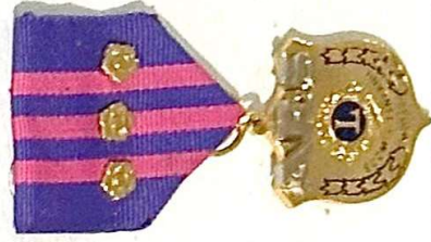
KOLMEN RUUSUKKEEN ARS ANSIOMITALI