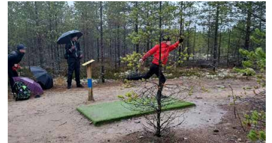
Lokakuussa pidettiin frisbeegolf-kisat yhdessä 4H-toimijoiden kanssa.