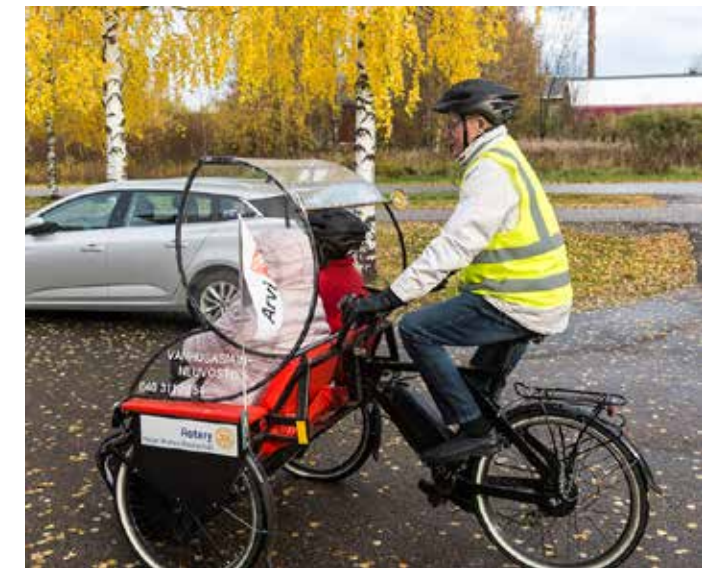
Raahelaiset tarjosivat ulkoiluapua vanhustenviikolla.