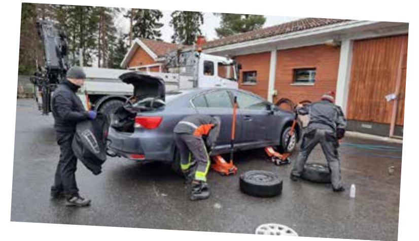
Vaalassa vaihdettiin renkaita niin syksyllä kuin keväällä.