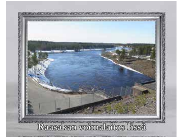
Raasakan voimalaitos Iissä