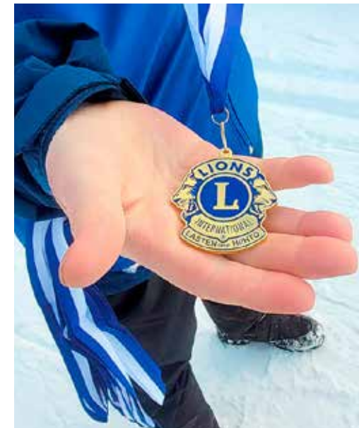
Komeat lions-mitalit ikuistettiin Kiimingin hiihtokisoissa.