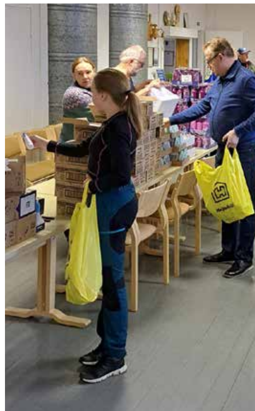
Avustuskasseja pakattiin myös Sotkamossa.