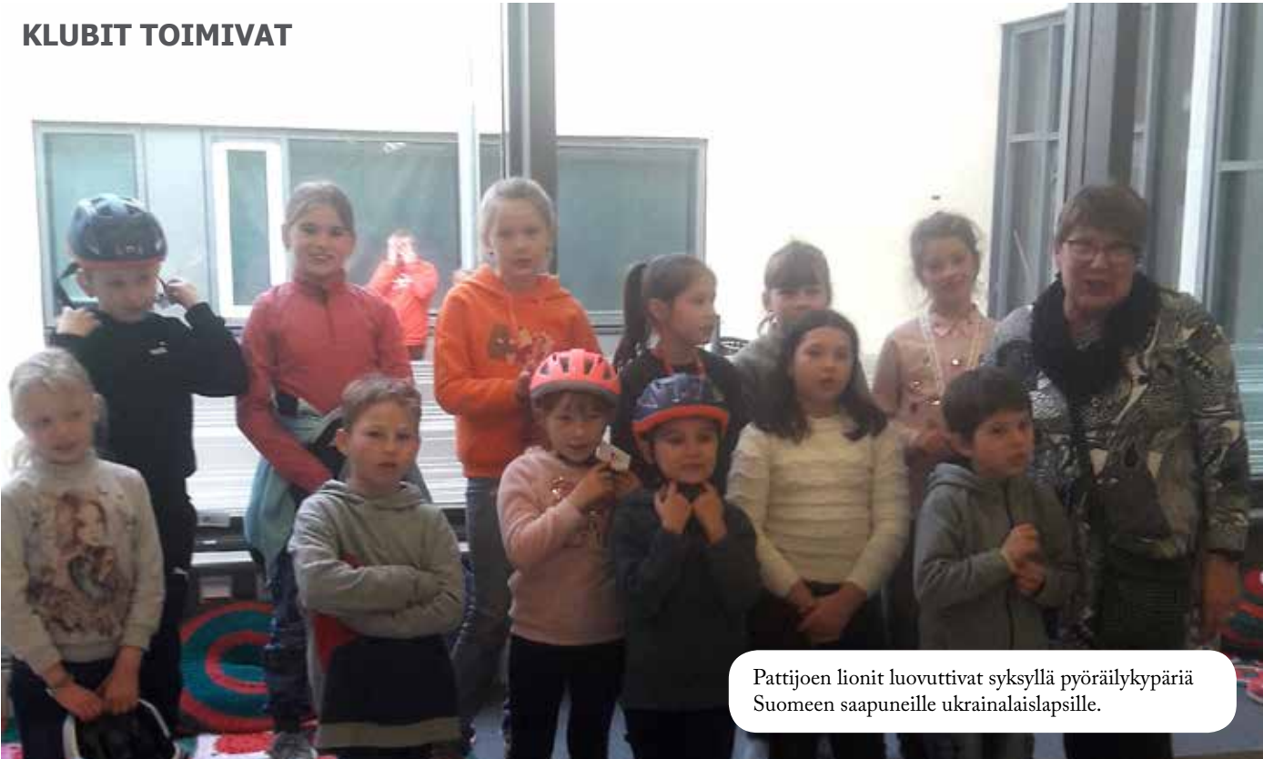
Pattijoen lionit luovuttivat syksyllä pyöräilykypäriä Suomeen saapuneille ukrainalaislapsille.