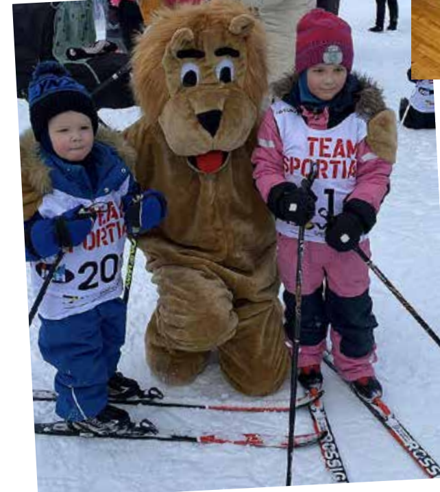
Vuokatissakin hiihdettiin kilpaa.