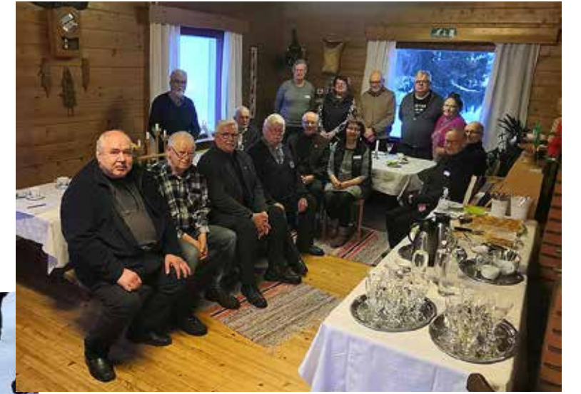
I piirin III lohko koolla Hyrynsalmella Mummulassa maaliskuussa.