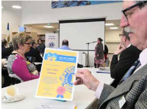
Vuosikokouksessa muistettiin Ukrainaa auttaneita klubeja päämajasta lähetetyillä kunniakirjoilla. Kuvassa LC Paltamon saama kunniakirja.