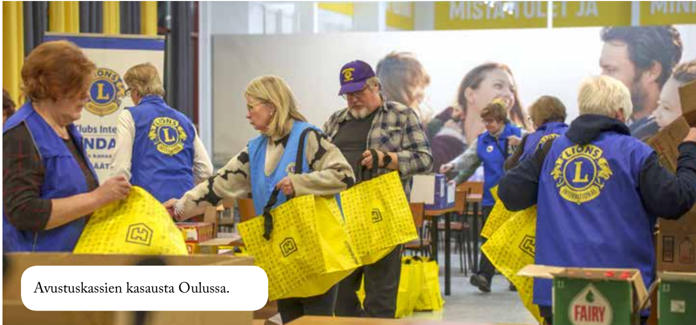
Avustuskassien kasausta Oulussa.