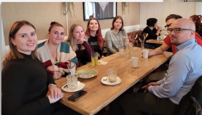
Yläkuvassa piirin johtoryhmä koolla ja viereisessä kuvassa leojen kanssa yhdessä.