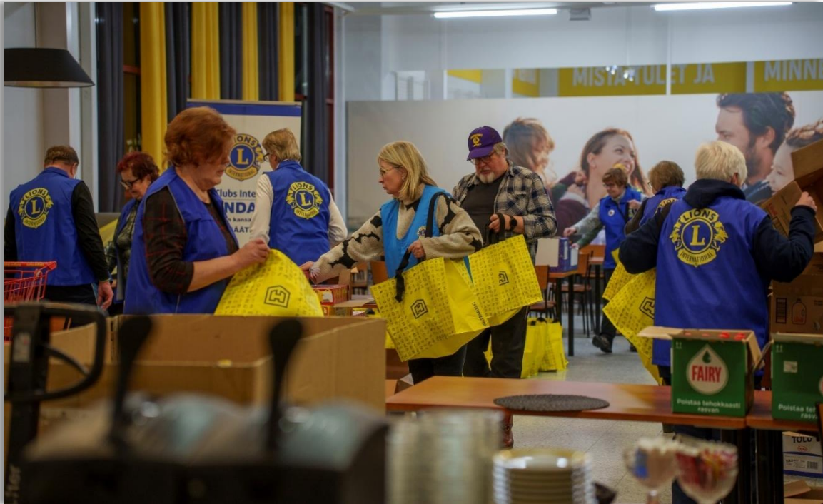
Ukraina -projektin talkoilijoita ja jaettavaa!