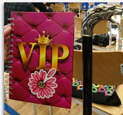
LC Pattijoelta keppi ja vihko matkasivat LC Raahe Kreiville 18.2.2023.