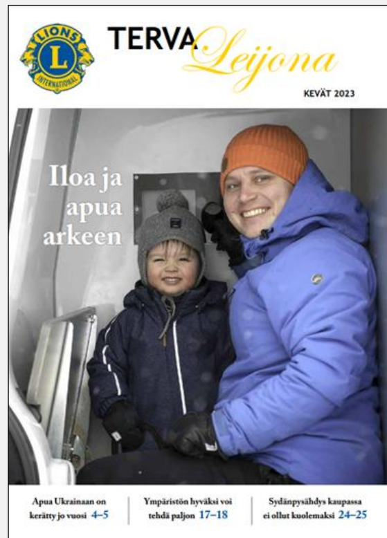
Kauden 2022-2023 Tervaleijona lehtien kansikuvat.