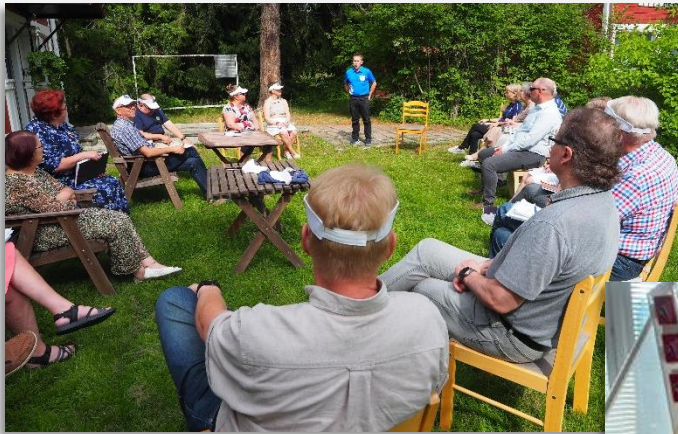
Piirihallitus koolla kesäisissä tunnelmissa

Suosimme paljon etäyhteyksillä kokoontumisia, mutta päädyin useimmiten pitämään ne fyysisinä tapaamisina kokousten keskustelemaan luonteen vuoksi. Leojen kanssa kokoustimme muutaman kerran. Piirihallituksen kokouksessa he olivat myös mukana. Mielipiteitä vaihdettiin ja autoimme heitä Auta Lasta, Auta Perhettä -aktiviteetin järjestämisessä. Aktiivisuutta yhteydenpitoon tarvitaan enempi lionien puolelta.