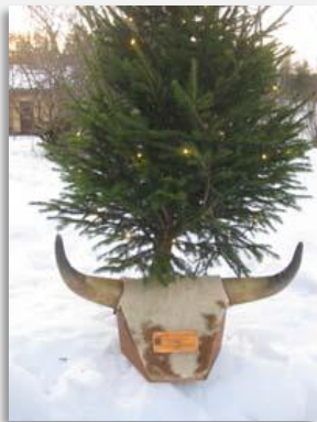
Todettu Vihannin klubin sivuilla!

Myös LC Vihannin Lautapähärkä kuin I-piirin vierailukeppikin ovat matkanneet piirissämme. Lautapähärkä oli kesän LC Siikajoen laitumilla ja siirtyi nyt LC Raahe / Kreivin huostaan, josta se on nyt ryöstettävissä. Vierailukeppi siirtyi vastaavasti LC Pyhäjoelta LC Pattijoen haltuun. Toivottavasti myös vierailukeppi pääsee taas pian reissulle!