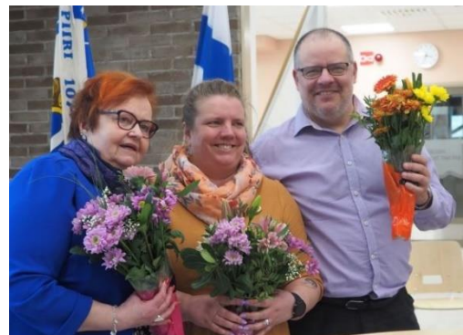
Kuva 20 Uuden kauden johtajat valittiin Kiimingissä.