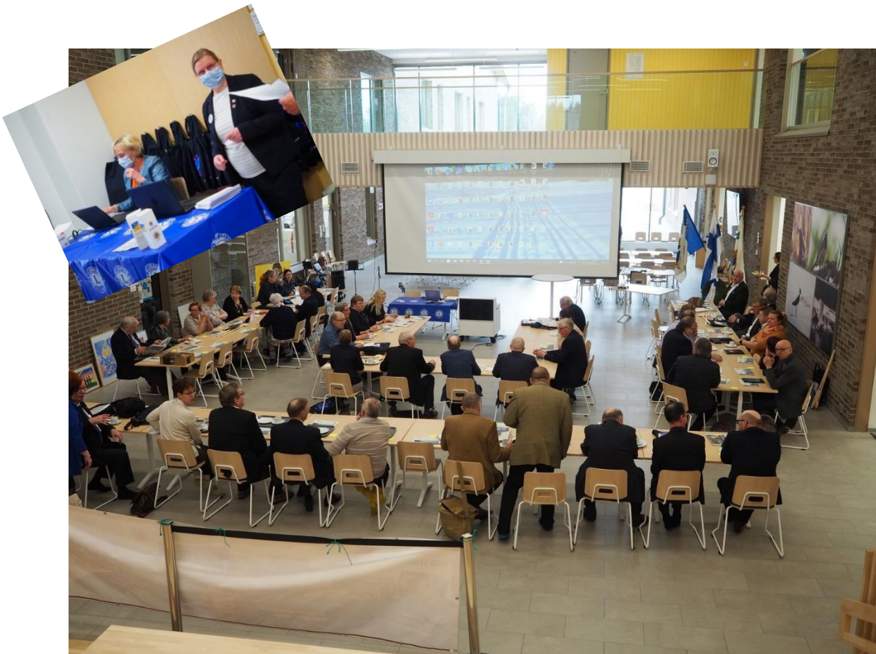
Kuva 1 Piirin vuosikokous Kiimingissä 23.4.2022