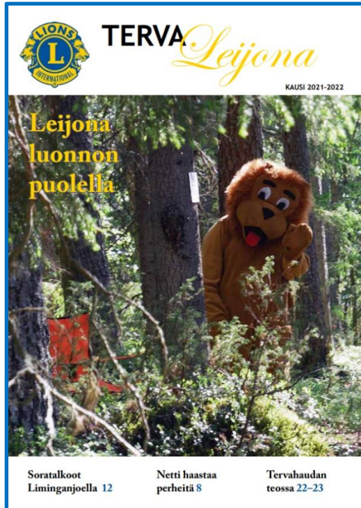
Kuva 8 Tervaleijona 1 / 2021-2022.

Piirin lehteä, Tervaleijonaa julkaisiin kauden aikana kaksi. Syyskauden lehti palveli yleisölle suunnattuna ja sitä voitiin käyttää jaettavana lehtenä monipuolisesti klubien tapahtumissa ja tilaisuuksissa sekä jäsenhankinnassa. Lehti soveltui hyvin myös klubien kumppaneille kertomaan esimerkein, mistä lionstoiminnassa on kysymys. Keväällä jaettu lehti oli suunnattu enemmän jäsenkunnan omaan sisäiseen viestintään. Lehti sisälsi laajan katsauksen klubien toiminnasta ja ajankohtaisista lionsasioista.