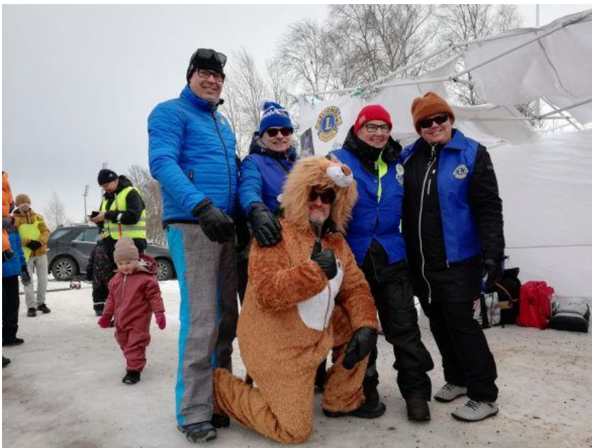
Kuva 13 I-piirinkin väkeä oli Kuusisaaren talvitapahtumassa.

Poikkeusolot vaikeuttivat massatapahtumaksi suunniteltua hiihtotapahtumaa paikoin piirin alueella. Haasteista huolimatta erinomaisia tapahtumia saatiin järjestettyä mm. Raahessa, Sotkamossa ja Oulussa. Tapahtuman järjestämiseen liittyvää yhteistyötä tehtiin paikallisten lionsklubien ja yhteystyökumppaniksi sovittujen paikallisten hiihtoseurojen kanssa. Hiihtoseuroilta saatiin tarvittavaa teknistä tukea.