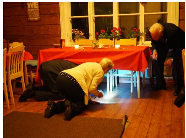
Kuva 16 Seeparissa LC Oulu/Sillat klubin rahat hukassa?