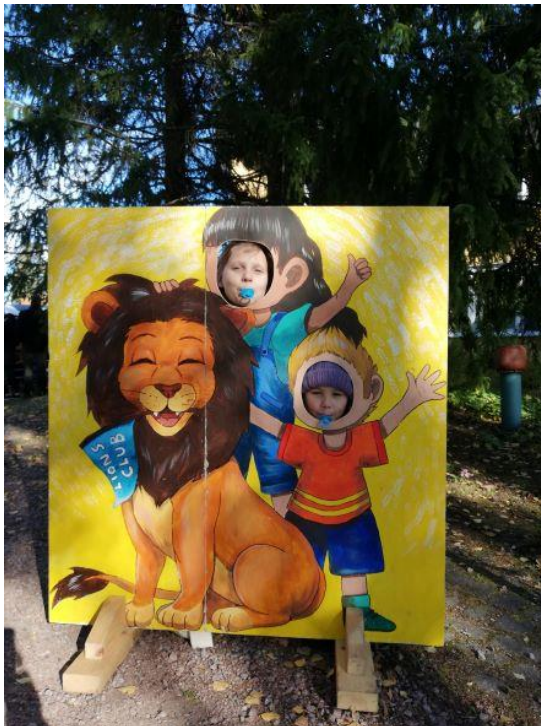
Kuva 15 Lapsia Tyrnävän perunamarkkinoilla.