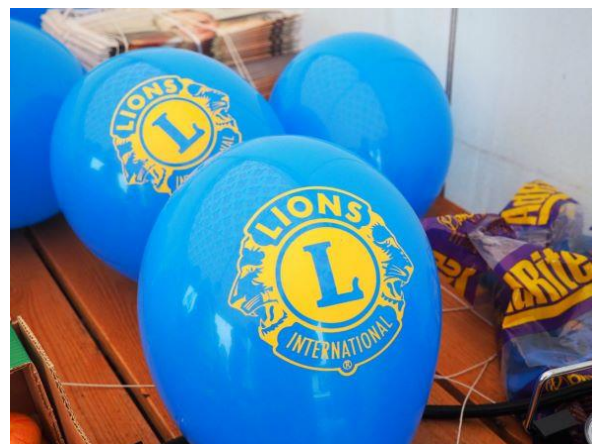
Kuva 5 Ajankohtaiset värit.