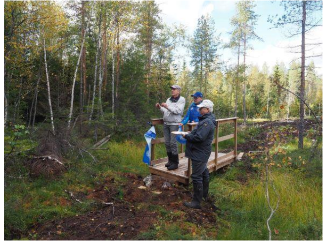
Kuva 11 Kinttupolun leijonasilta vihittiin käyttöön.