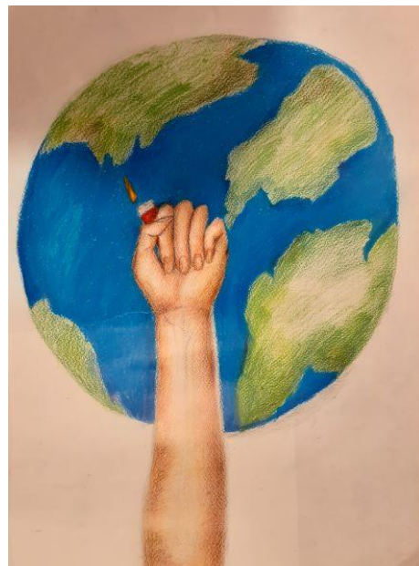
Kuva 18 Kisan toiseksi paras työ.