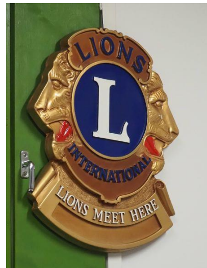
Kuva 3 Kauden teemoja: näkyvä lion.