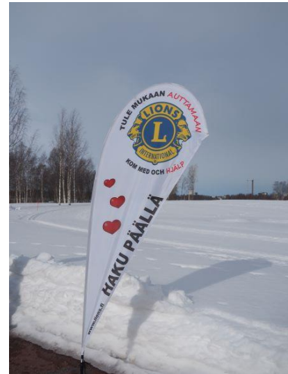
Kuva 2 Jatkuva haku!