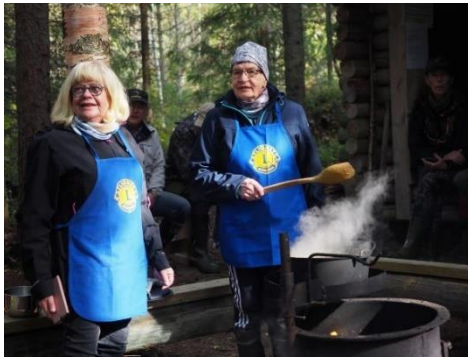
Kuva 10 Talkooväen leijonakokit.

Suomen Lions-liiton nuorisoarpajaisten tuotolla rahoitetaan mm. nuorisovaihtoa ja nuorisoleirejä. Arvat on osoitettu klubeille jäsenmäärän mukaisesti. Arpojen osto on ollut vapaaehtoista. Kouvolan vuosikokouksessa kesäkuussa 2022 päätettiin, että arpojen jakokäytäntö säilyy tulevallakin kaudella entisellään. Vaihtoehtona oli äänestyksessä hävinnyt esitys, että arvat olisi postitettu klubien sijaan viiden nipussa suoraan kaikille jäsenille.