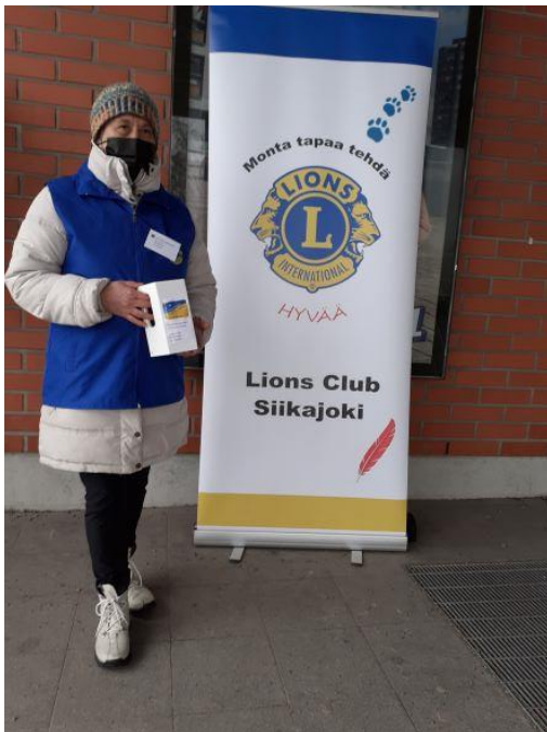
Kuva 4 Apua Ukrainan pakolaisille!

Helmikuun lopulla Venäjä aloitti hyökkäyksen naapurimaahansa Ukraina, joka aiheutti Euroopassa suurimman pakolaisten aallon sitten toisen maailmansodan. Pakolaisia tuli runsaasti myös Suomeen ja I-piirinkin alueelle. Lionsklubit olivat pandemian poikkeusoloista huolimatta heti valmiita antamaan apua. Jo ensimmäisten viikkojen aikana avun tarvitsijoille kertyi eri kanavien kautta merkittäviä lionien lahjoituksia. Kauden lopulla joidenkin Etelä-Suomen piirien esimerkin mukaisesti I-piirinkin suunnitteli hakea lionsjärjestön kansainvälisen avustussäätiöltä (LCIF) 15.000 dollarin suuruista avustusta avustuspakettien tekoon ja luovuttamiseen pakolaisille. Asian toteutus siirtyi toimintakaudelle 2022-2023.