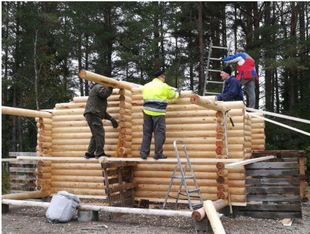
Kuva 12 Talkoissa ja yhteisessä tekemisessä syntyy ja syvenee oikea Leijonahenki.