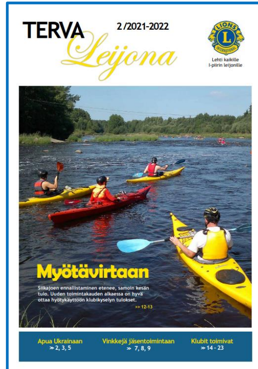
Kuva 9 Tervaleijona 2 / 2021-2022.