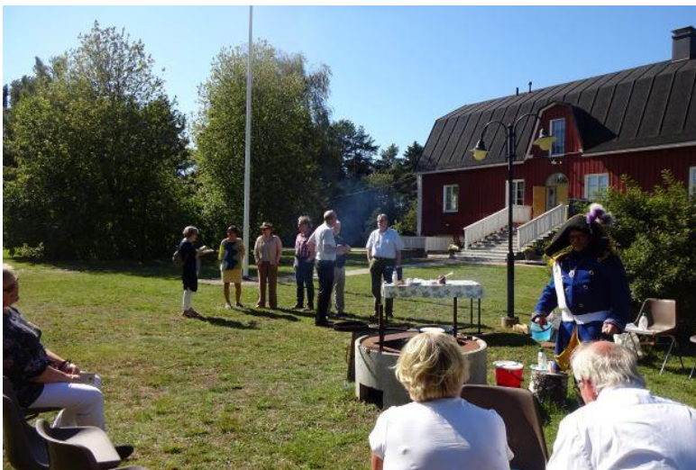
Kuva 6 Karoliinasuinen räiskälekokki Siikajoella piirihallituksen vaihtokokouksessa.