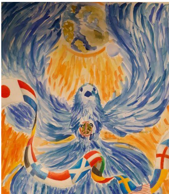
Kuva 198 Rauhanjulistekisan piirin paras työ.

Lionien kansainvälinen järjestö (LCI) on nimennyt kansainvälisiksi palvelualueiksi näkökyvyn, nälän helpottamisen, ympäristön, diabeteksen ja lapsuusajan syövän. Näitä pidettiin näkyvästi esillä myös piirin viestinnässä. Alueen klubit osallistuvat vuosittain eri painotuksin järjestön nimeämiin kansainvälisiin palvelukokonaisuuksiin. Piiri piti viestinnässä palvelualueita esillä erityisesti kunkin teeman mukaisina ajankohtina.