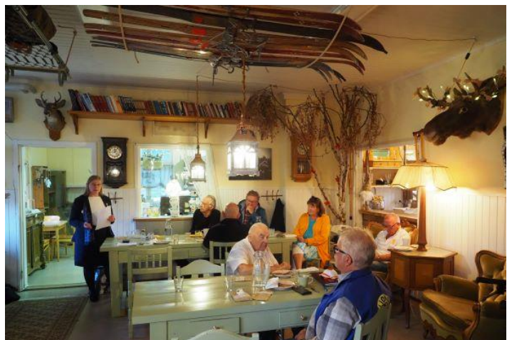
Kuva 7 Klubivierailulla Vuokatin asemarakennuksella.

Kauden 2021-2022 piirinhallituksen jäseniä ja muita piirin toimijoita muistettiin huhtikuussa Kiimingissä pidetyssä piirin vuosikokouksessa ja kesällä Oulun Hietasaaren Seeparissa pidetyssä hallituksen vaihtotilaisuudessa.