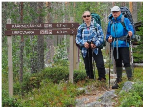
Kuva 21 Heillä on aika liittyä tukijoukkoihin.

Palveluvoimaa kuihduttava jäsenmäärän väheneminen on virittänyt lionstoimintaan muutostarpeita. Kaudella 2021-2022 aloitettiin I-piirissä tulevien kausien toiminnan suunnittelu ja kehitystyö nimetyn tulevaisuustyöryhmän johdolla. Järjestettyjen tilaisuuksien henki ja uusien toimintamallien ideointi saatiin heti myös käytännön toteutuksiin. Parempaa tavoitellen vanhoja toimintatapoja ja perinteitä on lähdetty haastamaan. Uusia kehityssuuntia hakiessa rohkeitakaan kokeiluja ei ole pelätty tehdä. Tulevaisuustyölle ennustaa hyvää, että kertomusvuoden aikana aloitettuja uusia toimintatapoja on myös alettu ottamaan vastaan ennakkoluulottomasti ilman perustelematonta muutosvastarintaa. Kuluneen kauden viesti uudelle kaudelle on, että toiminnan kehitystä ei yleensä tapahdu vaan sitä tehdään.