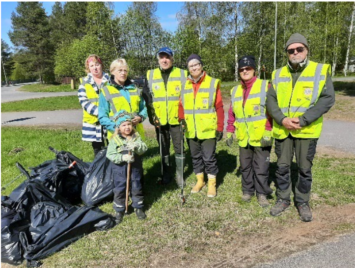
"Jokavuotinen" kulmat kuntoon aktiviteetti

Piirin ympäristöpalkinto luovutettiin LC Liminka/ Liminganlahdelle monipuolisesta ja ansiokkaasta toiminnasta.