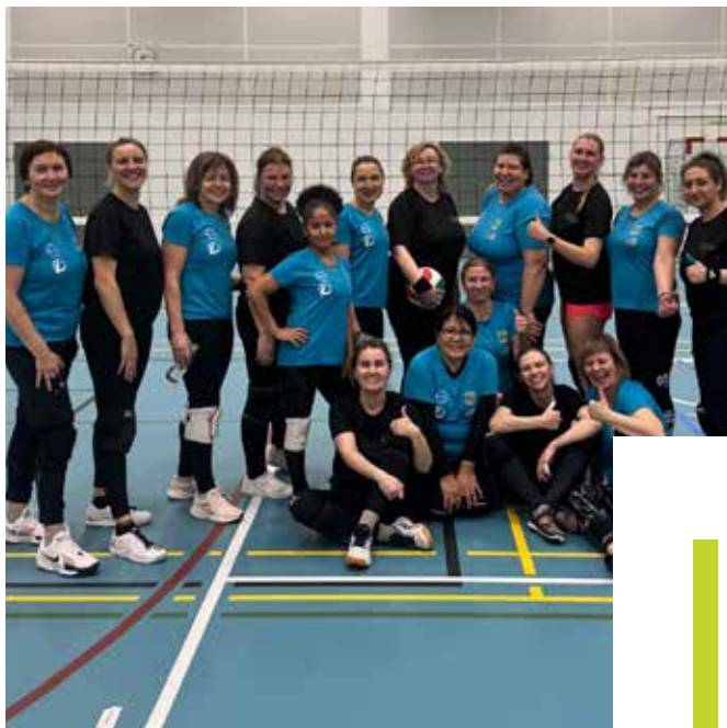
Catch and serve ball -turnauksessa Nummelassa.