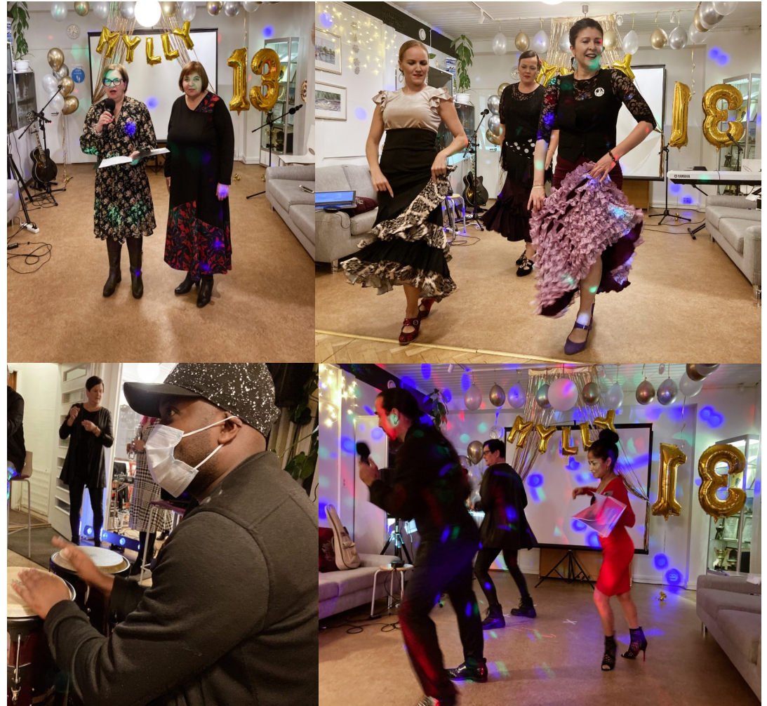
Myllyn 13-vuotisjuhla marraskuussa