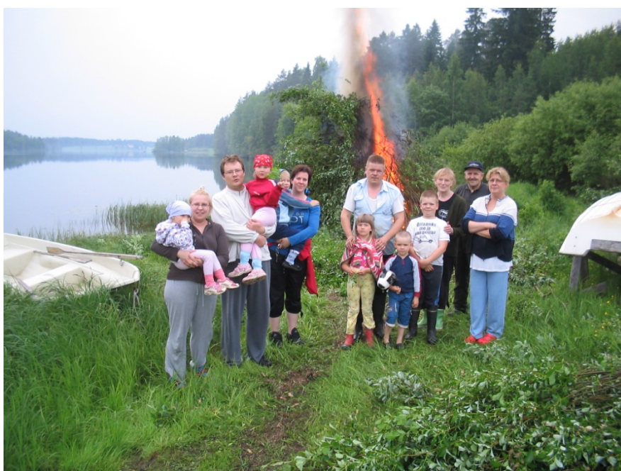
Kuva 4. Juhannustapahtuma Räimän kylällä v. 2008

Negatiivisena asiana koettiin Lemminkäisen asfalttiaseman sijoittaminen Räimän kylälle kauniin Honka-Jälän luontomaiseman läheisyyteen. Kyläläisten vastustamisesta huolimatta asemalle annettiin lupa toimintaan.