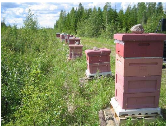
Kuva 2. Hunajatupa: Väinö Kuivalaisen mehiläistarhat Räimän kylällä.

Kyläläisten laatima yritys- ja palveluluettelo on liitteessä 2. Siilinjärven kunnan yritysluettelosta voi poimia lisätietoja myös Räimällä toimivista yrityksistä. ( www.siilinjärvi.fi/yritykset/yrityshakemisto/yrityshakemisto.php )