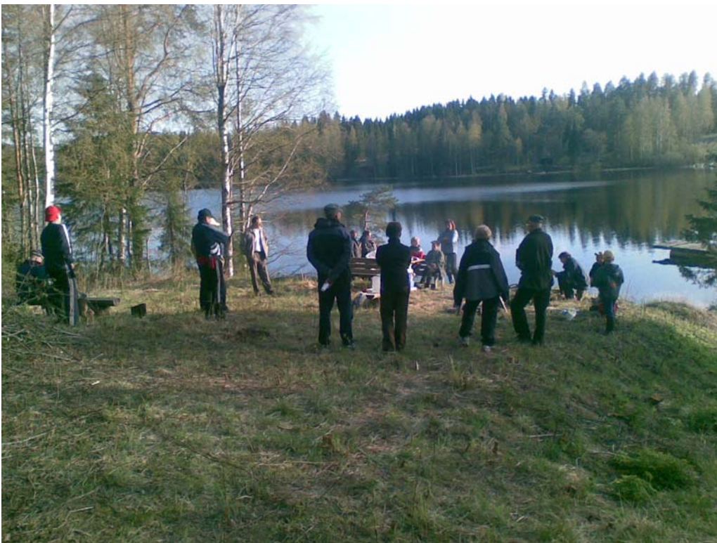
Kuva 3. Räimän kyläyhdistyksen perustamiskokous pidettiin 23.5.2008 perinteisen Kuorekeittotapahtuman yhteydessä Kallaveden Räimänlahdella. Kuvan rantamaisemaan rakennetaan kota ja venelaituri.

Kyläläisten mielestä harrastuksista lenkkeily ja pyöräily sekä liikkuminen luonnossa ovat hyviä. Ongelmaksi koettiin katuvalojen puute, lenkkeily pimeässä tiellä ei ole turvallista. Liitteessä 3 on kyläläisten kirjaamia asioita harrastus- ja yhteisötoimintaan liittyen.