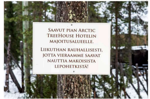
Kylteissä kehoitetaan rauhallisuuteen, sillä saavutaan hotellin alueelle. Hotelli on kuitenkin aidattu, joten ulkoilureitiltä on vaikea eiksyä hotellin alueelle.