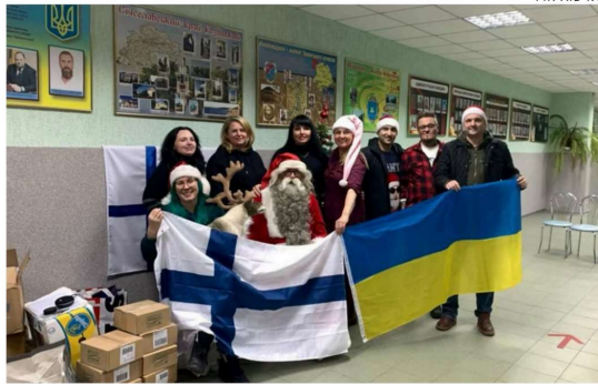
Fin Aidin vapaaehtoiset kävivät Ukrainan Nikopoliksessa viime vuonna ennen joulua. Tuolloin he viivät mukanaan lapsille ja nuorille lahjoja ja järjestivät paikalle joulupukin.