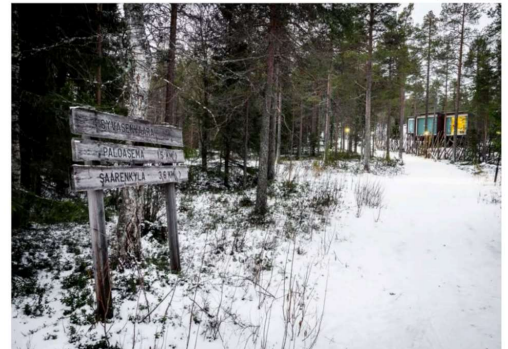
Yleinen ulkoilureitti Syväsenvaaran näköalatornille kiertää Arctic Tree House -hotellin läheiltä.