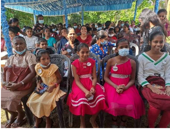
Kummilapsia ja vanhempia Baddegaman lastenjuhlassa