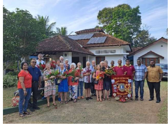
Vierailevia suomalaisia Baddegaman lionien kanssa