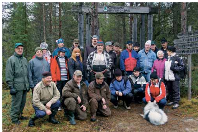
Hyvänmielen retkellä riitti jokaiselle oman halun mukaista toimintaa ja raitista ilmaa. LC Kuusamo Kitka kiittääkin kaikkia osallistuneita perinteeksi muodostuneesta ja onnistuneesta retkestä.