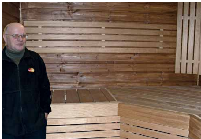
Komeat saunan lauteet odottivat joulusaunaan saapuvia kylpijiä.