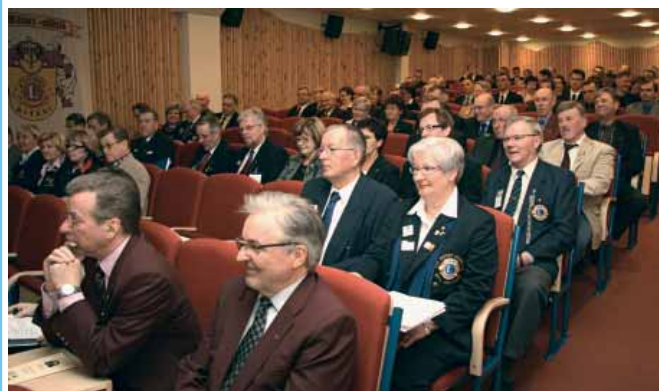
L-piirin vuosikokous pidettiin Saariselällä Ivalossa 26.04.2008. Kokouksessa oli läsnä 89 lionia ja 38 puolisoa. Virallisia edustajia osallistujista oli 68 24:stä klubista.