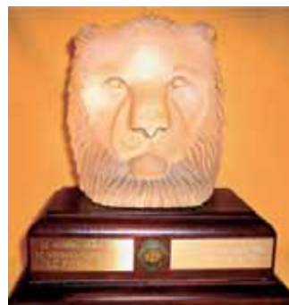
Teksti ja kuvat: Matti Mälkiä tiedottaja LC Posio

Kiertopalkinto on kiertänyt vuodesta 2004 ja sen on ennen LC Posiota voittanut LC Kii-minki/Jääli, LC Helsinki Ruoholahti, LC Hyvinkää/Paavola ja LC Elimäki/Ratsu.