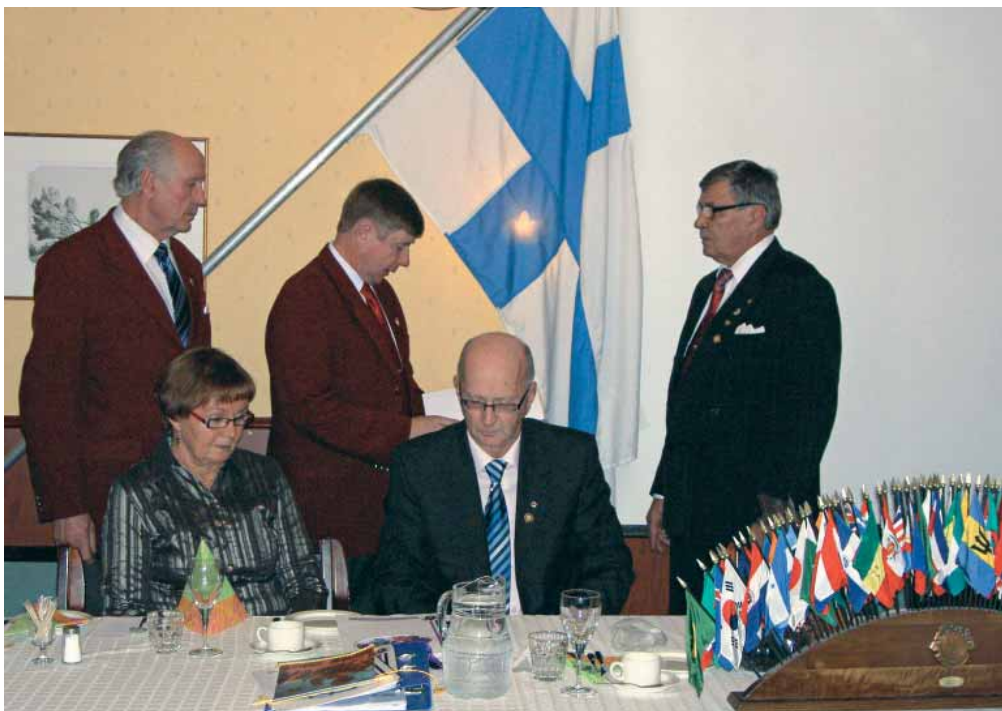
LC Ylitornio tuo onnittelunsa juhlivalle klubille.