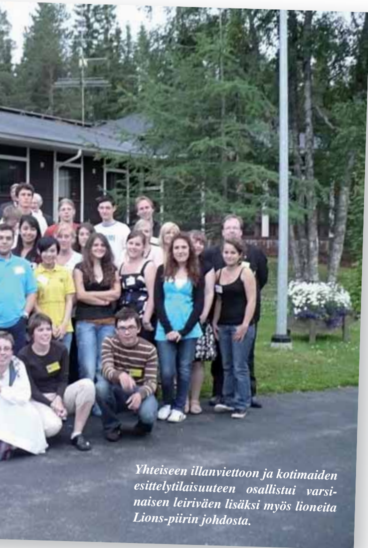
Yhteiseen illanviettoon ja kotimaiden esittelytilaisuuteen osallistui varsinaisen leiriväen lisäksi myös liioneita Lions-piirin johdosta.