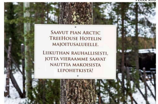
Kylteissä kehoitetaan rauhallisuuteen, sillä saavutaan hotelliin alueelle. Hotelli on kuitenkin aidattu, joten ulkoilureitiltä on vaikea eiksyä hotellin alueelle.