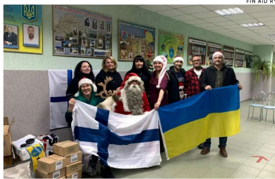
Fin Aidin vapaaehtoiset kävivät Ukrainan Nikopoliksessa viime vuonna ennen joulua. Tuolloin he viivät mukanaan lapsille ja nuorille lahjoja ja järjestivät paikalle joulupukin.