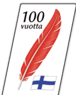
Autotarra, 90 mm korkea