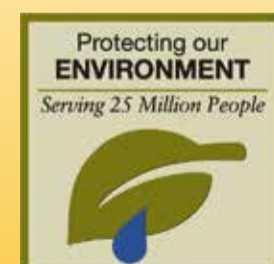
Ympäristö 19 miljoonaa