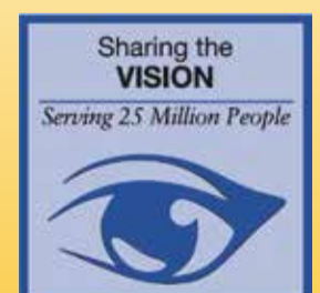
Näkökyky 11 miljoonaa