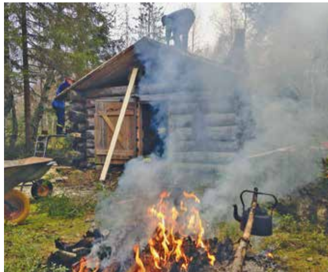
Nokipannukahvit maistuvat talkoolaisille.

Kun tulimme kämpälle, lautakuorma ja terva oli toimitettu sovitusti tien varteen. Koska kämpälle ei ole perille asti tietä, täytyi lautakuorma kantaa viimeiset sata metriä käsivoimin perille. Teimme työnjaon, jossa osa leijonista alkoi purkaa vanhaa kattoa ja loput kantaa lautoja rakennustyömaalle. Työnjako oli sopiva, sillä kun viimeinen lauta oli työmaalla, vanha katto oli jo purettu. Perusteellinen tarkastelu osoitti, että katon kantavat rakenteet olivat hyvässä kunnossa, eikä lahovikoja löytynyt. Joten, ei muuta kuin uutta vesikattoa rakentamaan.