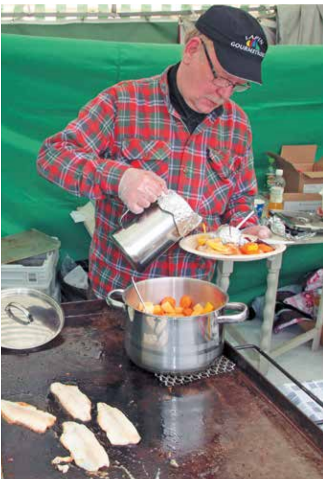
Monet tyytyivät seuraamaan tapahtumaa Pilkkipubin ja ruokateltojen tuntumasta maistuvista tuotteista nauttien – oli Gourmet kokkien kalaherkkuja ja lohikeittoja, poronkärystystä, räiskäleitä jne – ei päässyt nälkä yllättämään eikä janokaan.