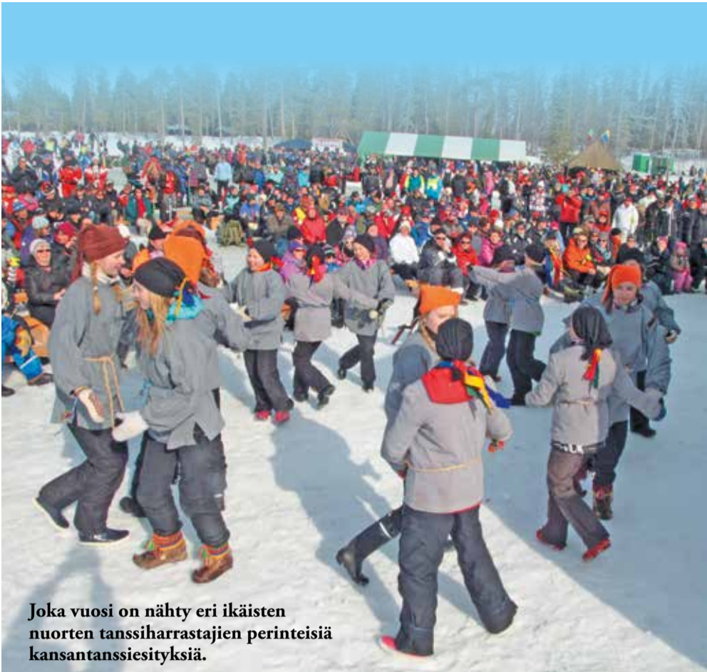
Joka vuosi on nähty eri ikäisten nuorten tanssiharrastajien perinteisiä kansantanssiesityksiä.