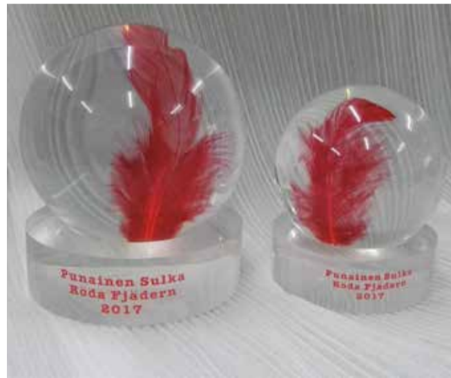
Akryylipallot 100 mm & 80 mm

Yleisölle suunnattu PuSu-tuotteiden myynti alkaa 19.3.2016. Kampanjassa on seuraavia tuotteita: