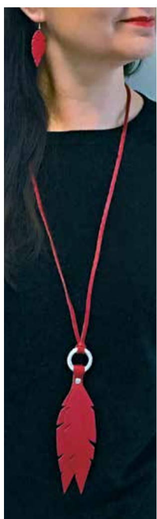
Kaulakoru ja korvakorut