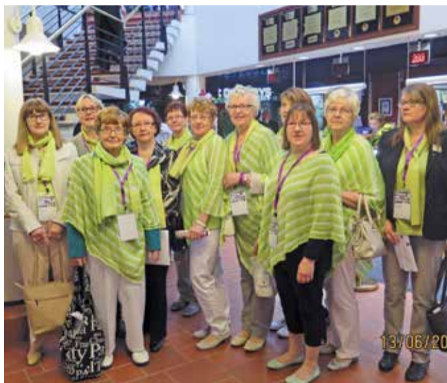
Pudasjärven naisklubi Hilimat tekivät kokoukseen linja-autoretken ja erottautuivat edukseen kokousyleisön keskellä samankaltaisessa asussa.