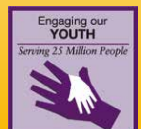
Nuoriso 24 miljoonaa