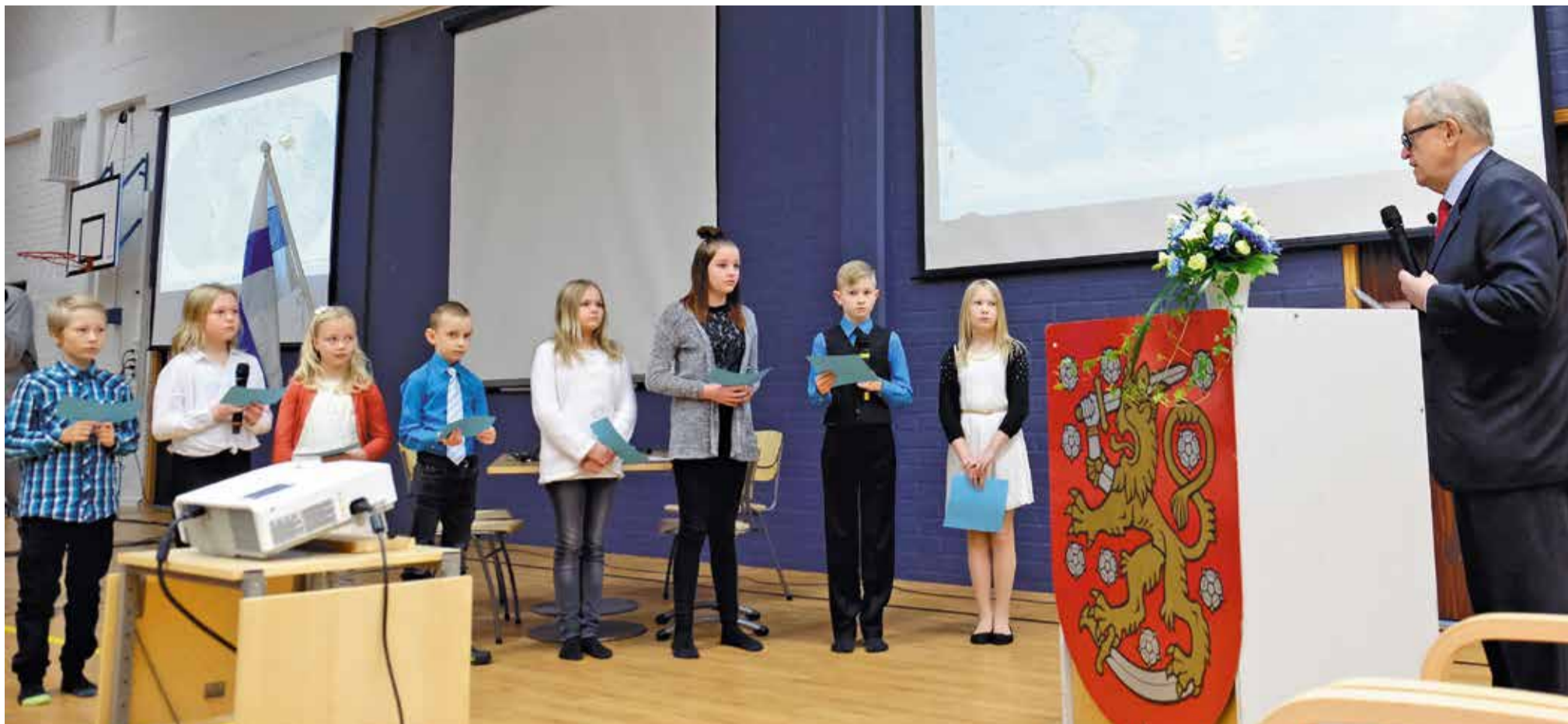
Oppilaskunnan jäsenet kyselivät presidentiltä hänen tekemästään rauhantyöstä sovittelijana.