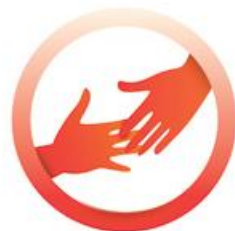
LCIF humanitaariset pyrkimykset