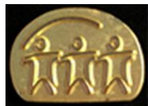
Asiakas- ja potilasturvallisuuden ansiomerkki.

Yhdistys myöntää potilas- ja asiakasturvallisuuden ansiomerkin ja diplomin yhdistyksen jäsenen tai jäsenorganisaation esityksestä henkilölle tai yhteisölle. Potilas- ja asiakasturvallisuuden ansiomerkki voidaan myöntää henkilölle tai yhteisölle, joka on osoittanut aktiivisesti varmistavansa tai kehittävänsä potilas- tai asiakasturvallisuutta. Ansiomerkki voidaan myöntää myös, jos henkilö tai taho on tehnyt merkittävän teon avoimuuden ja potilas- tai asiakasturvallisuuskulttuurin kehittämiseksi.