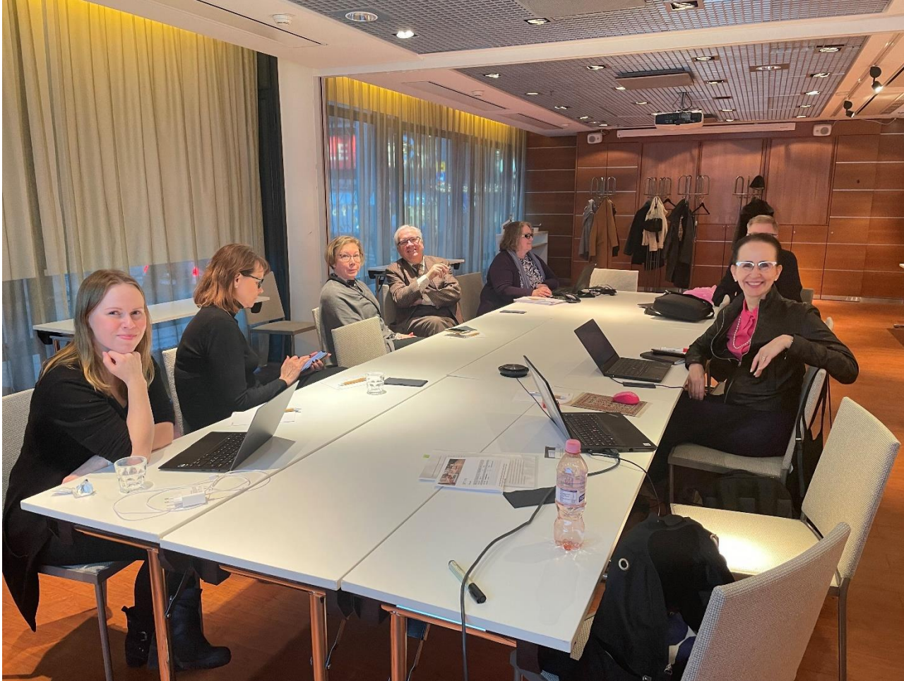
SPTY hallitus suunnitteli yhdistyksen toimintaa kehittämispäivässä Helsingissä 14.1.2023.