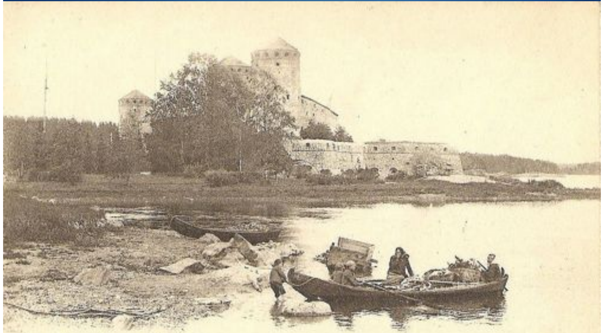
Savonlinna - Nyslott