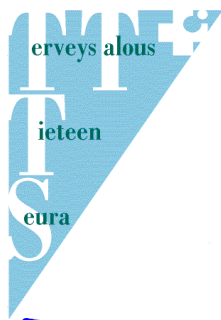
Kuva 2. Terveystaloustieteen Seuran logo 1997

Seuran visuaalinen ilme sai muotonsa vuonna 1997, kun se julkisti ensimmäinen virallisen logonsa (Kuva 2). Tällöin vakiintui myös vielä nykyään käytössä oleva seuran vaaleansininen tunnusväri. Logo oli käytössä vuoteen 2011 saakka, jolloin laajamittaisemman visuaalisen ilmeen uudistamisen yhteydessä otettiin käyttöön uusi logo (Kuva 3).