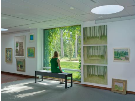
Kuva: Elina Brotherus: Green Still Life, 2022, sarjasta Visitor (Villa Didrichsen)/ Didrichsenin taidemuseo

Didrichsenin kevään näyttelyssä Elina Brotherus – Vierailija esitellään valokuva- ja videotaiteilija Elina Brotheruksen uusi valokuvasarja Visitor (Villa Didrichsen). Museon ainutlaatuisesta ilmapiiristä ammentavassa näyttelyssä nähdään ensimmäistä kertaa Brotheruksen Didrichsenillä vuosina 2021–2022 kuvaama valokuvasarja. Lähtökohtana siinä on ollut Brotheruksen vapaus leikitellä museorakennuksen arkkitehtuurin, interiöörin ja museon taidekokoelman kanssa. Brotherus luo kuviinsa vaihtoehoisen todellisuuden rakennuksen tunnetun historian rinnalle.