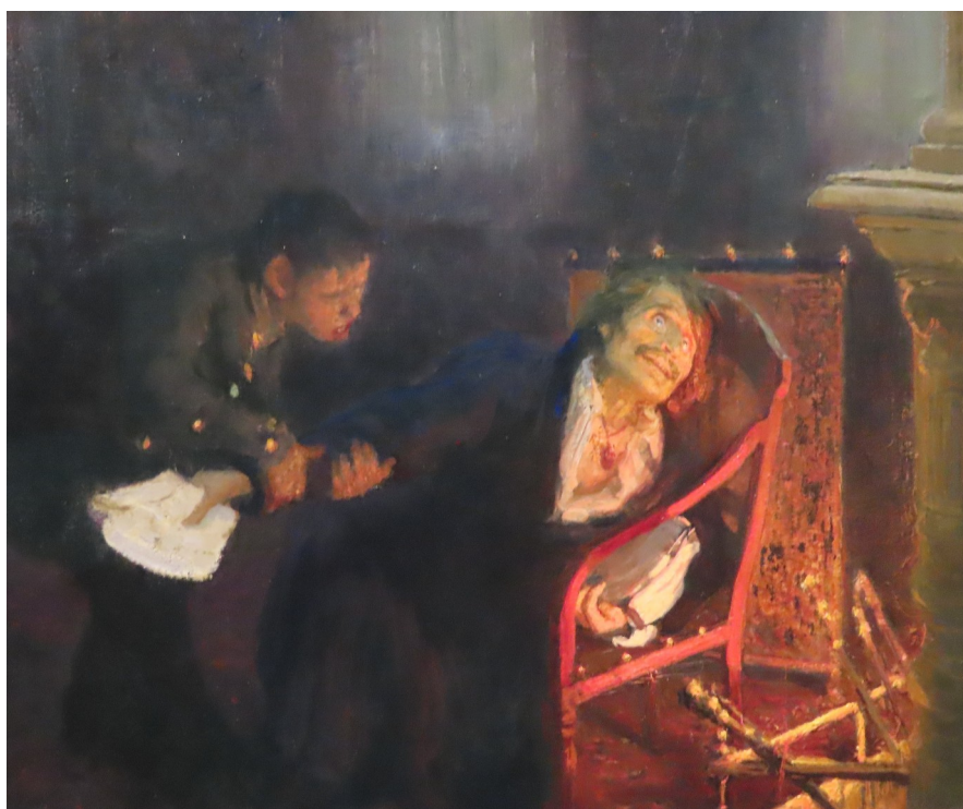
Ilya Repin: Nikolai Gogol polttaa Kuolleet Sielut -kirjan käsikirjoituksen toisen osan.

Tarttua ihmisen käteen joka on jo kuoleva tai ainakin melkein jo poissa sen näkee katseesta. Tarttua ihmisen käteen ja vain toisella omalla kädellä säästääkö se surua.