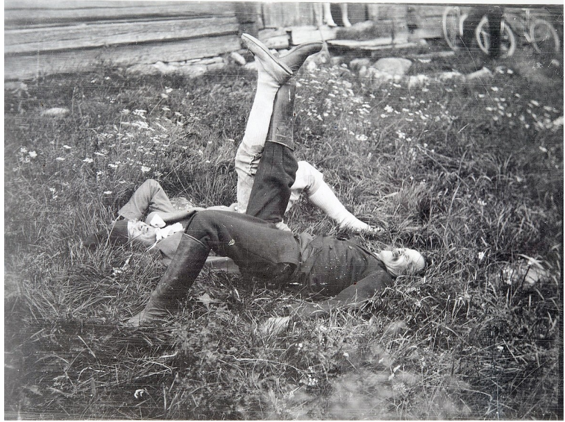
Kuva: Esko Aaltonen 1928

Osallistua ja sosiaalistua. Hengähtää ja pyllähtää. Tämähän Jooseppi ja Eeverttikin jo osasivat, tyky-päivän vieton.