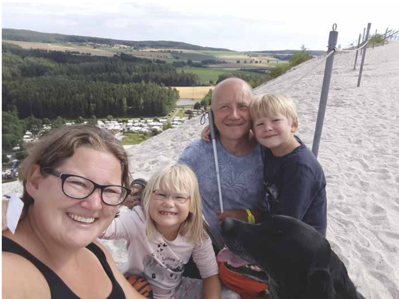
Itä-Saksassa leirintäalueemme vieressä oli 150 metriä korkea kvartsihiekkarinne, jossa pystyi laskettelemaan vaikkapa lumilaudalla. Lähes valkoisen hiekkarinteen päältä oli komeat näkymät.