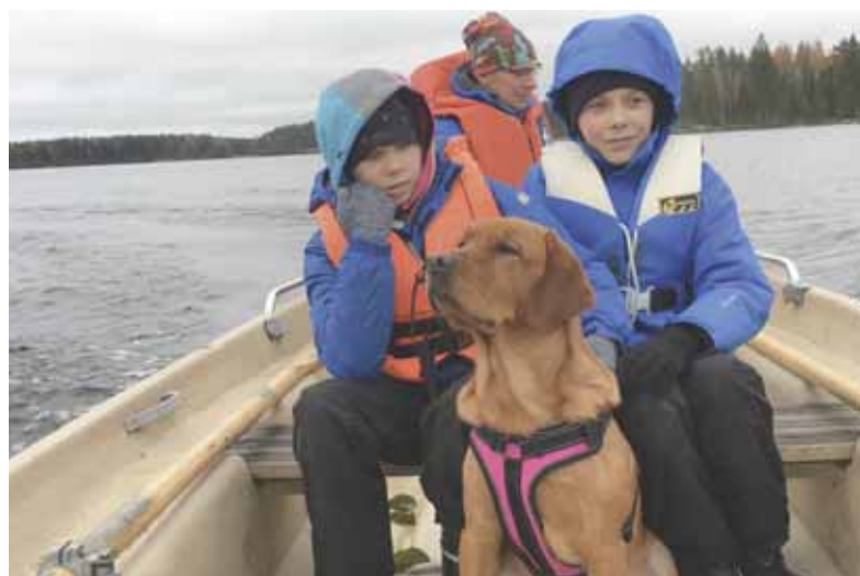
Veneretki: isä ajaa, isovelji on myös mukana