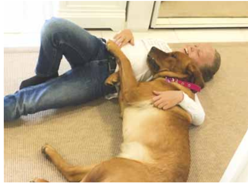
Ronja ja Mango