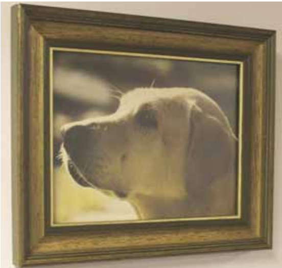
Huumekoira Eri.