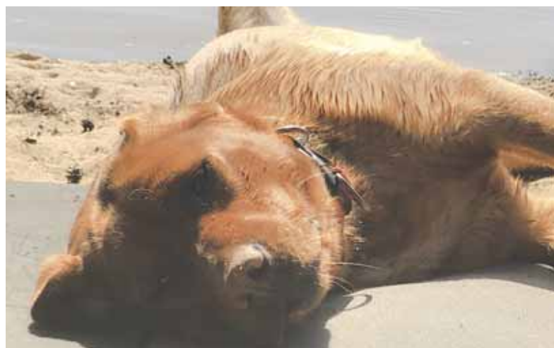
Puma kuivattelee uinnin jälkeen.