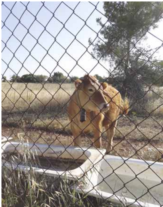
Leirintäalueen pissatuspaikalla oli liikkuvia äänimajakoita, kun naapuritontin lehmät vaelsivat parkkipaikan lähellä.

set söivät lihapullansa kiltisti. Lastenateriaan kuului myös trippimehu ja sosepötkö, joskin jälkimmäiset säästimme tulevaisuuden varalle ja kävimme alakerasta hakemassa pehmikset.