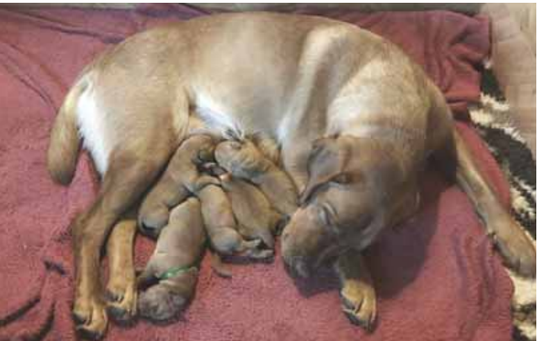
Mango on saanut pentuja!