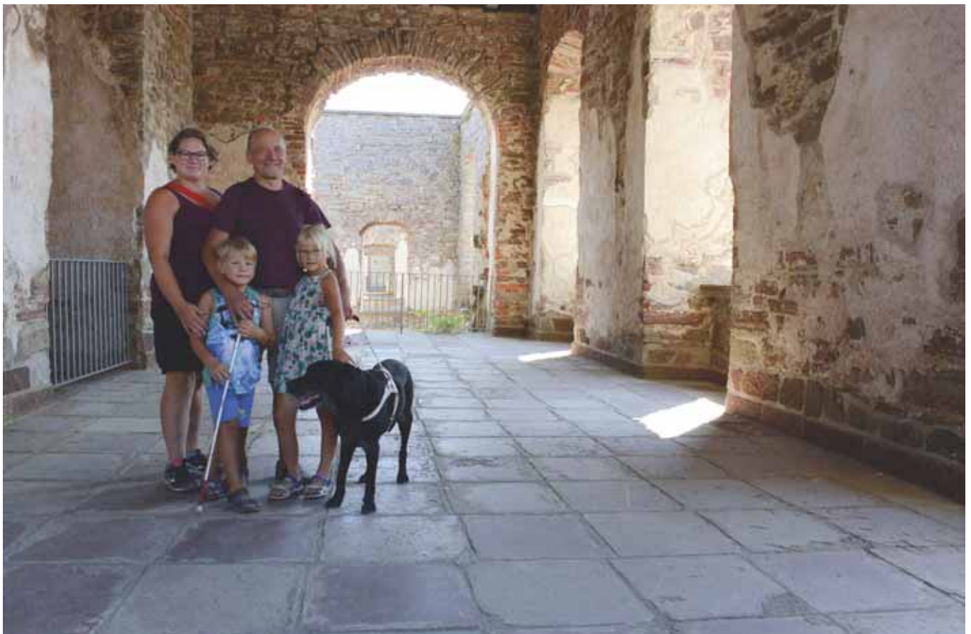
Ruotsin Öölannissa oleva Borgholmin linna oli todella hyvin säilynyt. Kuvassa olemme tornin kolmannessa kerroksessa. Linnan sisäpihalla pidetään kesän aikana useita ulkoilmakonsertteja.

Tässä tornissa oli kerrottu linnan vaiheikkaasta historiasta. Esimerkiksi 1600-luvulla Kaarle X Kustaa oli viettänyt Borgholmissa kesänsä. Hän oli nauttanut seurueensa kanssa 24 ruokalajin päivällisyyminkejä ja -juominkeja. Viiniä ja olutta oli kulunut toistakymmentä tuhatta litraa. Eräs toinen hallitsija oli nimennyt koko saaren maat kuninkaallisiksi met-