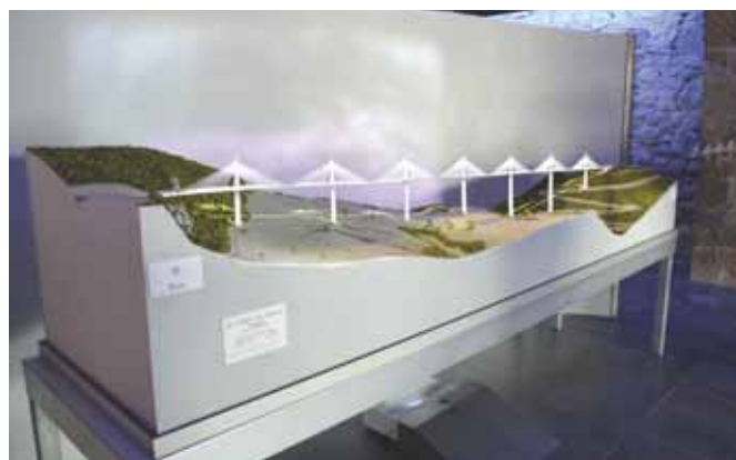
Etelä-Ranskassa on maailman korkein maasilta. Pienoismallin taakse heijastettiin sen hetkinen säätila, esimerkiksi pilviä.

Parikymmentä kilometriä myöhemmin ajoimme tuolle nelikaistaiselle sillalle. Kaksi ja puoli kilometriä pitkän sillan korkeus maanpinnasta oli noin 350 metriä. Se oli siten hieman korkeampi kuin Eiffel-torni ja melkein yhtä korkea kuin Empire State Building. Vinoköysisillan alla oli seitsemän pilaria ja sen päällä vastaava määrä torneja. Torneista lähti eripituiset vaijerit, jotka kiinnittyivät siltaan. Silta oli avattu ajo-