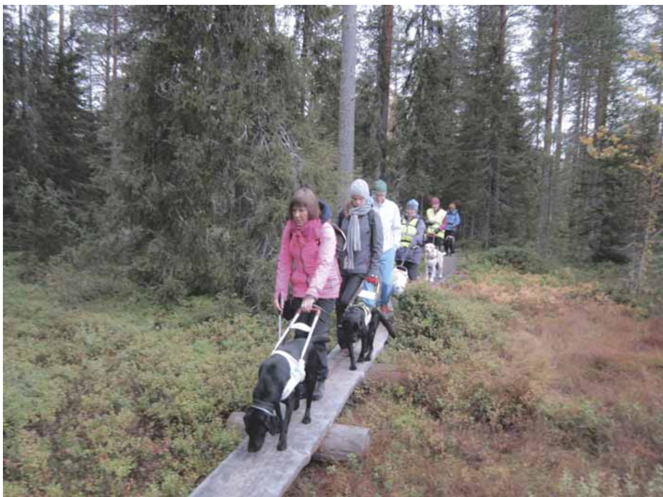
Pitkospuilla Rovaniemen syyspatikalla 2017.