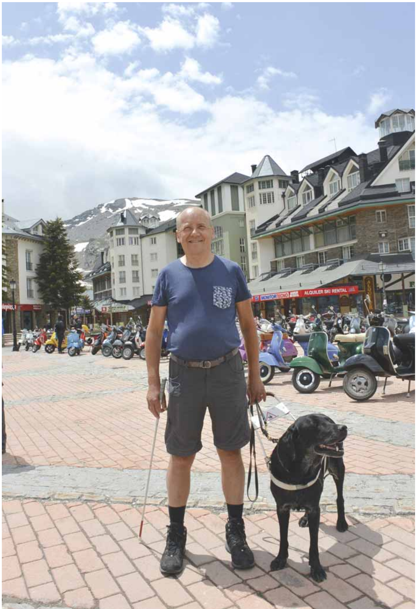
Espanjan Sierra Nevadan hiihtokeskuksen toriaukiolle ajoi päristellen ja torviaan toitottaen 170 Vespa. Muutaman kerroksen korkuiset hotelli- ja ravintolarakennukset olivat kesäkuun alkupuolella hiljaisia. Sierra Nevadan huiput kurottavat melkein 3500 metrin korkeuteen.