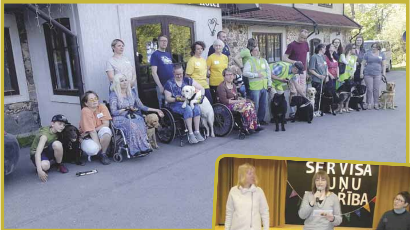
Smiltenen leiri ryhmäkuvassa.