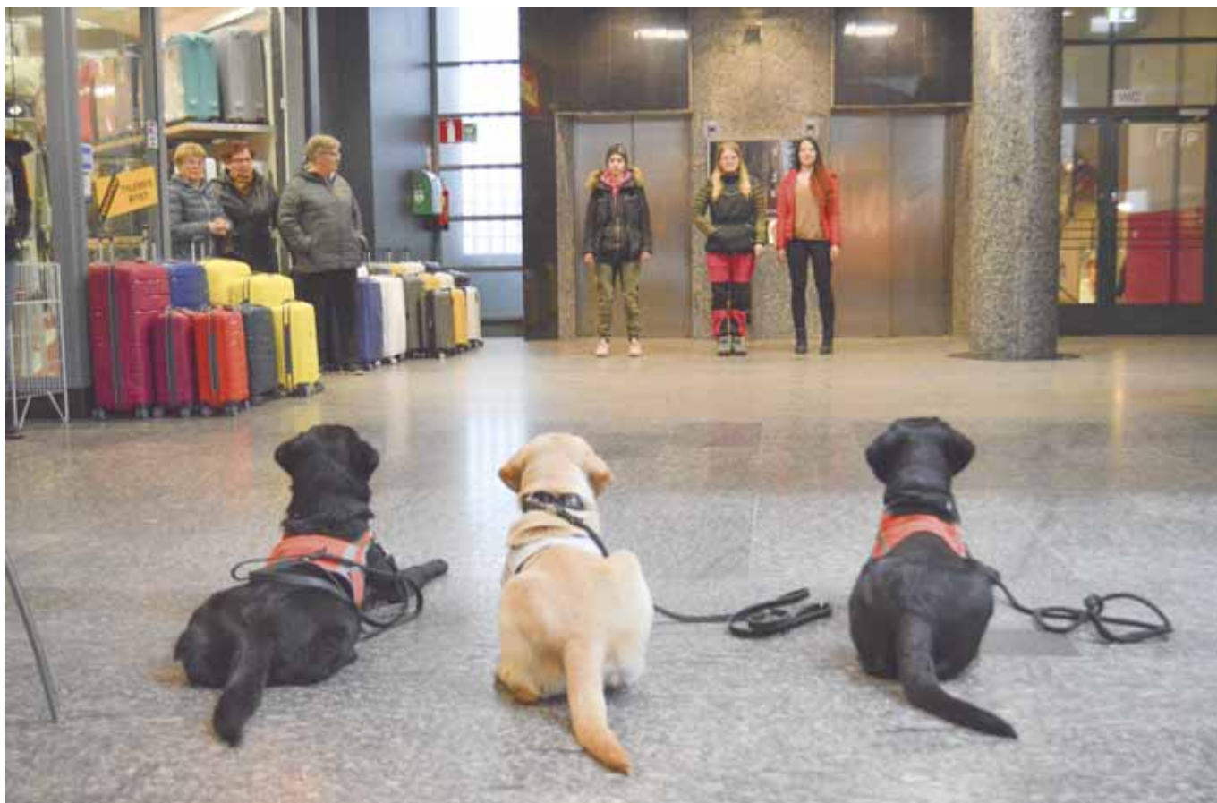
Opaspennut esiintymässä kv. opaskoirapäivänä 2018.