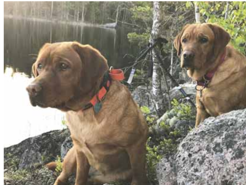
Mango ja Puma