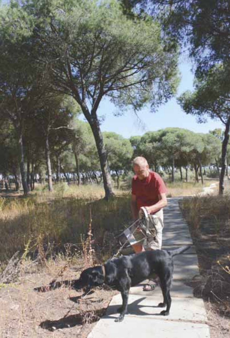
Pissapaikkojen etsiminen kävi joskus työstä. Tällä kertaa sellainen löytyi leirintäalueen läheisiltä dyyneiltä.