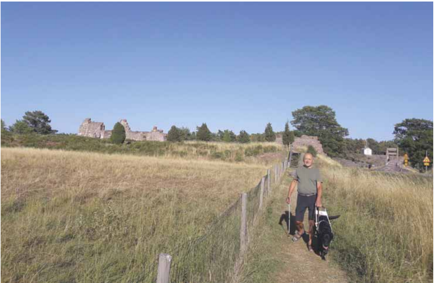
Ahvenanmaalla oleva Bomarsundin linnoitus tuhoutui Oolannin sodassa vuonna 1854. Valtavalla linnoitusalueella oli opastettu kävelyreitti. Lammasaitaukset, nummimainen kävelyalusta ja muinaiset linnanrauniot loivat seesteisen tunnelman.

sästysmaiksi. Tässä tornissa oli esillä täytetty kolmi-jalkainen koira, sillä kuningas oli käskenyt katkaista kaikilta paikallisten koirilta yhden jalan, jotta asukkaat eivät olisi voineet metsästää.