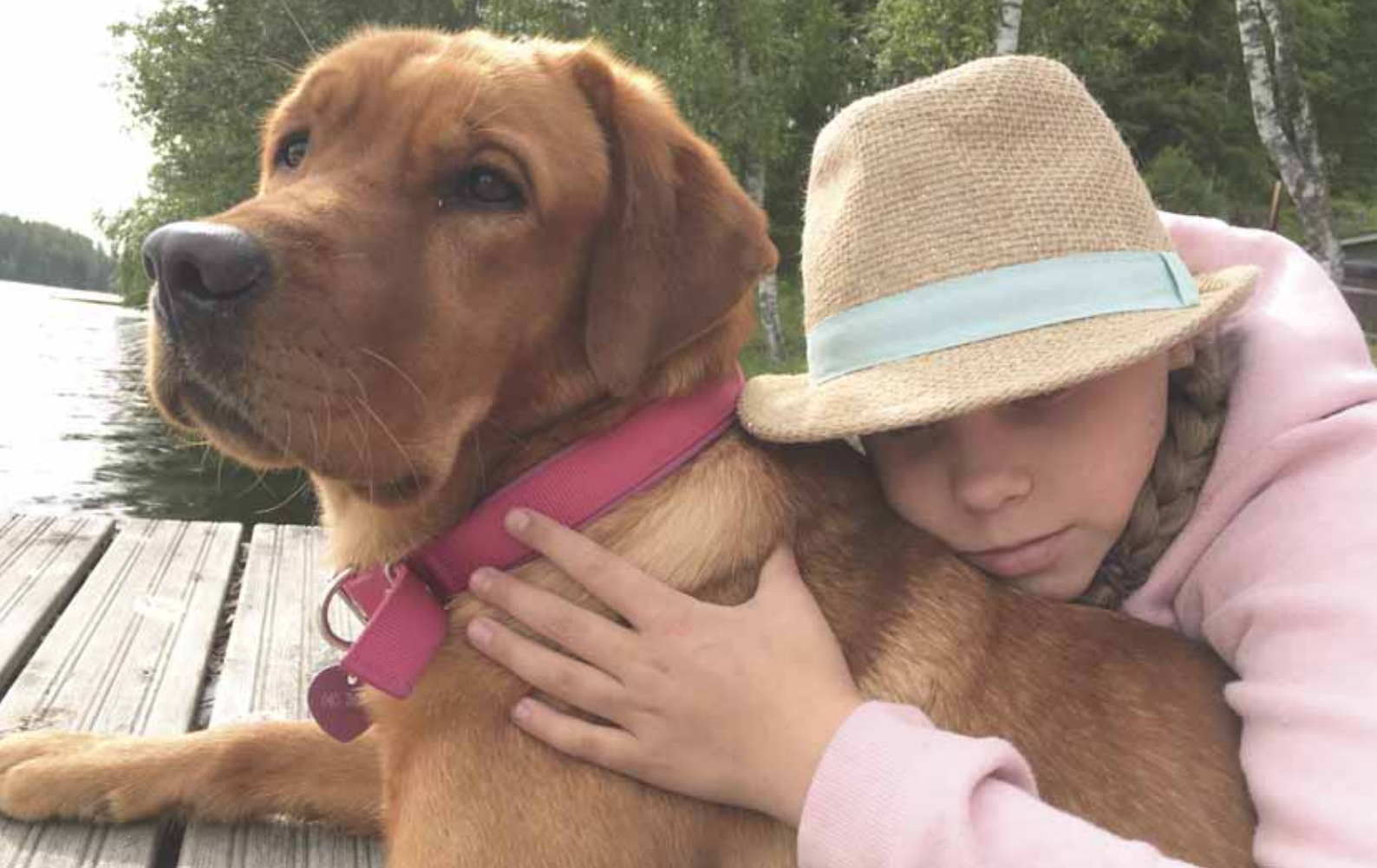
Ronja ja Mango laiturilla