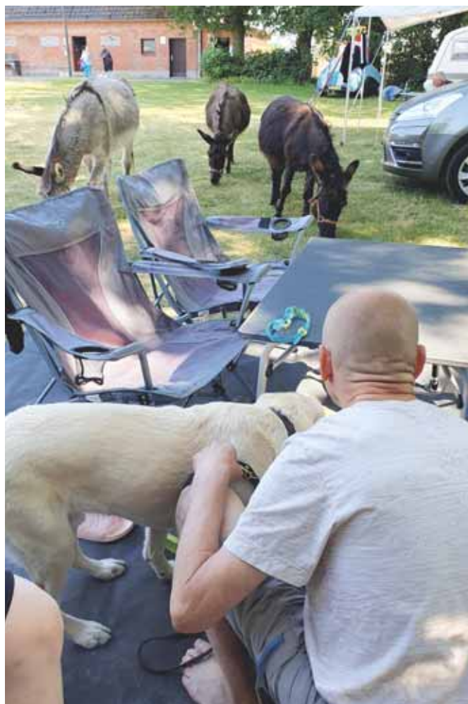
Leirintäalueella käyskenteli aaseja.

Camping Vreehorst oli valittu kaksi vuotta sitten Hollannin parhaaksi leirintäalueeksi. Silti leirintäalueella ei ollut lainkaan inva vessaa. Tavallisen vessan ovi oli niin jäykkä, että sitä ei saanut pyörätuolissa istuen auki. Vastaavanlaista esteellisyttä olimme havainneet pitkin matkaamme. Vaikka esimerkiksi Ruotsissa opaskoirakolla ei ollut oikeutta mennä