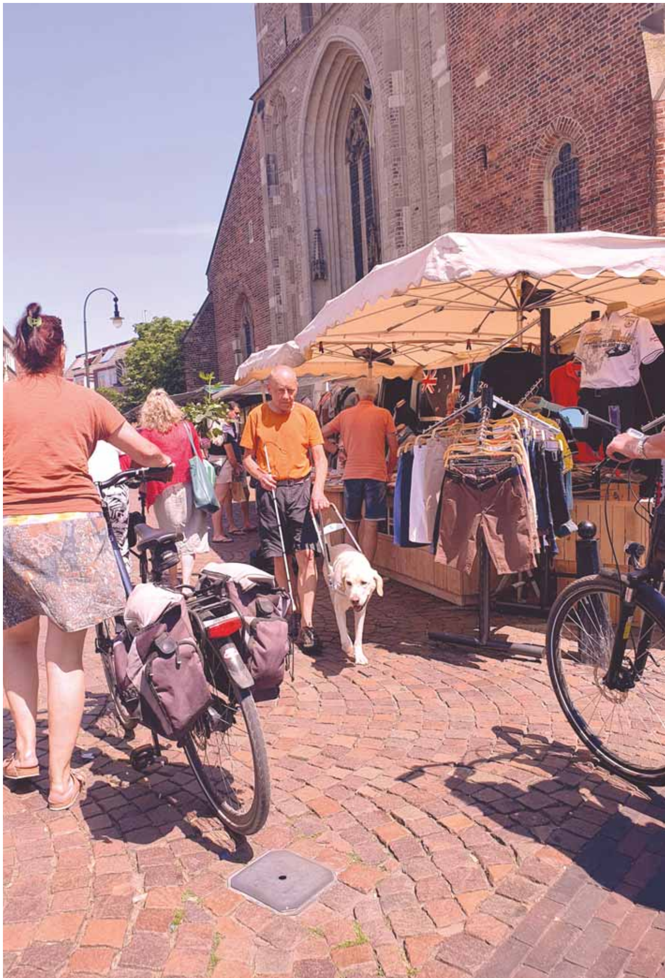
Toriväen keskellä liikuttaessa opaskoiran pitää olla tarkkana.