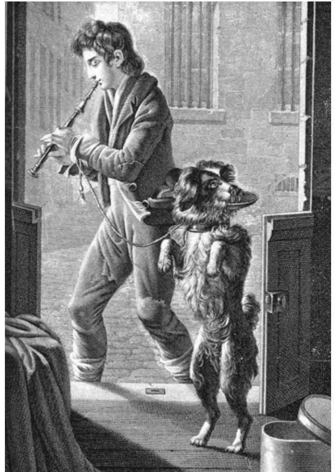
Sokea hankkimassa elantoaan soittamalla huilua. Hänen vierellään on koira, joka seisoo takajalkojensa varassa.

Pari kertaa ulkomailla käydessäni olen tavannut "köyhää kansaa" - tavallisia köyhiä, pummeja, jopa