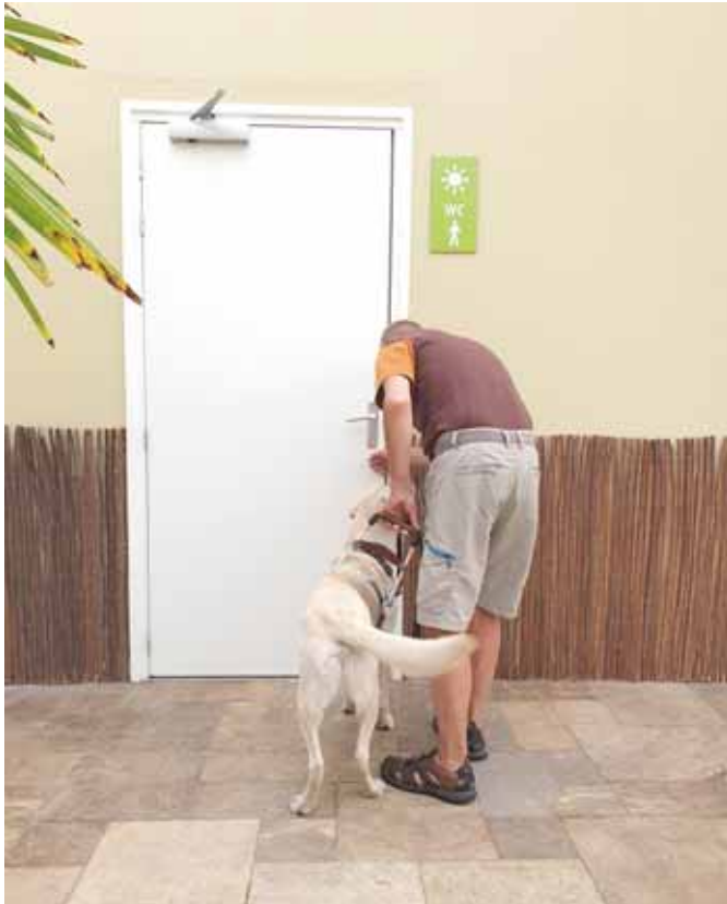
Jatkuvasti vaihtuvilla leirintäalueilla koiran taidot joutuvat koetukselle.