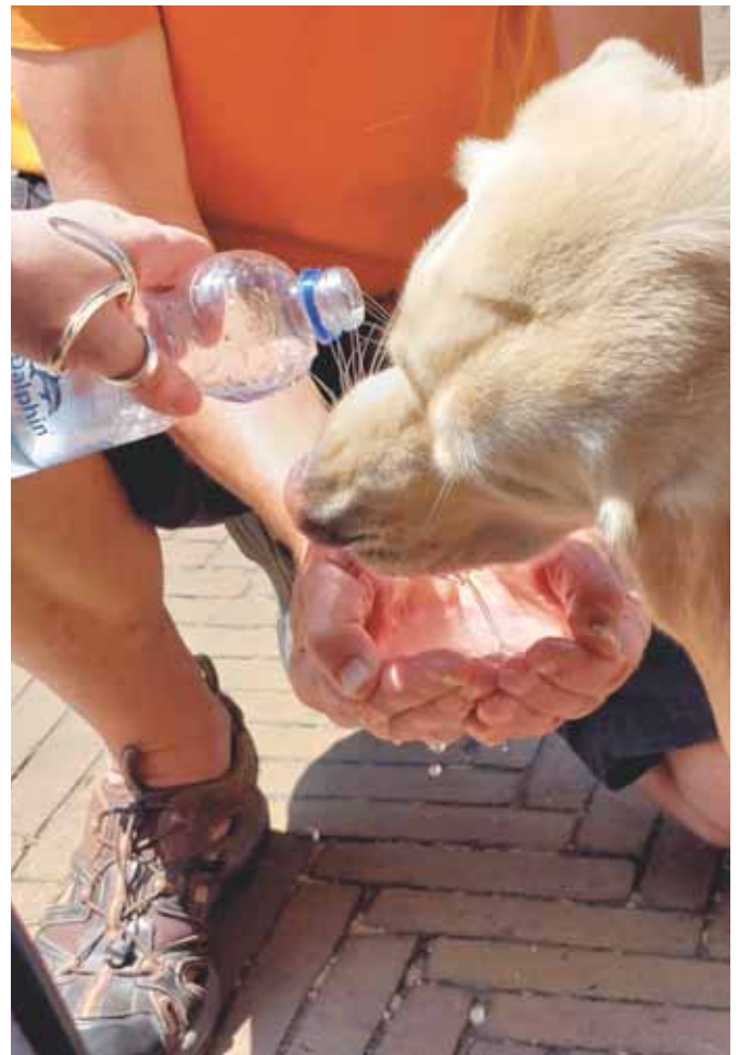
Kuumana päivänä voi juottaa koiraakin käsikupista.

Kaikki olivat nyt ihan poikki. Hampaiden pesun jälkeen jäljellä oli enää iltakirjan lukeminen ja iltalaulu. Patu oli ottanut pöydän alla olevan petin haltuunsa ja makasi siellä nyt koivet sojossa ison osan ruhosta ollessa käytävällä. Kaikki sänkyyn siis ja iltasatu pyörimään kirjankuuntelulaitteeseen.