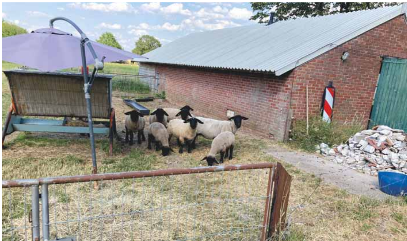
Itsenäisesti opaskoiran kanssa seikkaillessa voi eksyä keskelle lammasmaata.