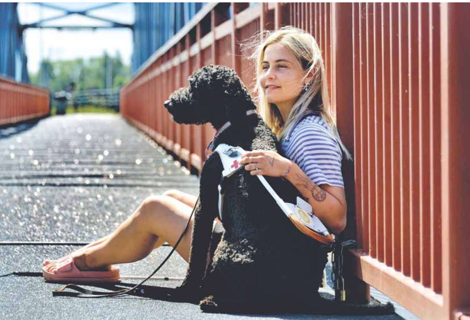
leva ja Feja Gauja-joen sillalla.

telematta itseään, kuulla häntä, vaikka kuulemasi ei olisikaan miellyttävää.