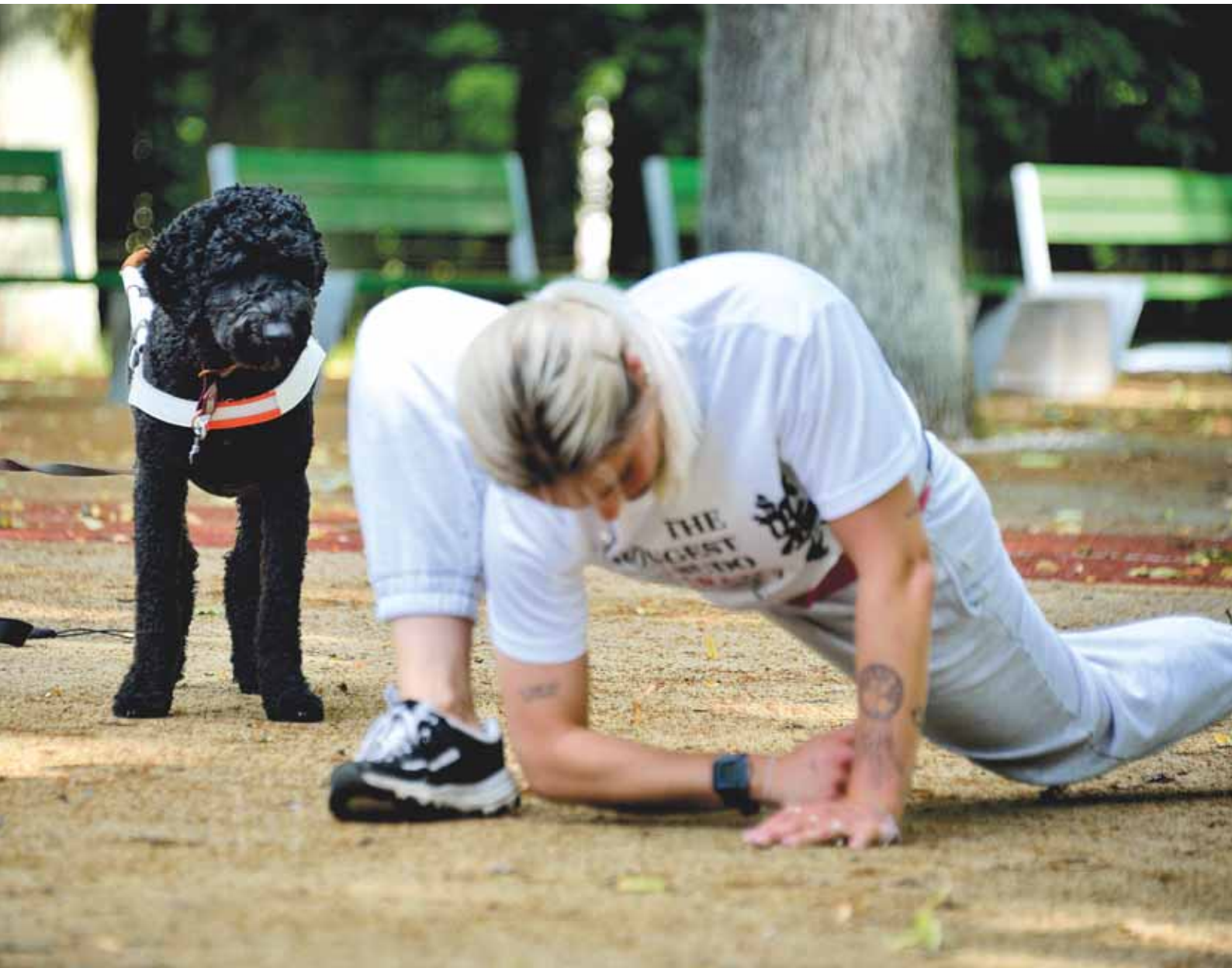
Feja seuraa levan karateharjoitusta.