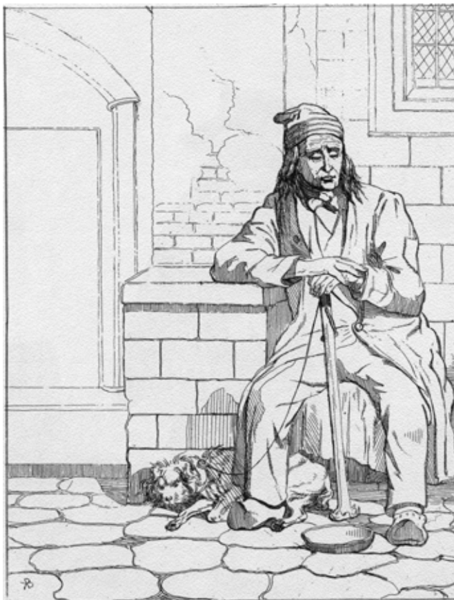
From the book DE BLINDE — J. Van Beers—1855 drawing by K. F. Bombleid

varkaita. Hyvä muisto jäi Neuvosto-Karjalasta, kun kävin kavereiden kanssa Petroskoissa. Pysähdyimme matkan varrella karjalaiskylissä, joiden keskeisille paikoille oli kokoontunut paikallista väkeä. Ihmiset olivat iloisia, mutta heistä näki, ettei elintaso ollut kovin korkea. Mielellään heitä avusti ja kiitollisina he ottivat vähäisenkin avun vastaan.