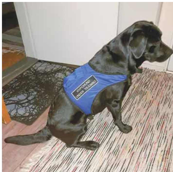
Dara virallisessa sinisessä hypokoiraivissä.

Hypokoira oppii erottamaan liian matalan ja korkean verensokerin tuoksun. Kun koira ilmaisee hyvissä ajoin korkean tai matalan verensokerin, eikä diabe-