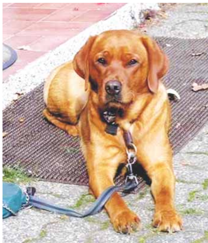
Foxy kotona Joroisten Huutokoskella.

S ain ensimmäisen opaskoirani vuonna 1990. Opaskoira oli ihan vaalea narttu, nimeltään Kiivi. Asuin siihen aikaa kotona maaseudulla. Muistan kun kerran talvella olimme Kiivin kanssa isäni tekemällä traktoriuralla pelto- ja metsäosuudella. Pelto-osuudella annoin Kiivin juosta vapaana, sillä enhän voinut eksyä peltouralta mihinkään. Kun lähestyimme metsäalueen reunaa, Kiivi ei laskenut minua menemään eteenpäin ja matkamme pysähtyi. Kiivi istui jalkojeni eteen, eikä liikkunut mihinkään. Aikani houkuttelin sitä liikkumaan eteenpäin ja viimein hän suostui liikkeelle. Seuraavan päivänä isäni sanoi, että pellon poikki oli mennyt hirven jalanjäljet ja Kiivi selkeäs-