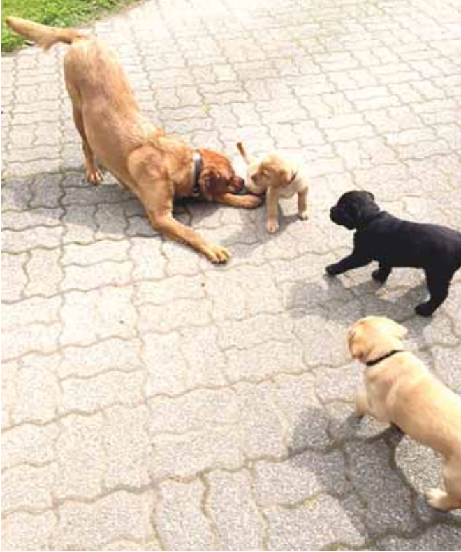
Foxy piti hyvää huolta pennuistaan.