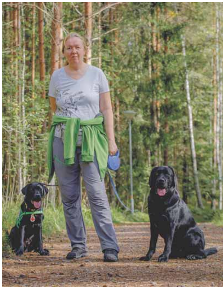
Zaiga ja koirat.