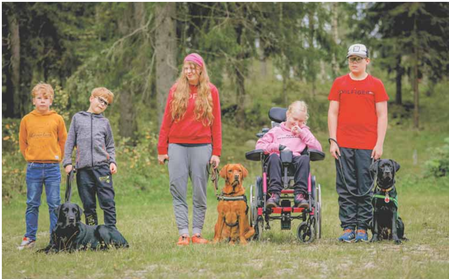
Nuoret ja koirat tottelevaisuusharjoituksissa.