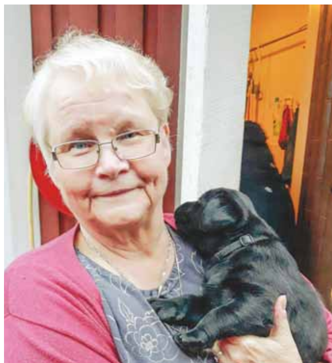
Tästä se alkaa, Dara kotiin lähdessä Oulusta.

Hypokoirankäyttäjä voi kouluttaa omasta koirastaan itselleen verensokerin ilmaisijan Hypokoira ry:n järjestämällä kursseilla. Koulutuksen voi aloittaa alle kolmevuotiaan koiran kanssa. Koska koirat ovat omistajiensa koiria, rotujakin on monenlaisia - labradorinnoutajasta Bichon Friseehen, suursnautseritapitkärvaraiseen Collieen, irlanninterrieristä karkeakarvaiseen mäyräkoiraan. Näyttökokeen suorittaneiden Hypokoirien työskentely tarkastetaan kahden vuoden välein tasotarkastuksin. Vuodesta 2022 alkaen valmistuneiden ja tasotarkastettujen Suomen Kennelliitossa rekisteröityjen hypokoirien tietoihin lisätään hyötykoirakoe ja koetulos HypoK. Tu-