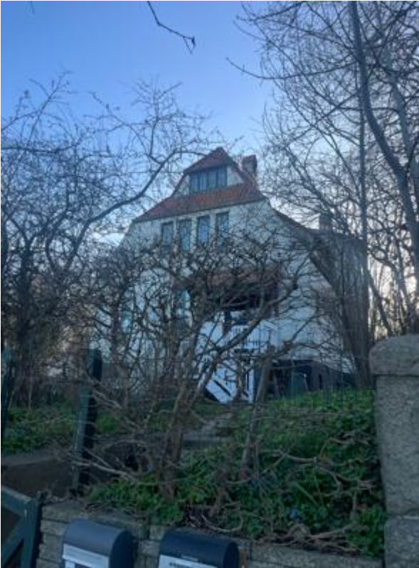
Tässä vuokrakämpäni Århusissa, 2 krs.