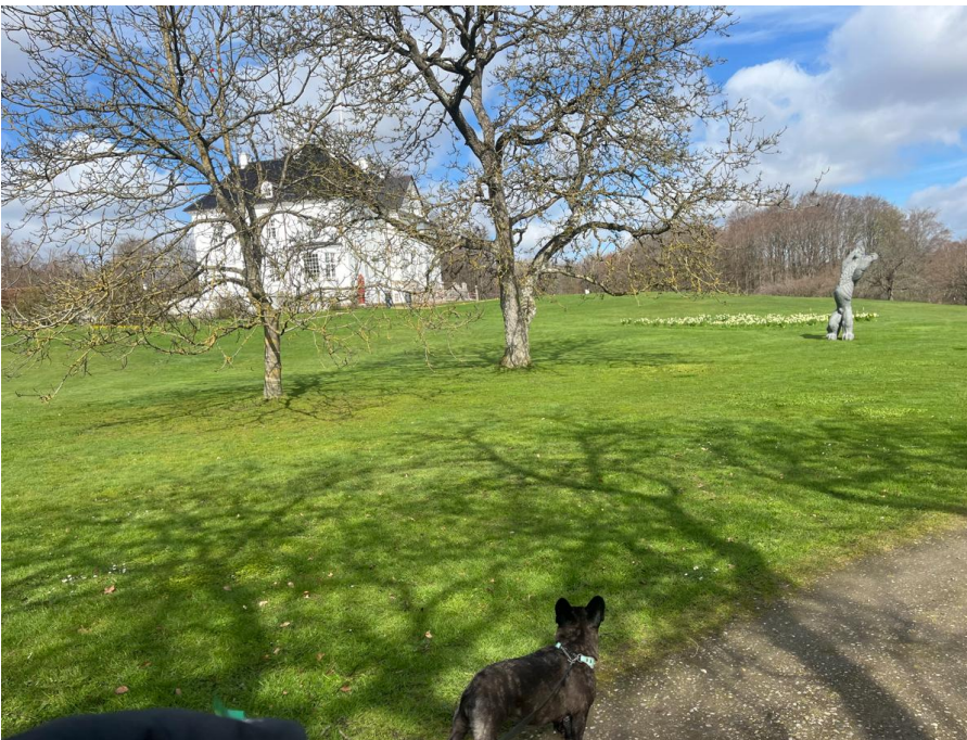
Kämpän läheisiä lenkkeilymaastoja. Tämä on kuninkaallisten kesämökki.

Tanskassa olkatekonivelkirurgian revisiot on keskitetty kahteen paikkaan, Århusiin ja Kööpenhaminaan. Sovin hyvissä ajoin, että minua kiinnostaa nimenomaan olkapään hankalat luupuutos -tyyppiset primääri toimenpiteet ja hankalat revisiot. Näitä oli hyvin saatu järjestymään ennalta sovituille päiville. Olin mukana