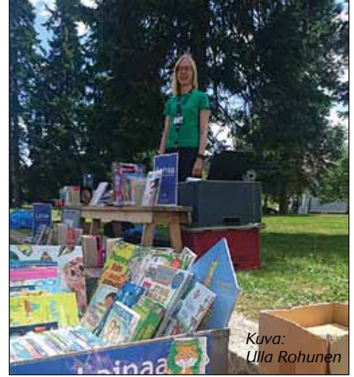
Kuva: Ulla Rohunen