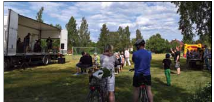
Irwin Goodmanin rouheat kappaleet saivat ohikulkijatkin poikkeamaan juhlissa.