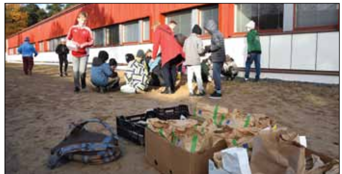
Norssin oppilaat yhdessä luonnonsuojelujärjestön Villi vyöhyke ry:n asiantuntijan kanssa kylvivät ja istuttivat kuivalle kedolle sopivia kasveja.