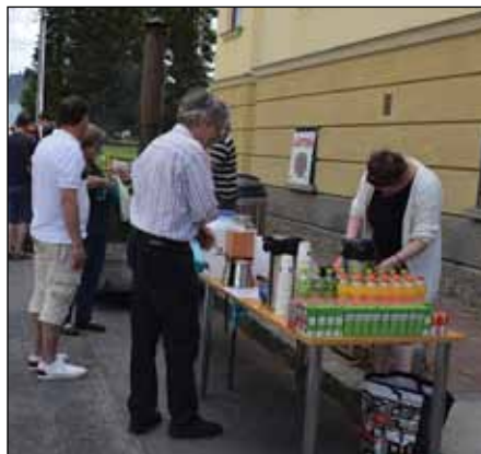
Partiolaisten muurin pohjaleitot ja omakotiyhdistyksen kioskin antimet tekivät kauppansa...