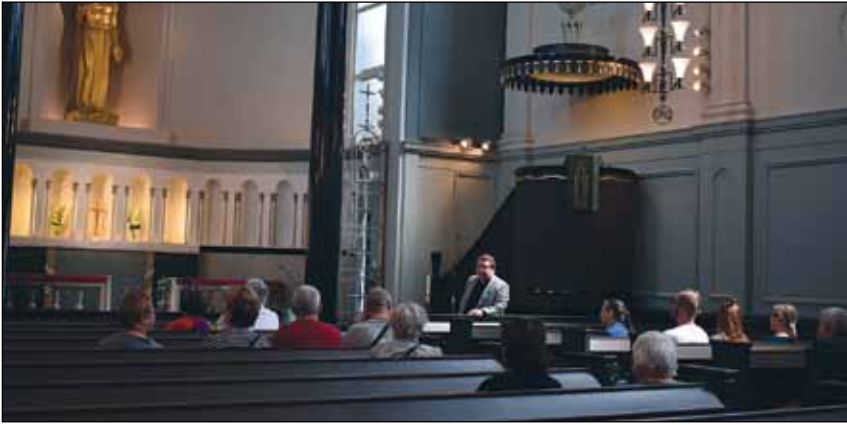
Kesäjuhlissa pääsi myös opastetulle kierrokselle Viinikan kirkkoon.