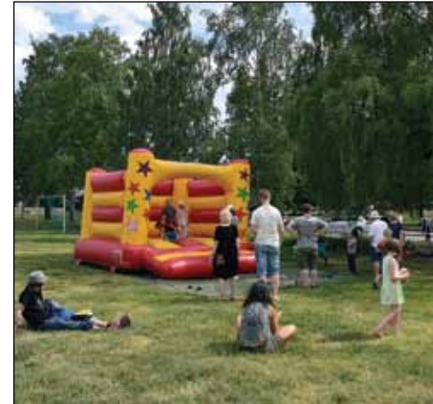
Pomppulinna oli pienten lasten kovassa käytössä.