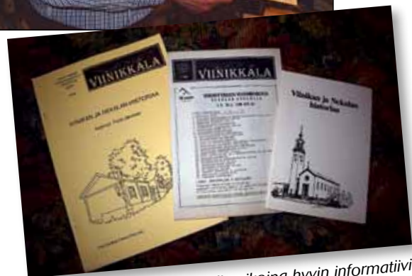
Viinikkala-lehti on ollut alkuajoina hyvin informatiivinen tiedotusvihkonen.