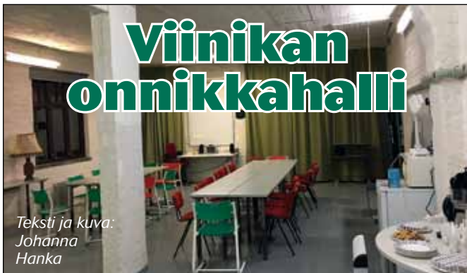
Teksti ja kuva: Johanna Hanka

■ 1920-luvulla joukko viinikkalaisia alkoi pohtia ensimmäistä onnikkareittiä Tampereen Kivistönkylästä keskustan Kaupatorille. Päätettiin perustaa osakeyhtiö, Viinikan Auto Oy, jonka omistajiksi saatiin 200 viinikkalaista.