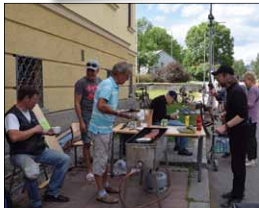
...kuten myös makkarat!