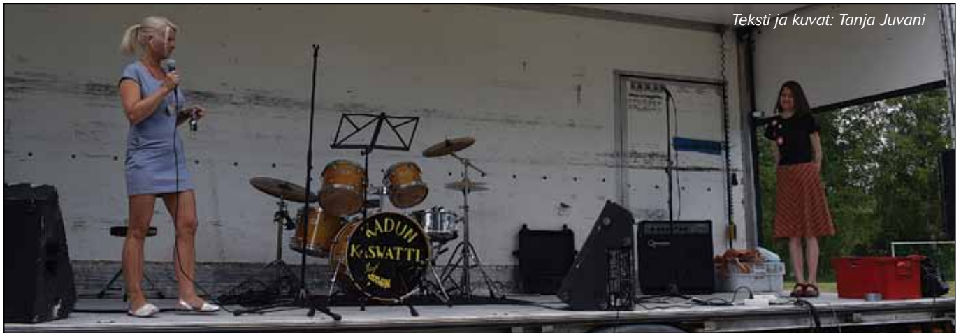
Teksti ja kuvat: Tanja Juvani

hankittu lippuja omakotiyhdistyksen jäsenille. Lehden ilmestymishetkellä lippuja ei valitettavasti ole enää saatavilla. Sirkuslipun hankkineille tarjotaan esityksen väliajalla omakotiyhdistyksen 80-vuotisjuhlakahvit.