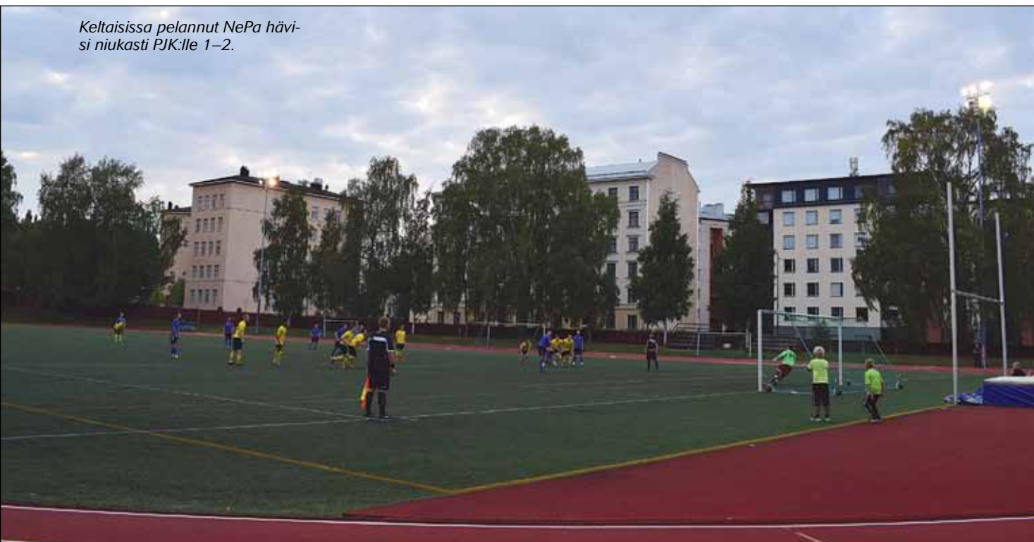
Keltaisissa pelannut NePa hävisi niukasti PJK:lle 1-2.

NePa juhli 40-vuotistaivaltaan juhlaottelulla ja -illallisella 17.8.2018.