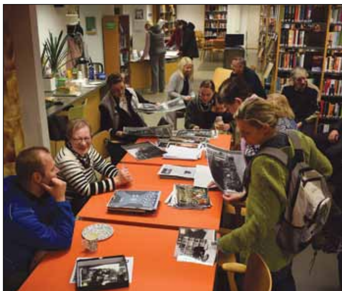
Vanhat kuvat kiinnostivat kirjastoon saapuneita.

musiikkiluokkalaisista, kuorosta ja pelimanneista. Niitä katsellessa keskustelu kävi niin innokkaasti, että sille varattu aika meinasi loppua kesken.