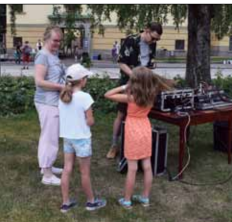
DJ Teemun Lasten Disko laittoi juhlakunnolla käyntiin. DJ toteutti kaikki toiveet, jopa näiden tyttöjen toivoman "sufflen" (vas.). Biisivalinnat miellyttivät myös Dame-saa (oik.).