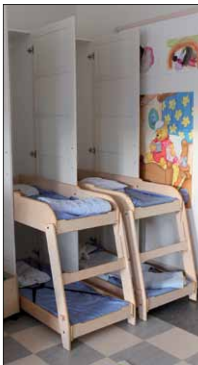
Lepohetkellä Mustikat ovat kokeilleet lasten osallistamista: isot auttavat ensin pienempiä nukkumaan ja rauhoituvat sitten itsekin satua kuuntelemalla.