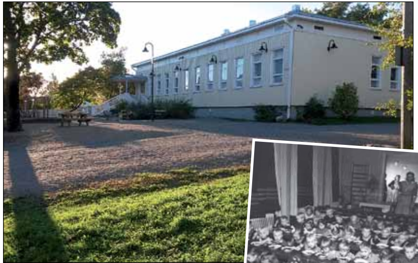
Lapset ovat saaneet leikkiä, kasvaa ja kehittyä jo kahdeksan vuosikymmentä rauhallisessa ja turvallisessa ympäristössä omakotitalojen keskellä osoitteessa Lampitie 42.