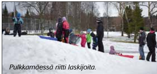
Pulkkamäessä riitti laskijoita.

■ Kolkosta ilmasta huolimatta Viinikan-Nekalan Omakotiyhdistyksen ja Tampereen Steinerkoulun 6B-luokan järjestämään talviriehaan 19.2.2017 osallistui noin 200 kävijää. Vähälumisen ajankohdan vuoksi perinteinen hiihtokilpailu peruuntui, mutta pulkkamäki ja koiravaljakkoajelu vetivät väkeä ja rohkeimmat kävivät luistelemassa hieman jo vettyneellä jäällä. Tampereen yliopiston normaalikoulun sirkusluokkalaiset esiintyivät ja pitivät halukkaille sirkuskoulua. Vilun ja nälän tunteeseen toivat helpotusta hernekeitto, grillimakkara, pannukakku, munkki, kahvi ja mehu.