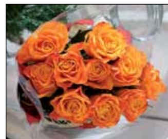
Päiväkoti sai paljon kukkia ja lahjoja.