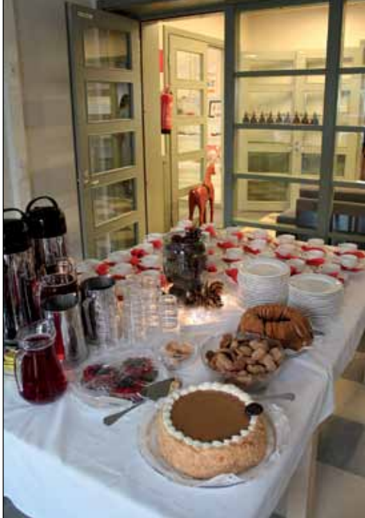
Juhlan kunniaksi tarjottiin kakkukahvit.