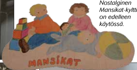
Nostalginen Mansikat- kyltti on edelleen käytössä.