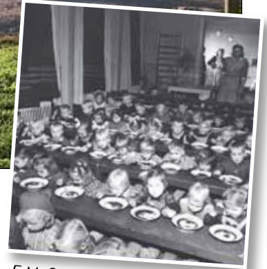
E.M. Stafin ottama kuva Viinikan päiväkodin pikkujoulupuuroilta vuodelta 1948. Vapriikin kuva-arkisto.