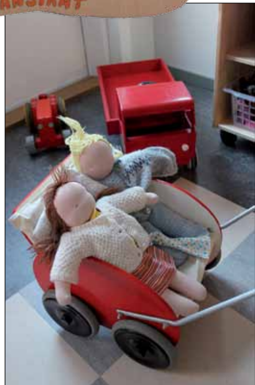
Vanhat lelut ovat vielä loistokun- nossa.