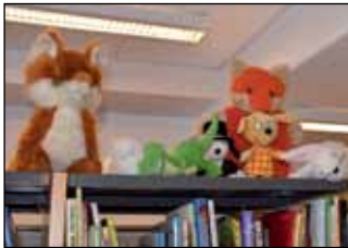
Lastenosaston maskotit kurkkaavat hyllyn päältä.

Monelle asiakkaalle on uutta aineiston kellumisilmiö. Kaupungin kirjastoilla ei ole enää omia kokoelmia, vaan kaikki aineisto kellokirjastosta toiseen. Lainauksia ei tarvitse palauttaa sinne, mistä ne on lainattu, eivätkä kirjastotkaan kuljeta aineistoja sinne, mistä ne on