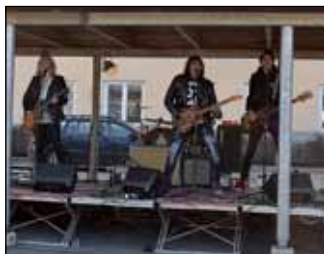
Costello & Rock'n Roll Boys soitti Popedaa, Hurriganesia ja muita suomirock-klassikoita.