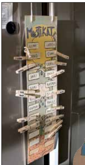
Nimikko-pyykki- pojat auttavat kummasti kuivatta- maan ja löytämään lasten käsineet kuivauskaa- pista.