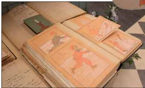
Muistikirjoihin on kerätty vanhoja kortteja, kirjoja, piirustuksia, valokuvia ja muita aarteita.