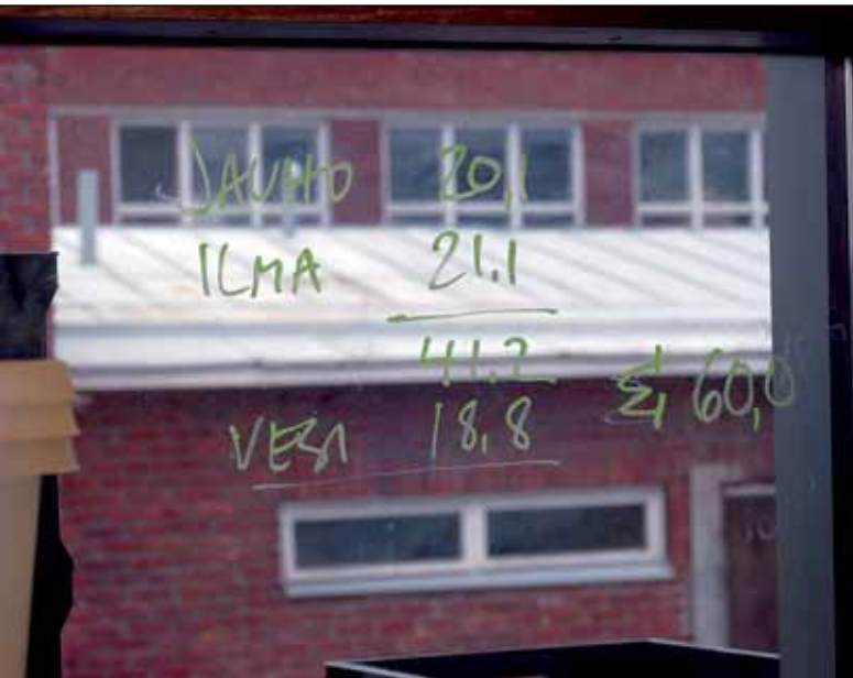
Matemaattinen leivontakaava: kun jauhojen, veden ja ilman lämpötilat lasketaan yhteen, yhteenlasketun summan on oltava tasan 60 astetta. Veden lämpöä muuttamalla saadaan säädettyä oikea tulos.