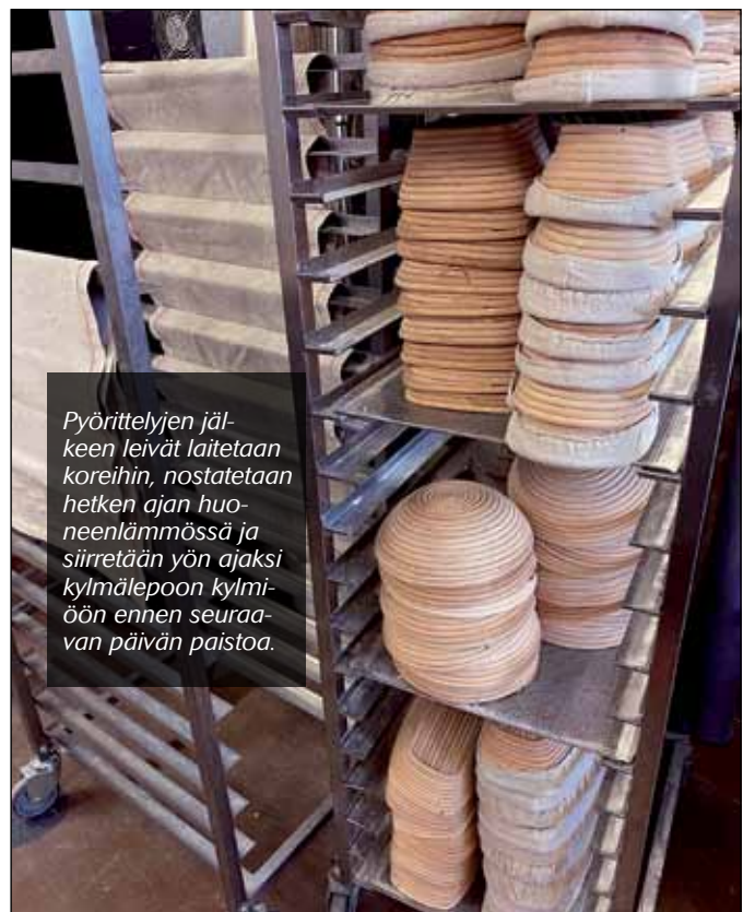
Pyörittelyjen jälkeen leivät laitetaan koreihin, nostatetaan hetken ajan huoneenlämmössä ja siirretään yön ajaksi kylmälepoon kylmiöön ennen seuraavan päivän paistoa.