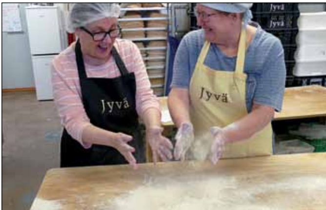
Viiden tunnin vierailumme Jyvään kulki yrityksen ja erehdyksen kautta kohti onnistumisen riemua, kiitos loistavan opettajan.