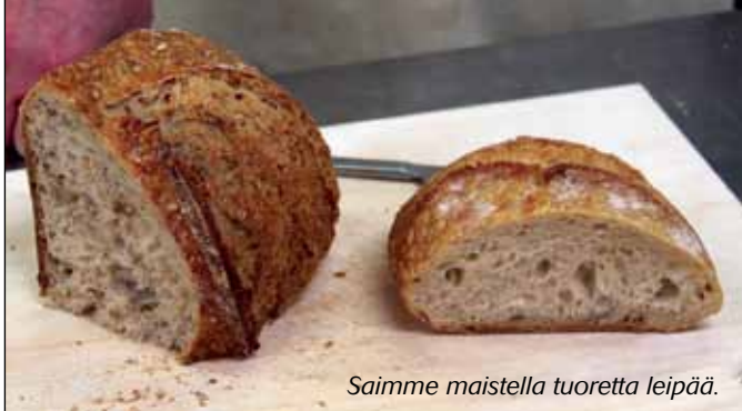
Saimme maistella tuoretta leipää.