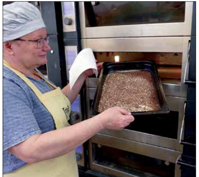
Oli aika laittaa leipiin käytettävät siemenet uuniin paahdumaan.