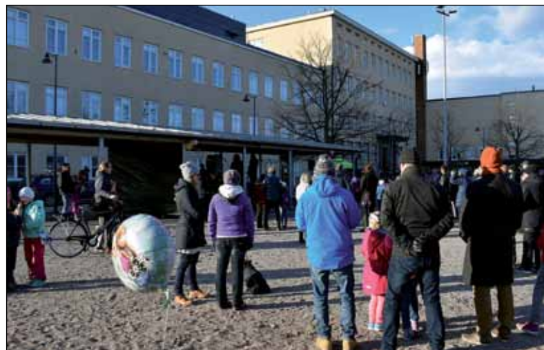
Kun Nekalan koulu oli vielä aktiivikäytössä vuonna 2017, Wiinikan Wappu toi koko kylän paikalle.

Kulttuurikeskukseen mahtuu työskentelemään vakiuisesti noin 40 kulttuurialan toimijaa, joista osa järjestää