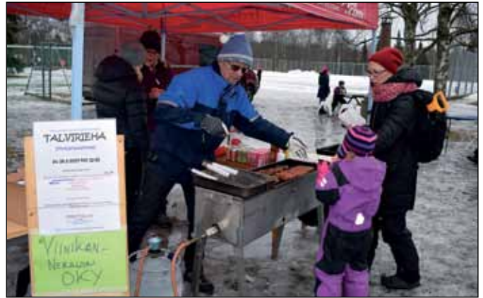
Perinteinen talvirieha järjestetään taas 21.2.2023 klo 17–19

kertaa vuodessa. Jakoalueita sanotaan piireiksi. Kiitokseksi järjestämme piirihenkilökoulutuksen saunomisen ja ruokailun merkeissä kerran vuodessa, tällä kertaa loppukeväästä. Lisätietoja vapaana olevista piireistä saa ja ilmoittautua voi osoitteessa viinikka.nekala@gmail.com .