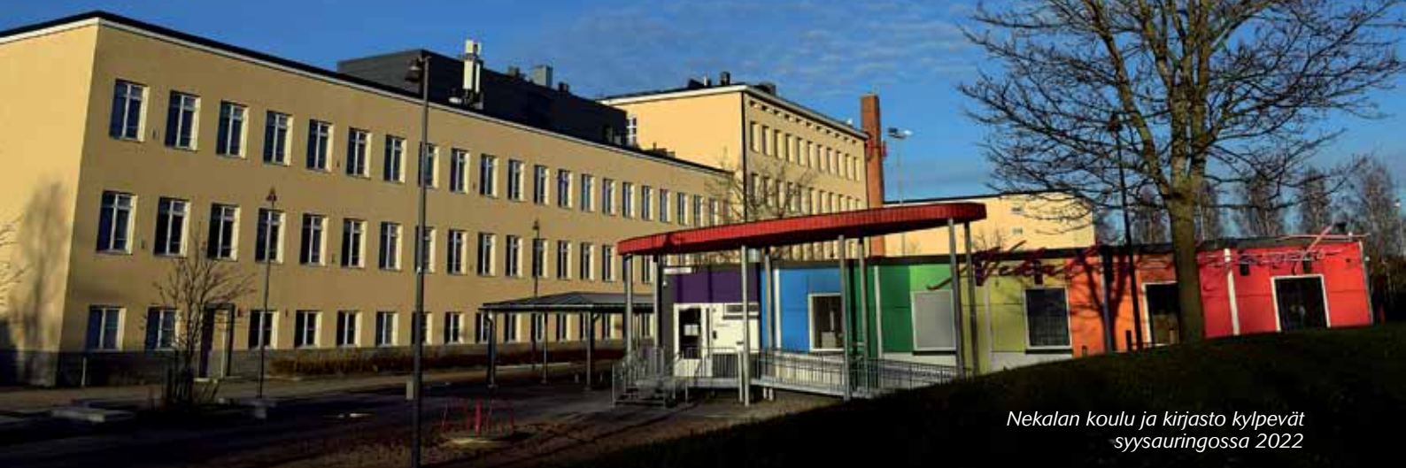
Nekalan koulu ja kirjasto kylpevät syysauringossa 2022