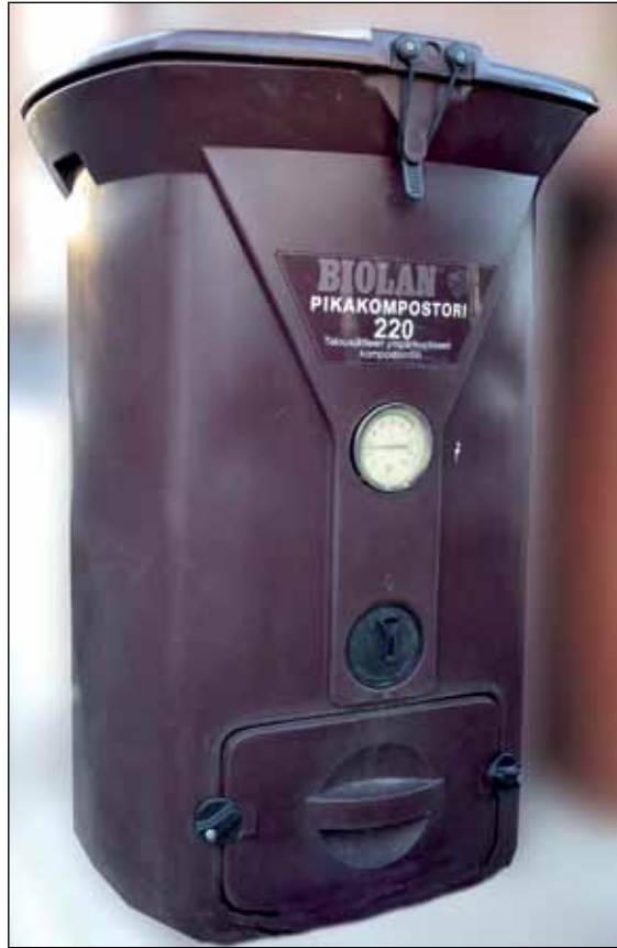
Kun biojätteen erilliskeräys tulee pakolliseksi syksyllä 2023, vaihtoehtoina ovat biojätteen omatoiminen kompostointi, biojättekimppa ja oma biojäteastia.