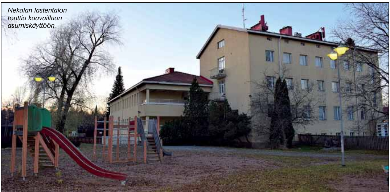
Nekalan lastentalon tonttia kaavallaan asumiskäyttöön.

Vuonna 1952 valmistuneessa Nekalan lastentalossa toiminut päiväkotisiirtyi uusiin tiloihin Mustametsään vuonna 2020. Suunnittelualueeseen Jokipohjantie 13:ssa kuuluu tontti 1 sekä tontin itäreunan viheralue, jolla sijaitsee muuntamora-kennus.