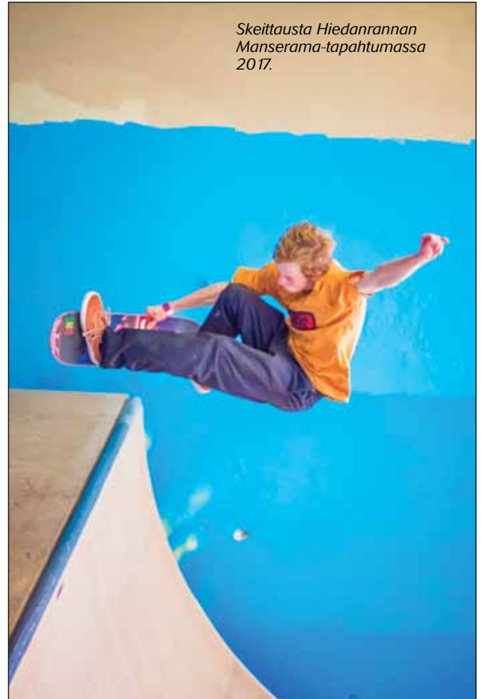
Skeittausta Hiedanrannan Manserama-tapahtumassa 2017.