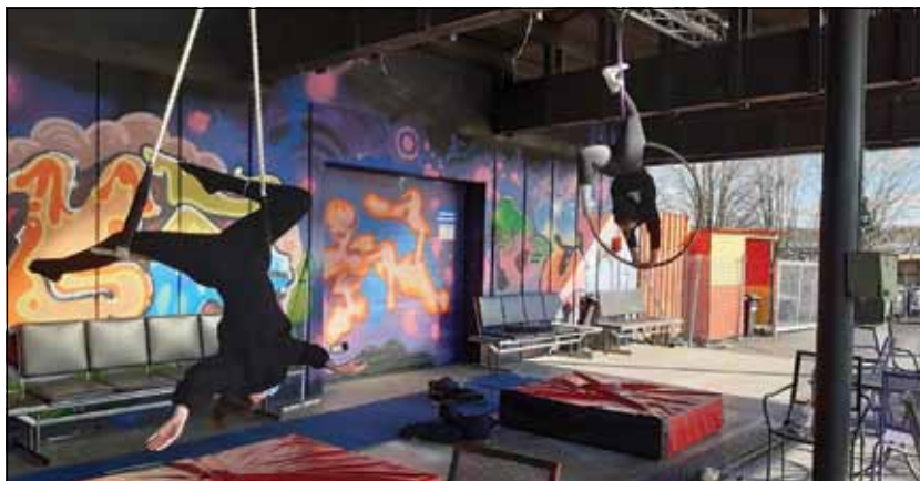
Ilmaryhmän ulkoarjoitukset.

tiin TV2:ssa pääsiäisenä. Tämä Pyjamasirkus on edelleen nähtävissä Yle Areenassa.